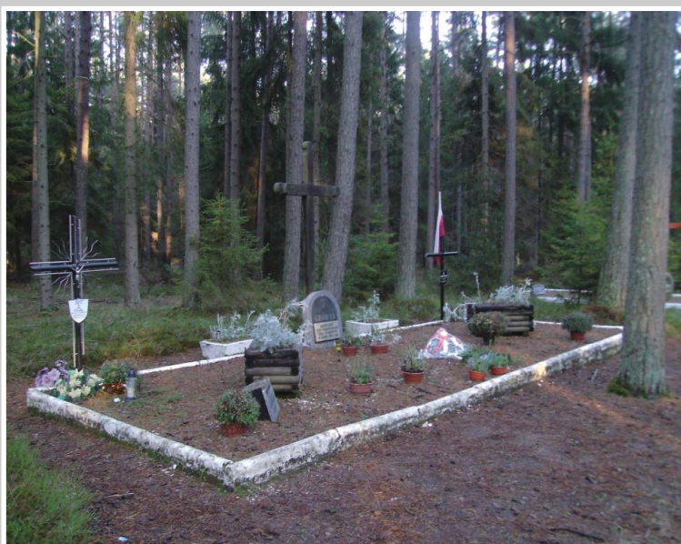
Miejsce pamięci w Piaśnicy