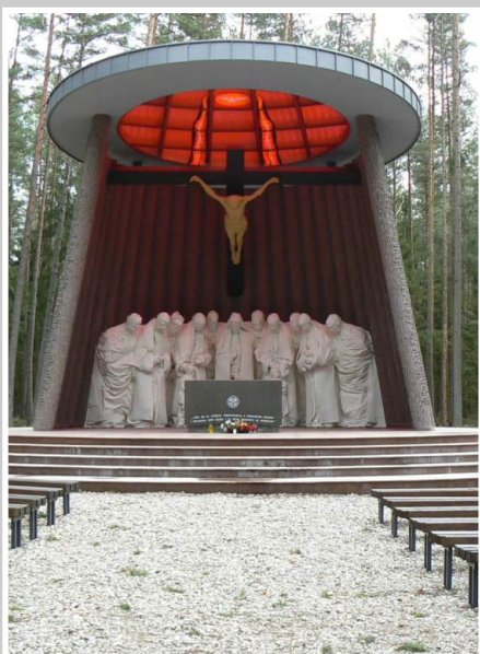
Kaplica Leśna w Piaśnicy