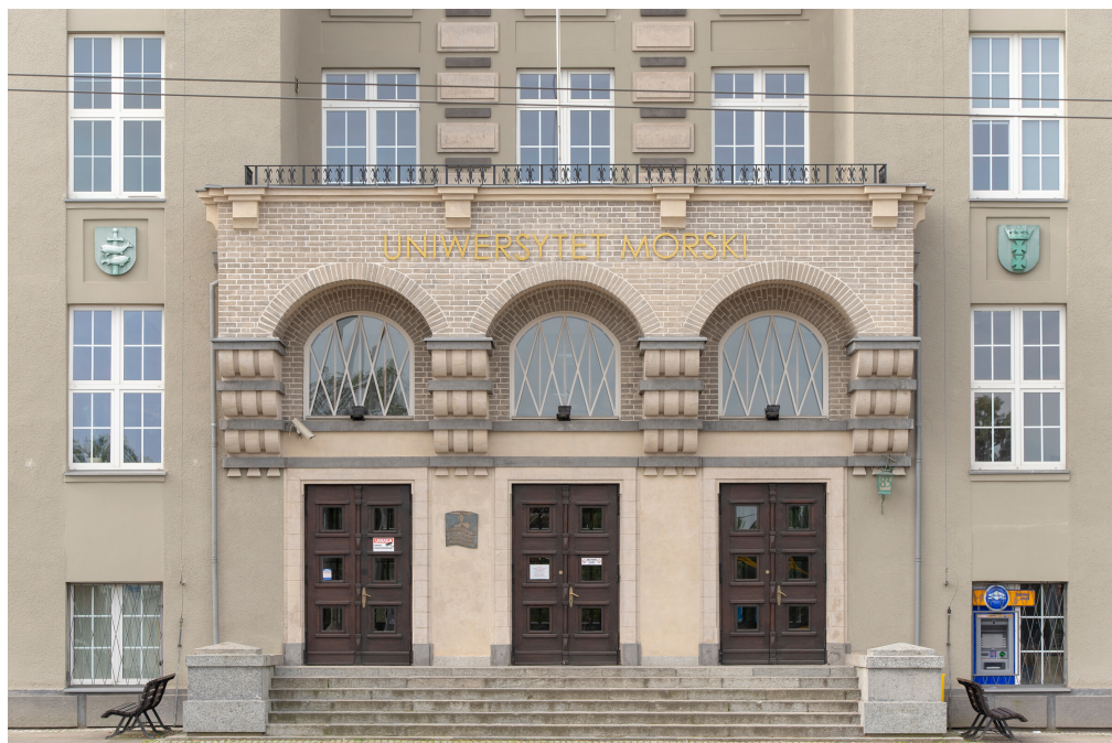
elewacja główna d. Państwowej Szkoły Morskiej, portal wejściowy