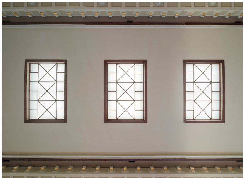
wnętrze d. Państwowej Szkoły Morskiej, aula, świetliki