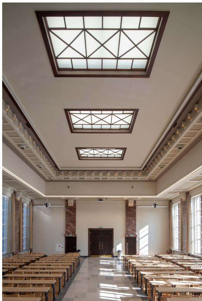
wnętrze d. Państwowej Szkoły Morskiej, aula