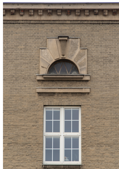
elewacja frontowa, detal