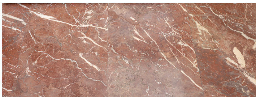
wnętrze d. Państwowej Szkoły Morskiej, aula, detal

Wzniesione w ramach kompleksu budynki to obiekty o prostych bryłach z symetryczną, historyzującą kompozycją elewacji wykończonych szarą cegłą cementową i podkreślonych dekoracyjnym detalem architektonicznym. Do reprezentacyjnych wnętrz, w tym auli d. Państwowej Szkoły Morskiej wprowadzono szlachetne materiały wykończeniowe, podkreślone dodatkowo górnym światłem z nowoczesnych świetlików. Architektura zespołu jest wyjątkowym przykładem połączenia form historyzmu z nowoczesnością. Kompleks w 1978 r. został wpisany do wojewódzkiego rejestru zabytków decyzją Pomorskiego Wojewódzkiego Konserwatora Zabytków w Gdańsku (nr w rejestrze wojewódzkim 1153).