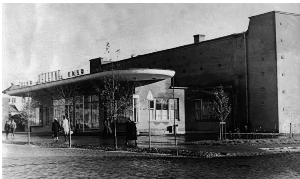
14. Kinoteatr „Zvaigzne” w Rēzekne, projekt typowy, 1960. Źródło: muzeum miasta Rēzekne, sygn. LgKM 8870.