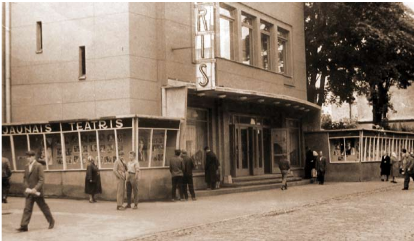
13. Witryny reklamy kinoteatru „Oktobris” („Film Palace”) 1961 roku, Vladimirs Šervinskis, 1934.

kinowych używano jak najbardziej elementów nowoczesnych – modernizmu i różnych odmian architektury art déco.