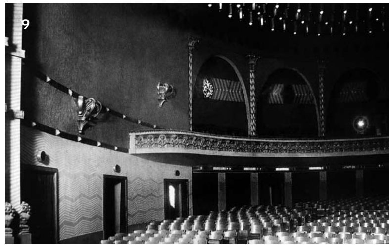
8, 9. Sala kinoteatru „Palladium” w Rydze, Pāvils Dreijmanis, 1925.

stych był usytuowany wśród niskiej, jakby wiejskiej, drewnianej zabudowy. Dzięki talentowi architekta Antonova, spodziewającego się rozkwitu tej ulicy, gmach uzyskał reprezentacyjny widok budynku miejskiego i w kontekście art déco, jak pisał Nikolaus Pevsner, był „efektem dokładnego namysłu nad funkcją i prawdziwie artystycznej wyobraźni” 10 .