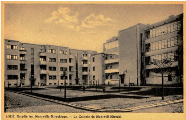
ŁÓDŹ. Osiedle im. Montwiła-Mireckiego. — La Colonie de Montwit-Mirecki.

10. Osiedle Montwiła-Mireckiego na Polesiu Konstantynowskim w Łodzi. Proj. arch. arch. Jerzy Berliner, Jan Łukasik, Miruta Słońska, Witold Szerszewski 1928, realizacja 1928-1933. Wyd. Polonia Kraków ok. 1935.