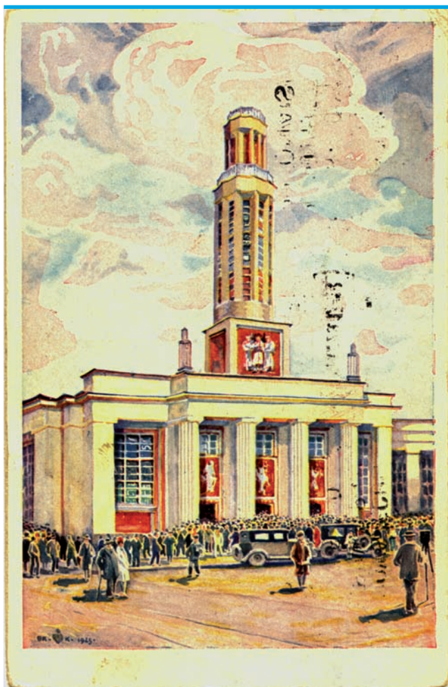
8. Pawilon recepcyjny Państwowej Wystawy Krajowej w Poznaniu. Proj. arch. Roger Sławski, realizacja 1928. Wyd. Polskie Towarzystwo Księgarni Kolejowych Ruch 1929. Mal. Bronisław Kopczyński. Fragment korespondencji na odwrocie: „Zmęczona, ale zachwycona wszystkim”

padkach niełatwo byłoby dziś ustalić autorstwo danego projektu.