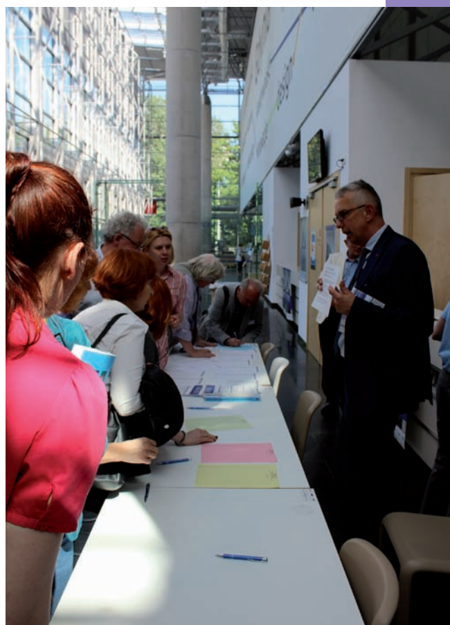
Uczestnicy konferencji przy recepcji w holu Centrum Konferencyjnego PPNT