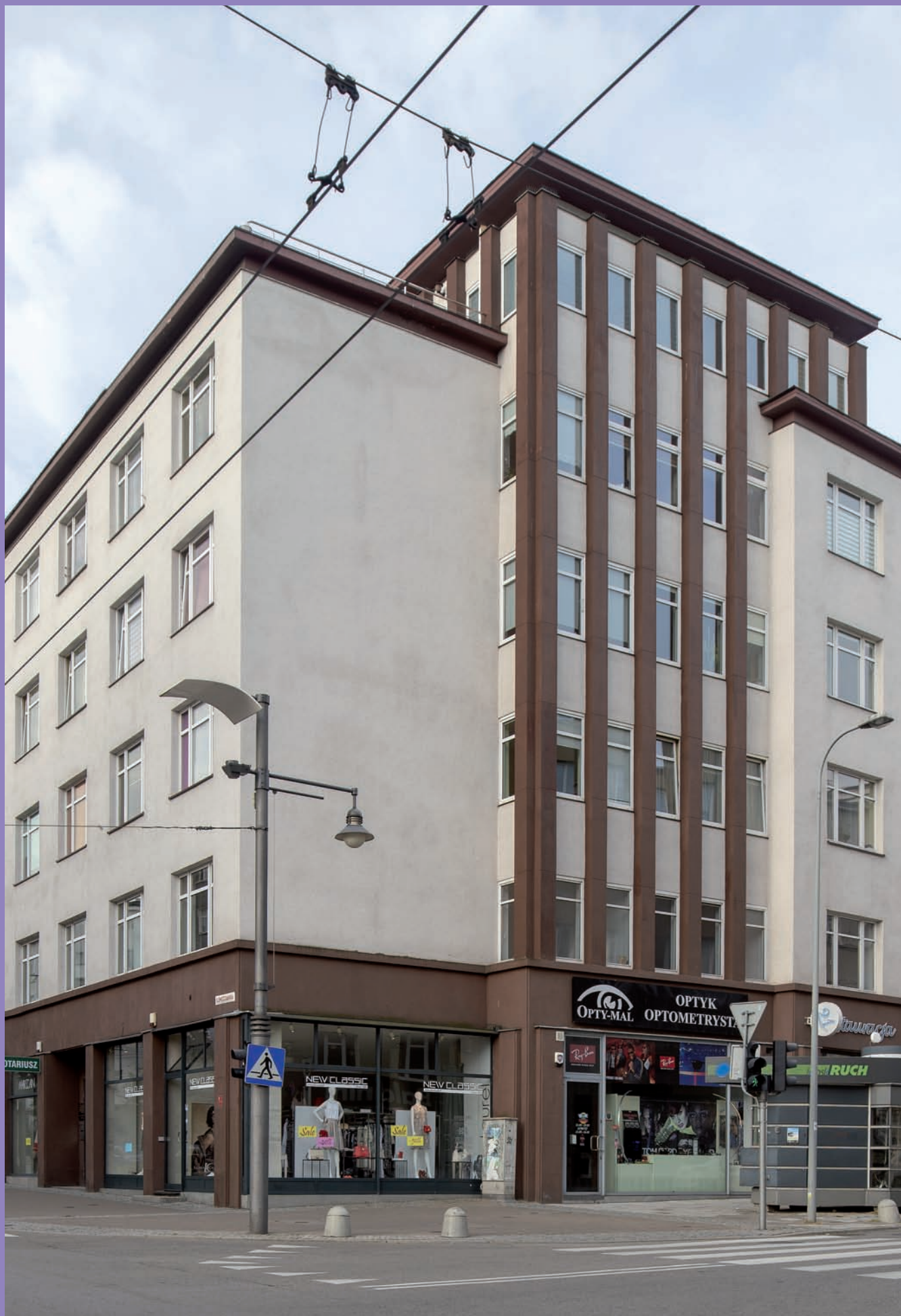
Kamienica firmy PAGED (Polska Agencja Eksportu Drewna) przy ul. Świętojańskiej 44, proj. Jan Bochniak, widok ogólny