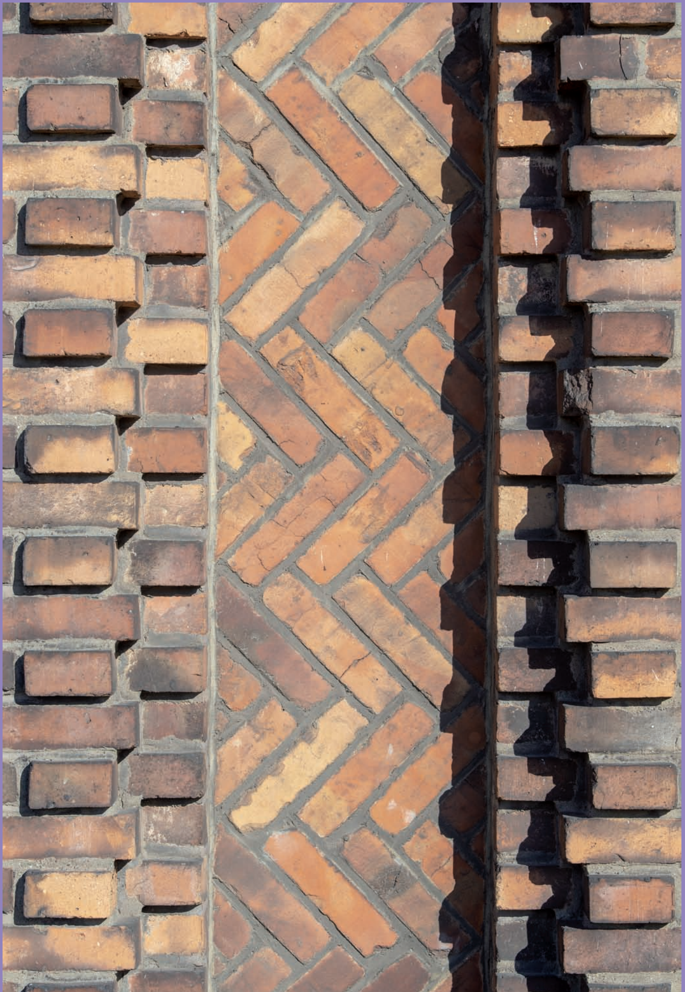
Chłodnia portowa przy ul. Polskiej 20, proj. Ateliers B. Lebrun, Societe Anonyme, Nimy, detal elewacji