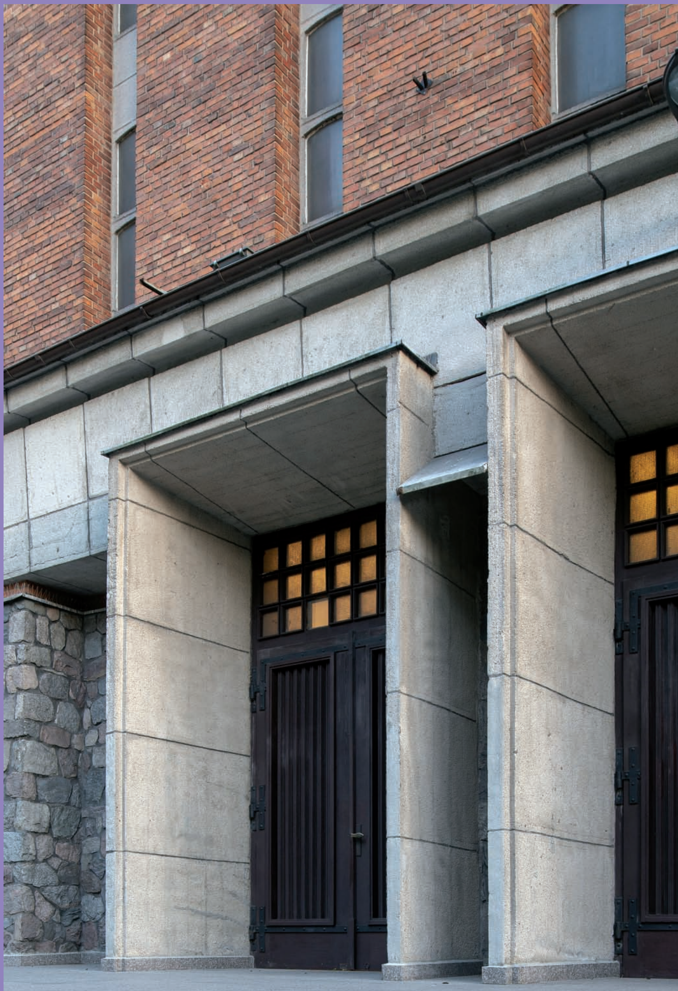
Zespół kościoła parafialnego p.w. św. Antoniego Padewskiego i klasztoru franciszkanów przy ul. Ujejskiego 40, proj. Zbigniew Kupiec i Tadeusz Kossak, wejście główne do kościoła parafialnego