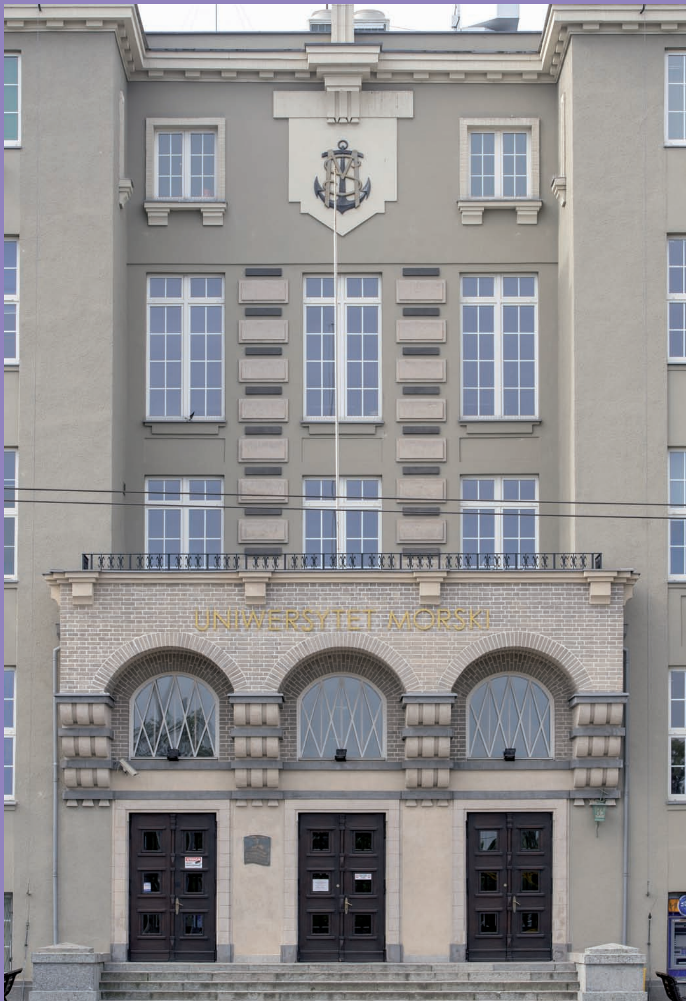
Budynek Szkoły Morskiej, obecnie Uniwersytet Morski przy ul. Morskiej 81-87, proj. Wacław Tomaszewski, fragment budynku głównego z reprezentacyjnym portalem