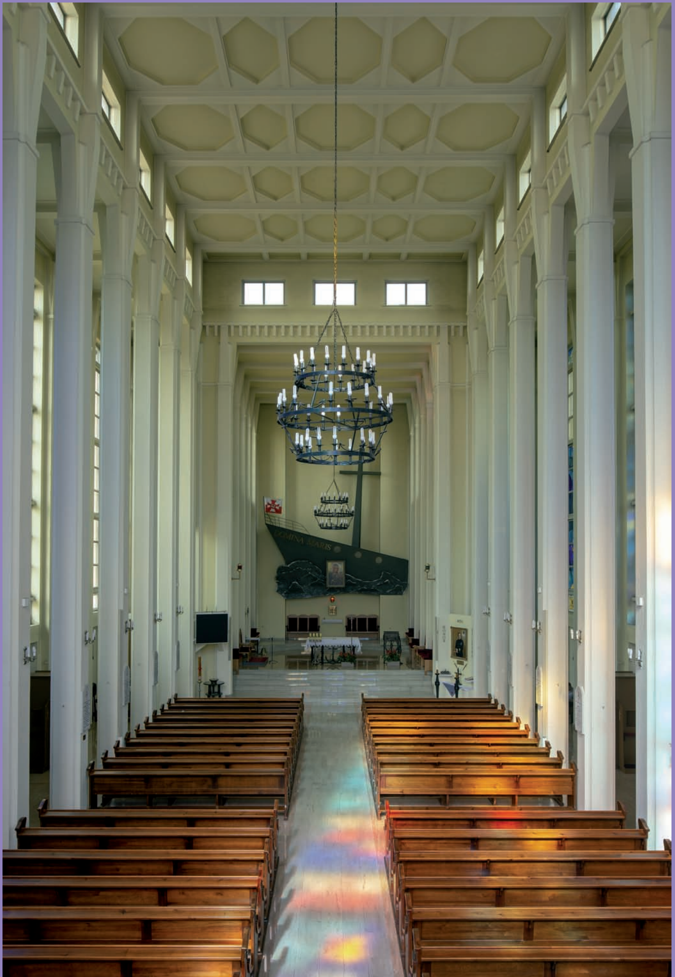
Kościół garnizonowy Marynarki Wojennej RP p.w. Matki Boskiej Częstochowskiej przy ul. Śmidowicza 45A, proj. Marian Lalewicz, wewnątrz