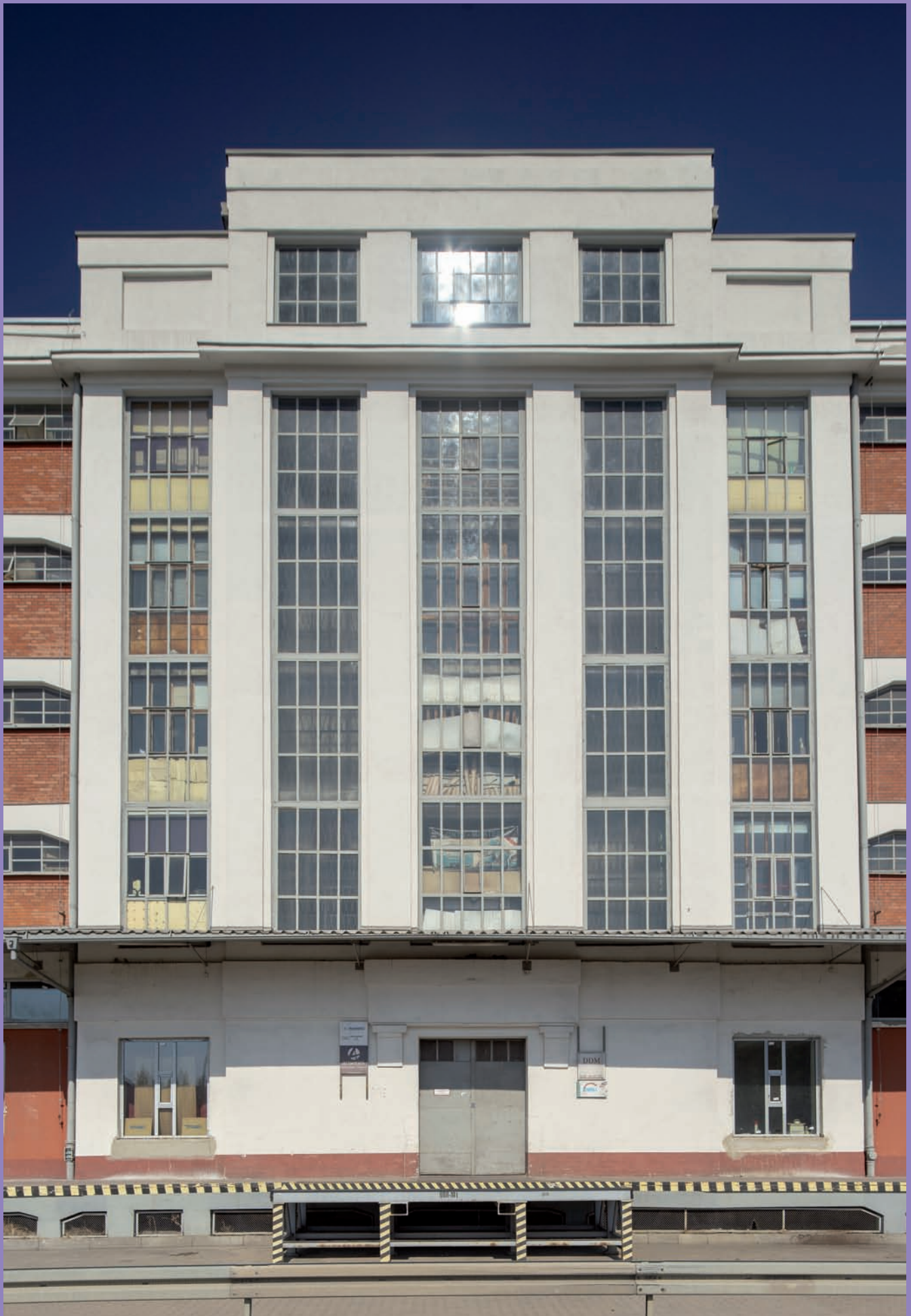
Magazyn długoterminowy H przy ul. Polskiej 17, fragment elewacji