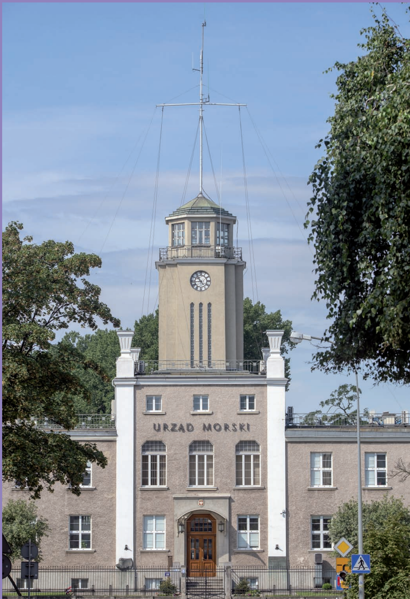
Urząd Morski przy ul. Chrzanowskiego 10, widok ogólny