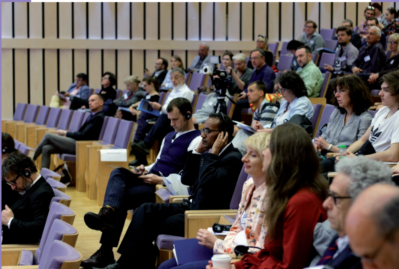
Widzowie na sali obrad w Centrum Konferencyjnym Pomorskiego Parku Naukowo-Technologicznego w Gdyni Redłowie