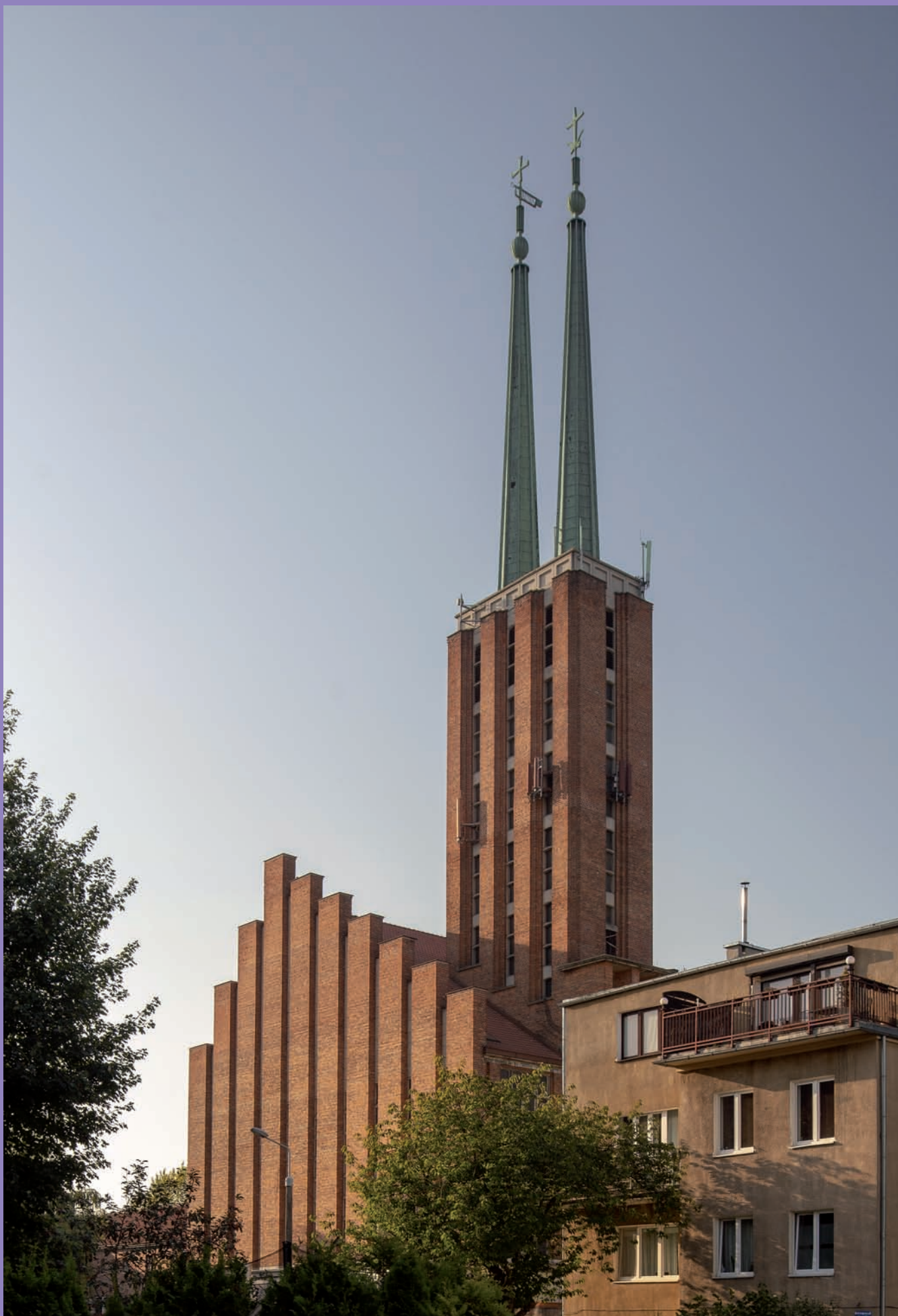
Zespół kościoła parafialnego p.w. św. Antoniego Padewskiego i klasztoru franciszkanów przy ul. Ujejskiego 40, proj. Zbigniew Kupiec i Tadeusz Kossak, wieża kościoła parafialnego