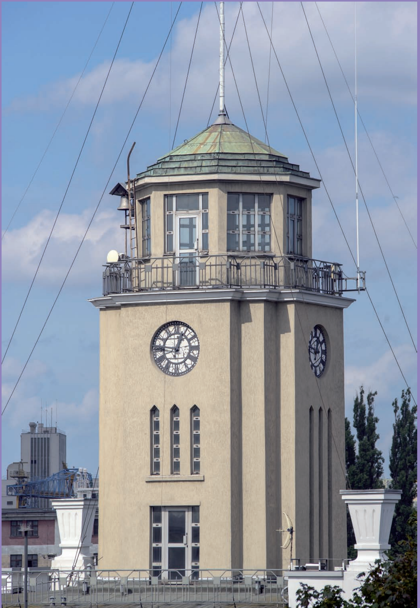
Urząd Morski przy ul. Chrzanowskiego 10, wieża