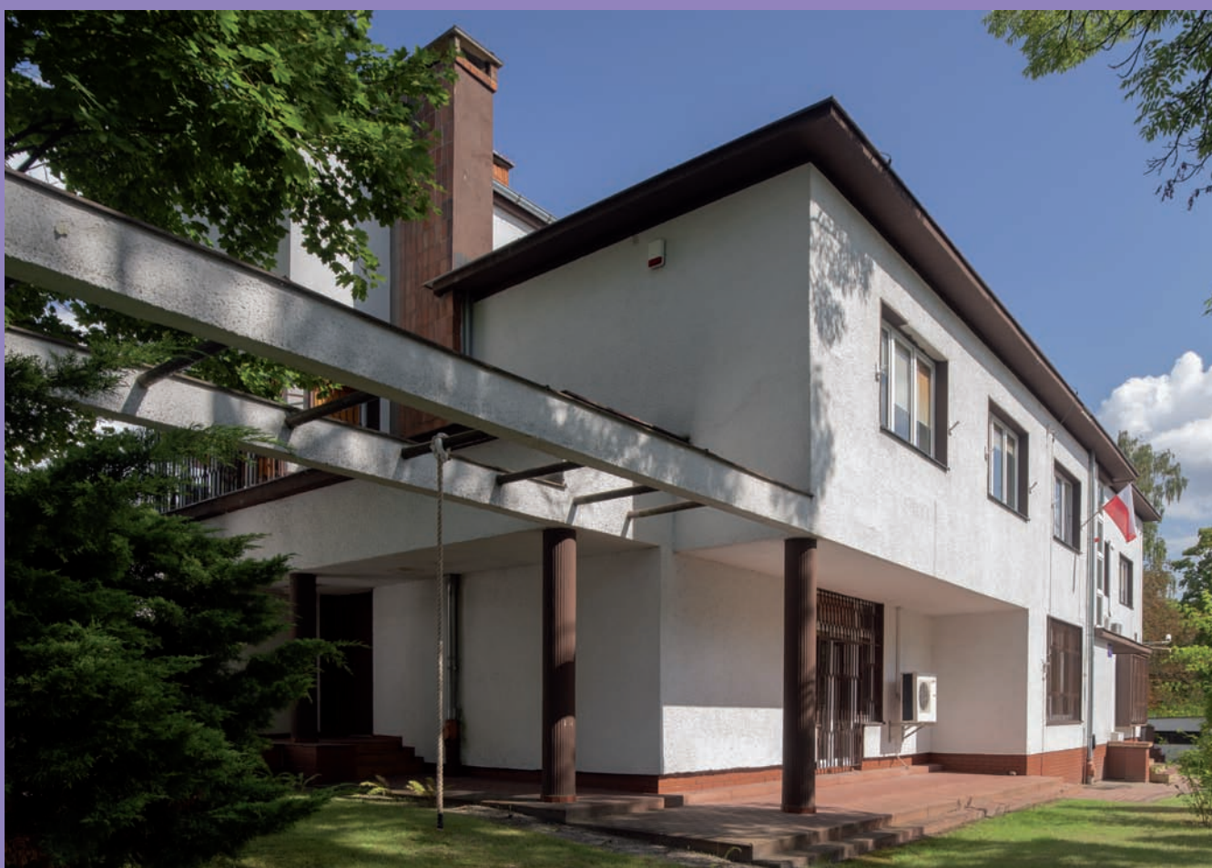
Willa hrabiny Magdaleny Łosiowej przy ul. Korzeniowskiego 7, proj. Zbigniew Kupiec, Tadeusz Kossak