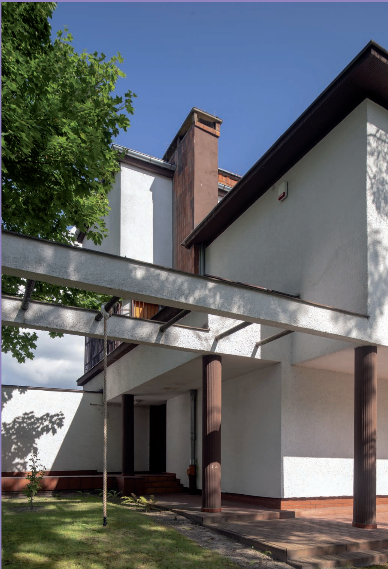
Willa hrabiny Magdaleny Łosiowej przy ul. Korzeniowskiego 7, proj. Zbigniew Kupiec, Tadeusz Kossak