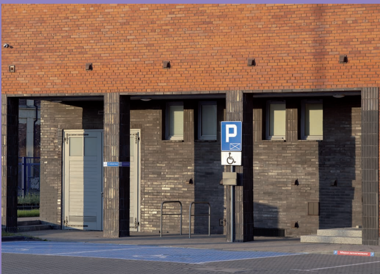
Budynek biurowo-magazynowy „Bananas” przy ul. Polskiej 21, widok ogólny i fragment elewacji z podcieniem