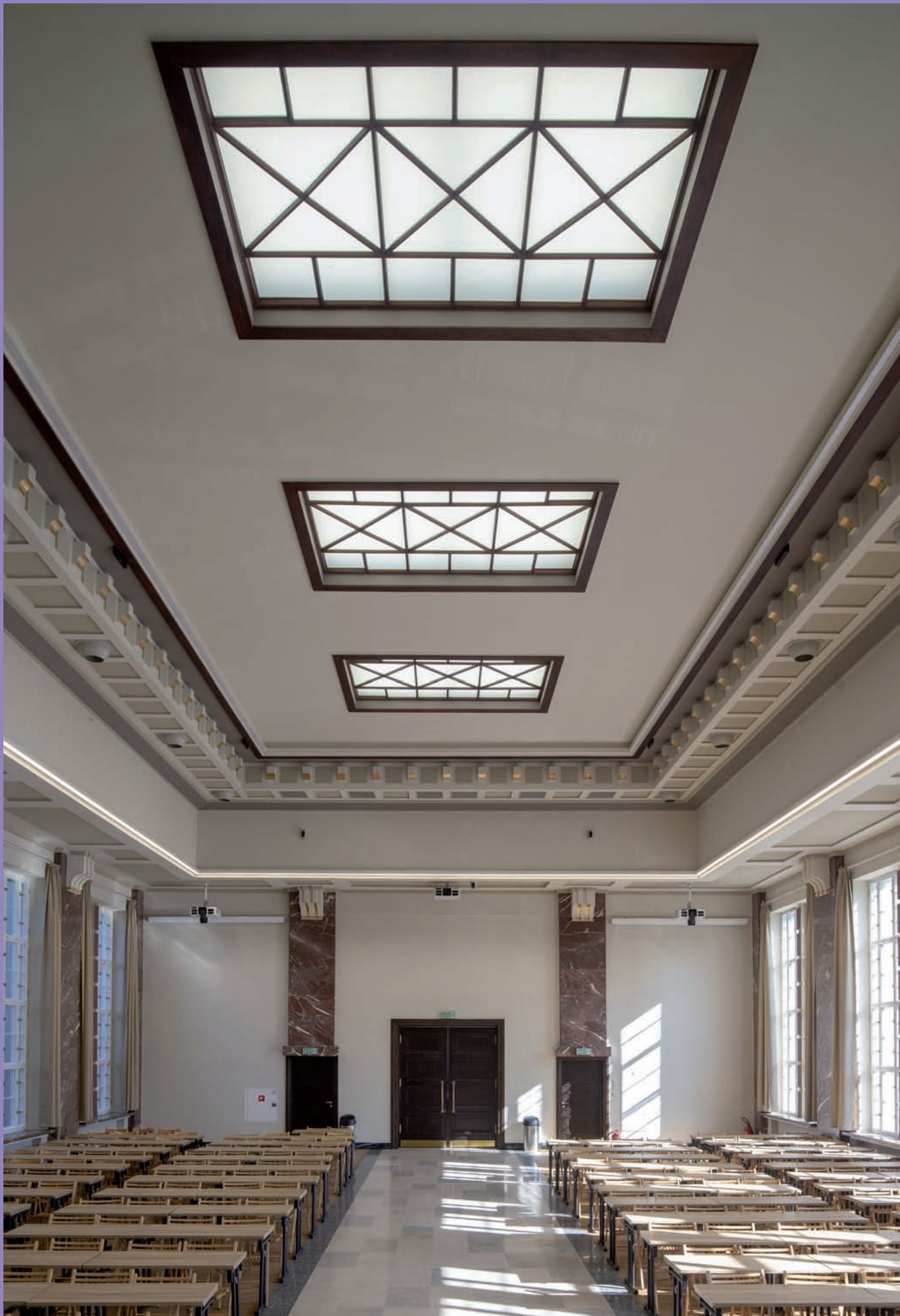
Budynek Szkoły Morskiej, obecnie Uniwersytet Morski przy ul. Morskiej 81-87, proj. Wacław Tomaszewski, wnętrze auli