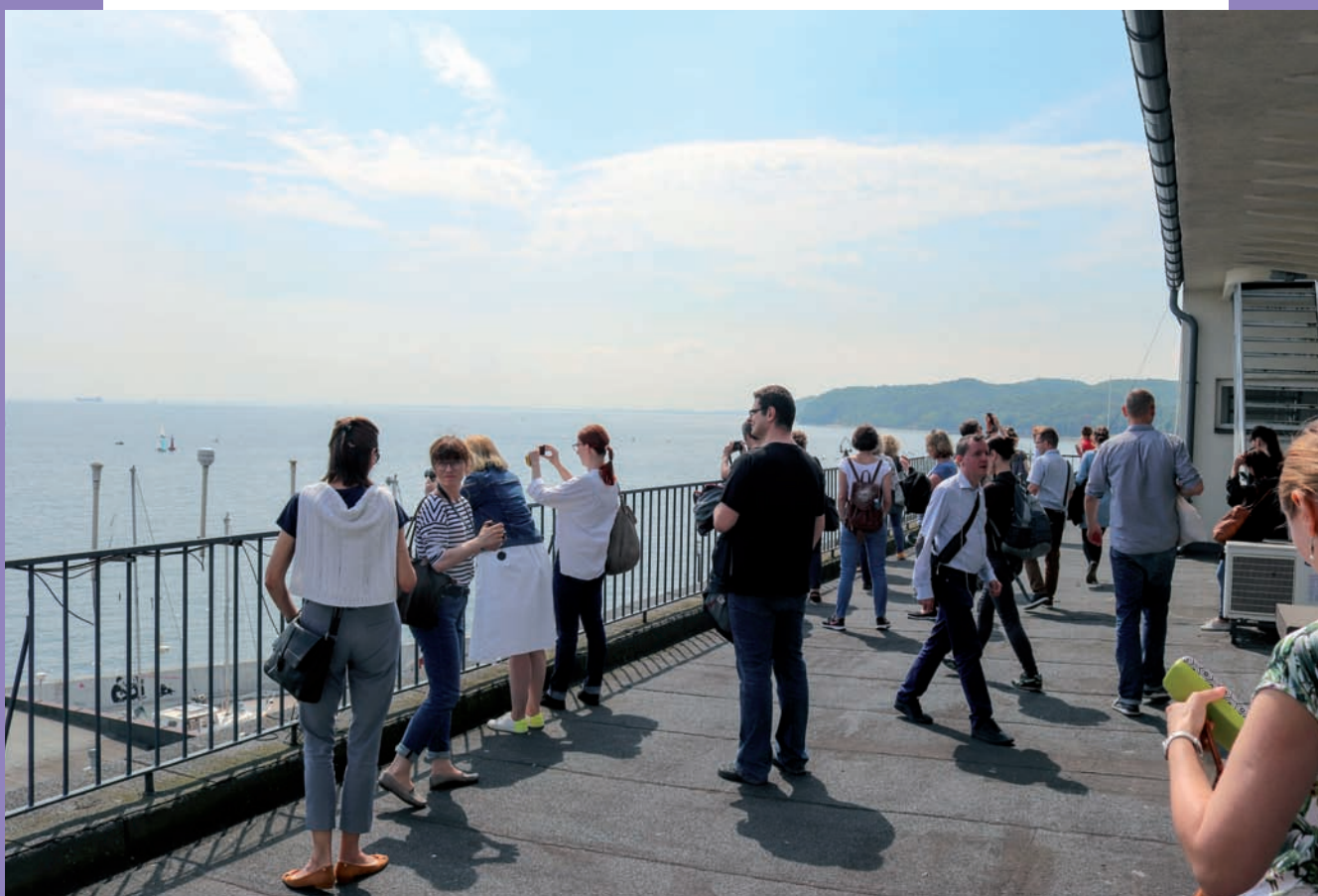
Uczestnicy konferencji na tarasie historycznego Domu Żeglarza Polskiego (obecnie siedziba Wydziału Nawigacyjnego Uniwersytetu Morskiego) na Molo Południowym