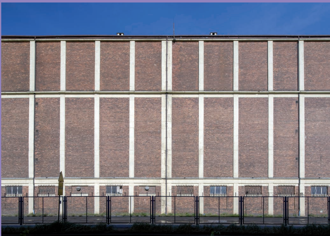
Chłodnia portowa przy ul. Polskiej 20, proj. Ateliers B. Lebrun, Societe Anonyme, Nimy, widok ogólny i fragment elewacji