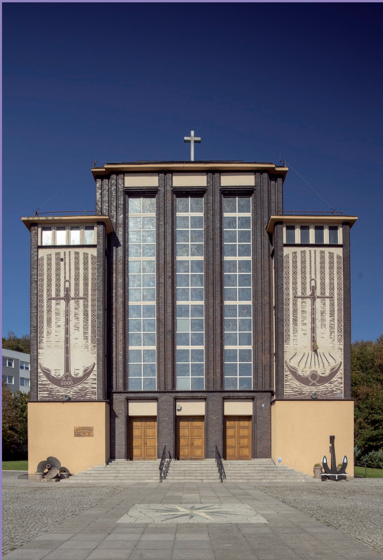
Kościół garnizonowy Marynarki Wojennej RP p.w. Matki Boskiej Częstochowskiej przy ul. Śmidowicza 45A, proj. Marian Lalewicz, elewacja frontowa