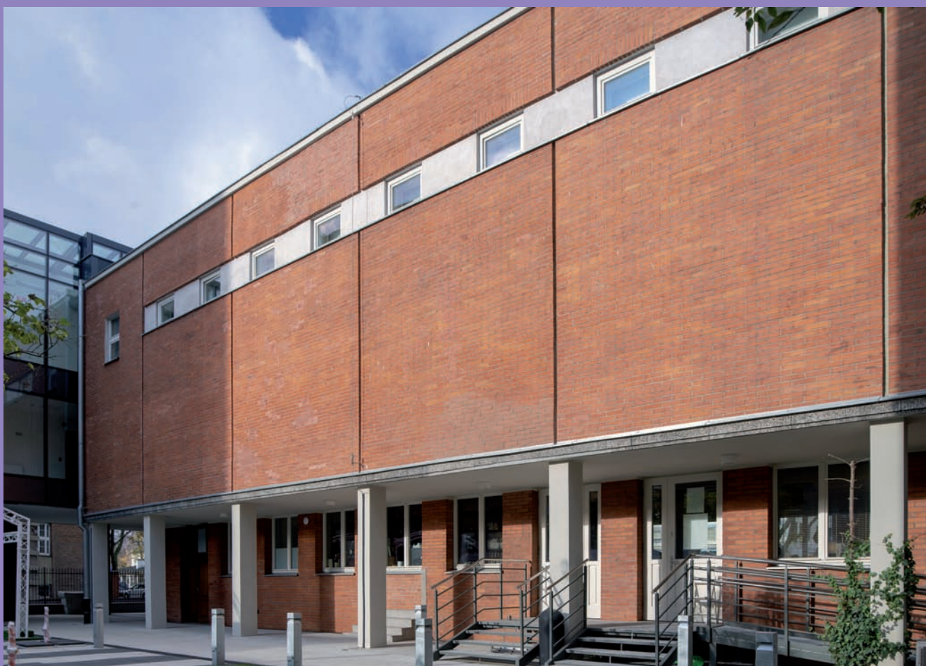
Dom Marynarza Szwedzkiego, obecnie Konsulat Kultury przy ul. Jana z Kolna 25, proj. Stanisław Płoski, widok ogólny i wewnętrzny dziedziniec