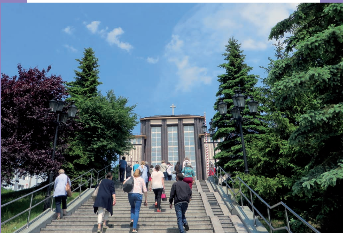
Zwiedzanie modernistycznego kościoła garnizonowego w Gdyni Oksywiu