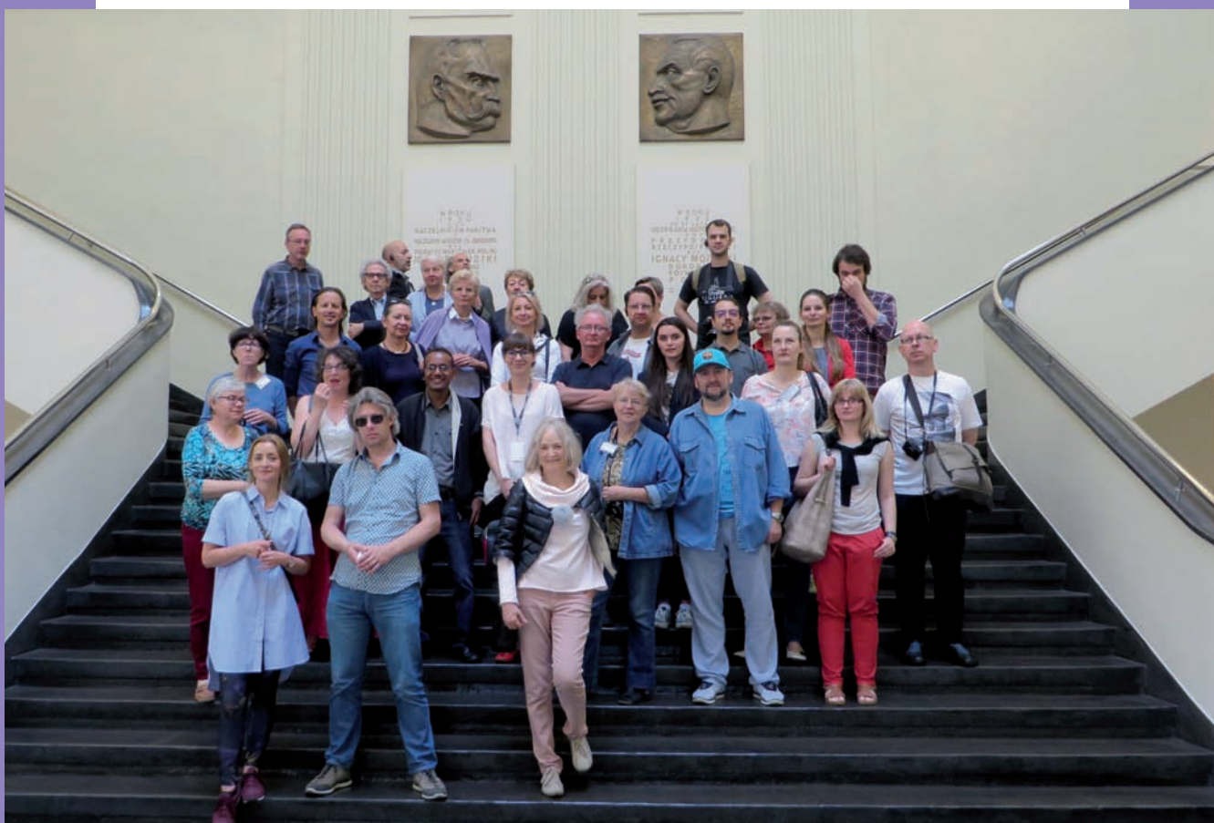
Grupa zwiedzająca port gdyński na schodach w holu dawnego Dworca Morskiego obecnie Muzeum Emigracji przy ul. Polskiej 1