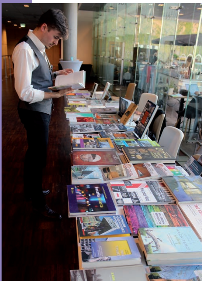
Stoisko z publikacjami na temat architektury modernistycznej w holu Centrum Konferencyjnego PPNT