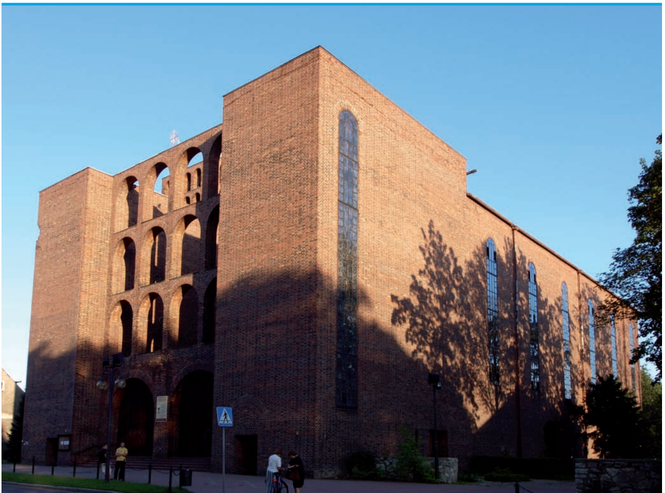
3. Kościół p.w. Św. Józefa w Zabrzcu, arch. Dominikus Böhm, 1931 (fot. J. B. Uherek-Bradecka, 2011)