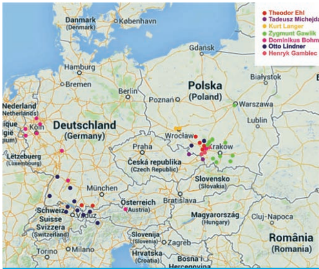
2. Mapa przedstawiająca lokalizacje europejskich realizacji autorów działających także na Śląsku

ce regionu z uwzględnieniem jego podziału na Dolny Śląsk i Górny Śląsk. Obszar ten otaczają regiony kulturowo odrębne: Łużyce, Wielkopolska, Małopolska, Morawy i Czechy.