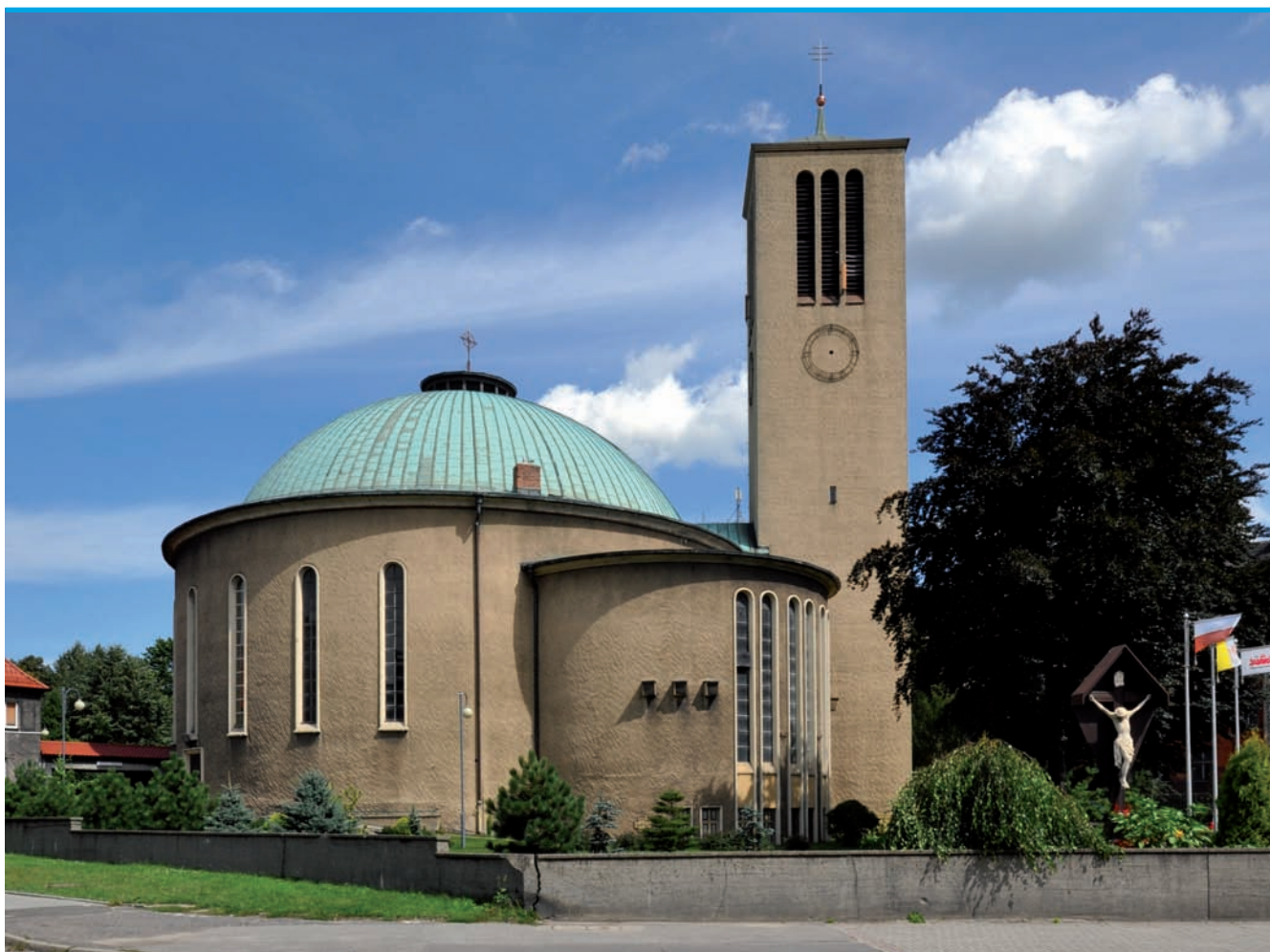
5. Kościół p.w. Podwyższenia św. Krzyża w Bytomiu, arch. Otto Lindner, 1936-37, (fot. J. Rabiej, 2014)

Modernizm charakteryzuje radykalne przeobrażenia kulturowe przełomu XIX i XX wieku. Wzrost jego popularności w Europie w latach 20. i 30. XX wieku związany był bezpośrednio z rozpadem kształtowanego od stuleci porządku, który nastąpił z końcem pierwszej wojny światowej. Powojenna fala przewartościowań geopolitycznych, społecznych i światopoglądowych okazała się impulsem dla kreatorów idei