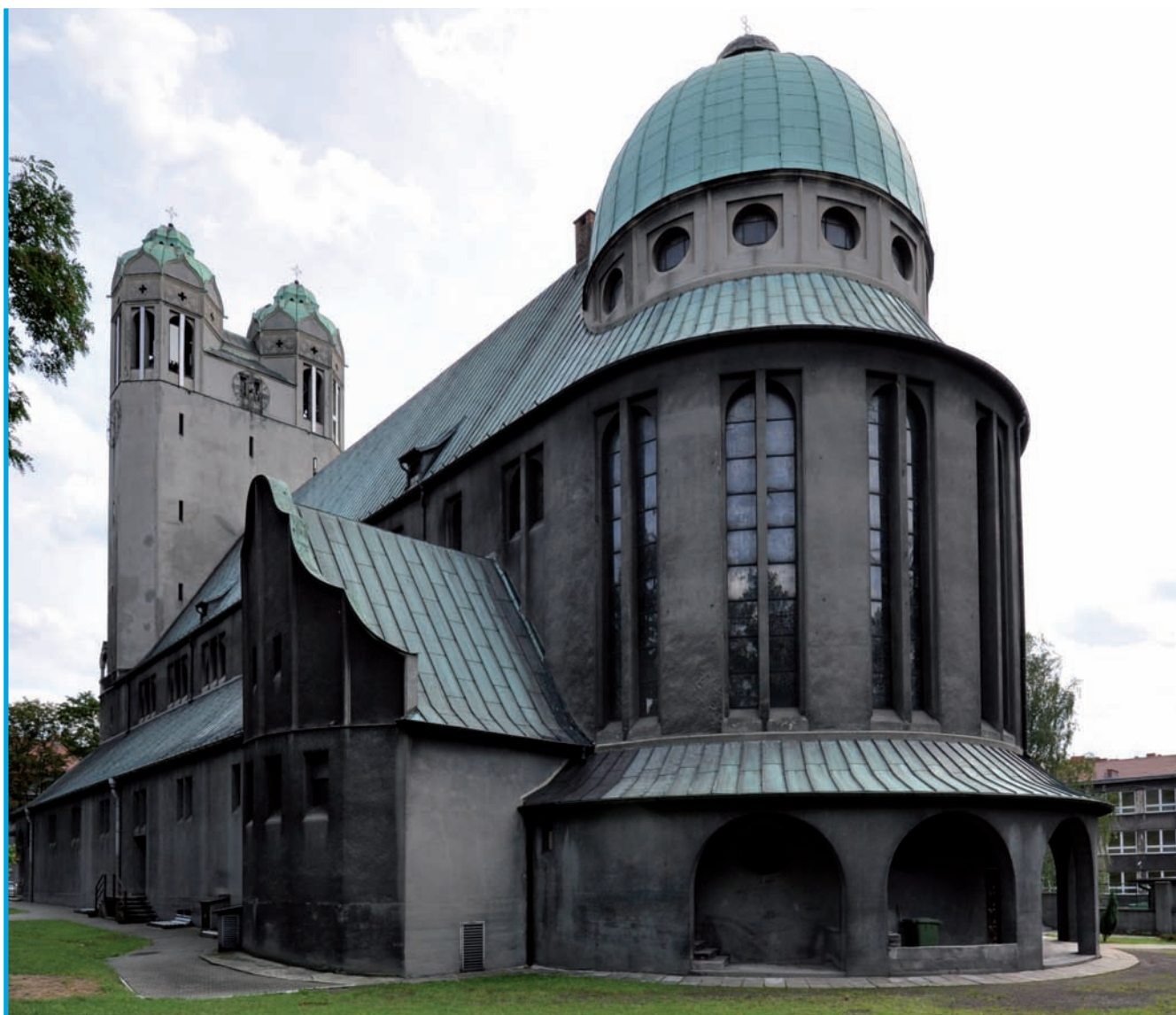
6. Kościół p.w. Św. Barbary w Bytomiu, arch. Teodor Ehl, 1928-29

„epoki nowoczesnej”. Jej wyrazami stały się koncepcje: „nowej Europy”, „nowego społeczeństwa”, „nowego człowieka”. W tworzonych wzorcach „nowoczesnego życia” wyeksponowaną rolę zajęła architektura - ahistoryczna, funkcjonalna, uniwersalna.