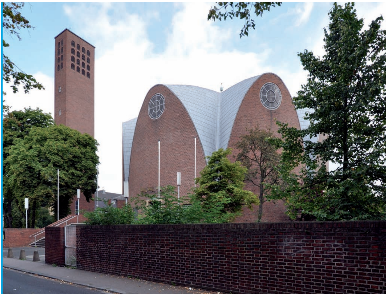
1. Kościół p.w. Św. Engelberta w Kolonii, arch. Dominikus Böhm, 1932

Złożoność uwarunkowań stwarza trudności w precyzyjnym określeniu obszaru badań pod względem terytorialnym. Granice Śląska zmieniały się wielokrotnie w dwudziestoleciu międzywojennym. Po I wojnie światowej Górny Śląsk podzielono pomiędzy trzy państwa: Republikę Weimarską, Czechosłowację i Rzeczpospolitą Polską. Przyjęto historyczne grani-