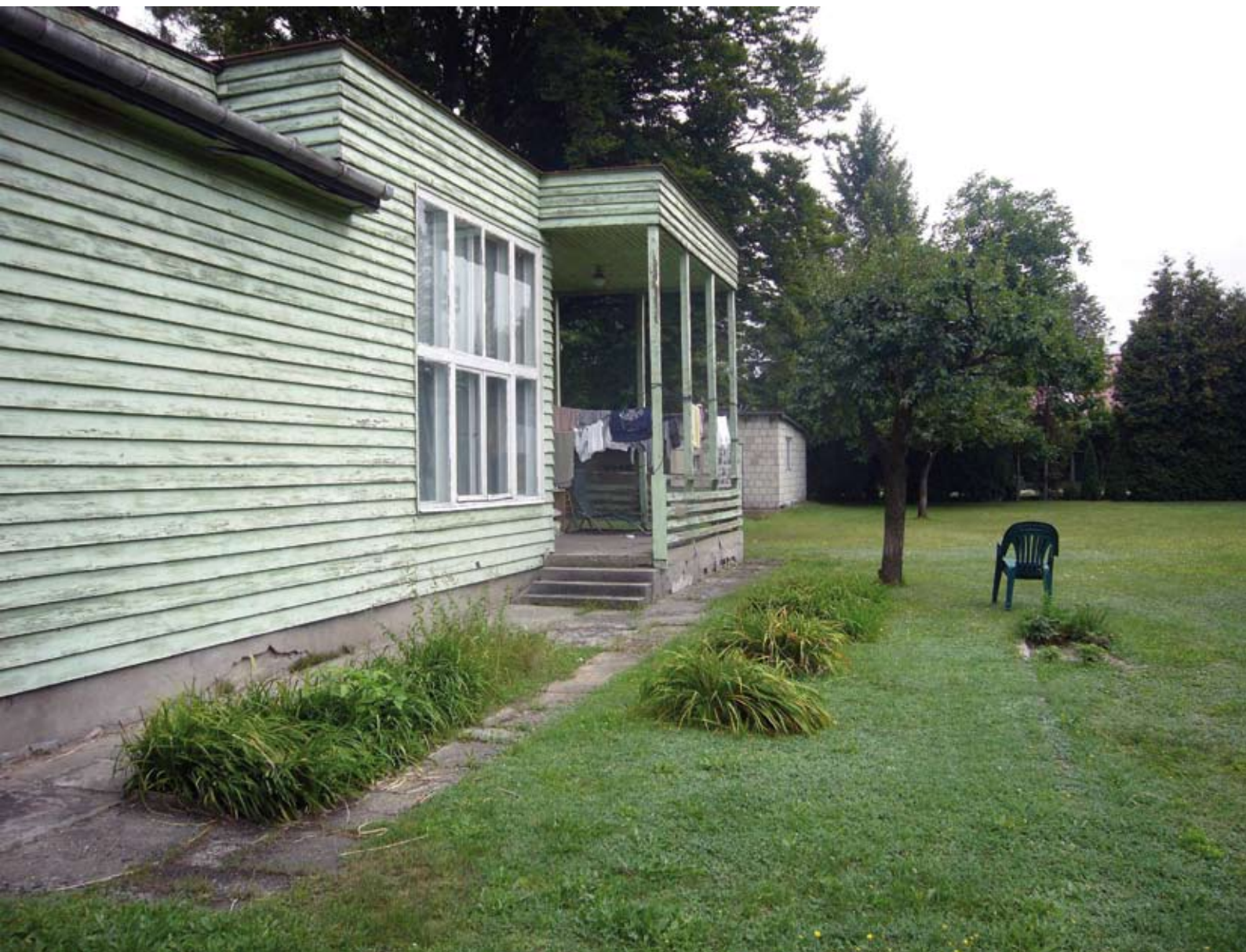
4. Połączenie tarasu z ogrodem przez schody, stan obecny (fot. D. Bagińska, 2018)