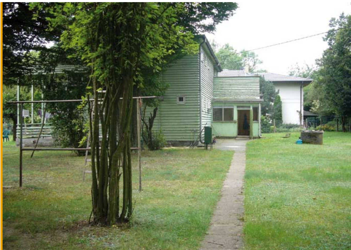
3. Prosta ścieżka wiodąca od furtki do wejścia do domu, stan obecny