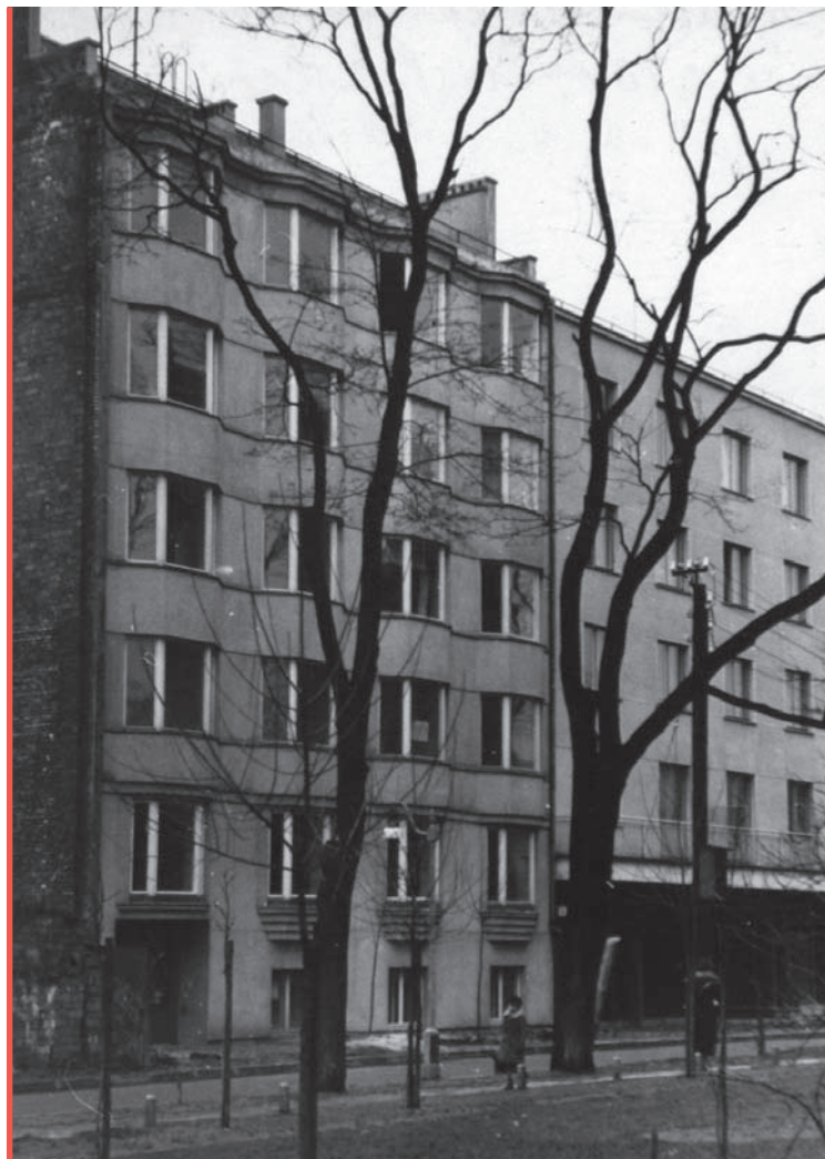
4. Dom dochodowy Józefa Handzelewicza przy ul. Frascati 1, proj. J. Gelbard, R. Sigalin, 1934, w głębi budynek mieszkalny Funduszu Emerytalnego BGK przy ul. Frascati 3, proj. B. Lachert, J. Szanajca, 1936

Kwartał ujęty ulicami: Wiejska, Frascati, Konopnickiej i Prusa pozostawał niezabudowany do poło-