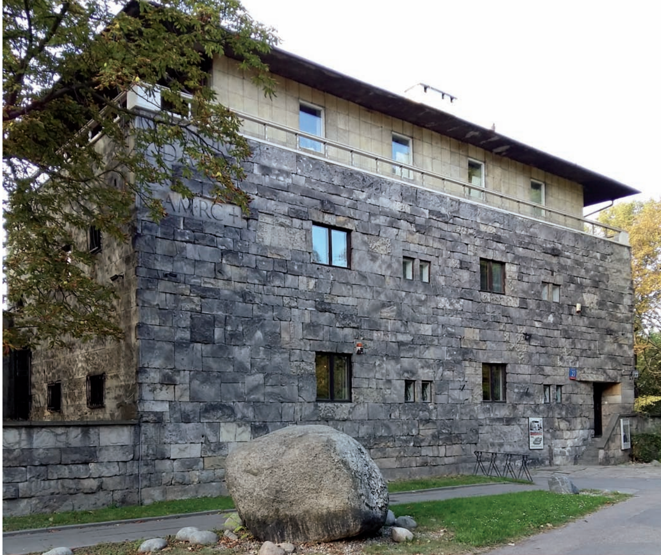
1. Willa własna architekta przy Alei na Skarpie, proj. B. Pniewski, 1937

drogą dojazdową do pałacu Branickich a aleją wytyczoną na Skarpie; strefę zabudowy zwartej przy swobodnie prowadzonych nowych ulicach pomiędzy wąwozem zbiegającym do ul. Książęcej, ul. Wiejską, terenem Instytutu Głuchoniemych, a ul. Książęcą; strefę zwartej monotonicznie rozwiązanej zabudowy niższego standardu na dolnym tarasie, za ul. Rozbrat. Niezabudowane tereny na Skarpie i u jej podnóża miały być podzielone na ogrody należące do rezydencji proponowanych na koronie Skarpy, po wschodniej stronie alei. Uznanie sądu konkursowego zyskało przeprowadzenie ulicy, późniejszej Senackiej, od wjazdu na teren Frascati w kierunku Alei na Skarpie. Zaproponowane w projekcie rozwiązanie placu wjazdowego na teren Frascati, zorganizowanego wokół kordegard z 1819 r., weszło do wszystkich późniejszych opracowań planistycznych omawianego terenu i zostało usankcjonowane prawnie zarówno po względem układu promieniście wychodzących ulic – Frascati i Senackiej, jak i podkreślającego symetrię wysunięcia ku ul. Wiejskiej ryzalitów dwóch budynków flankujących wjazd.