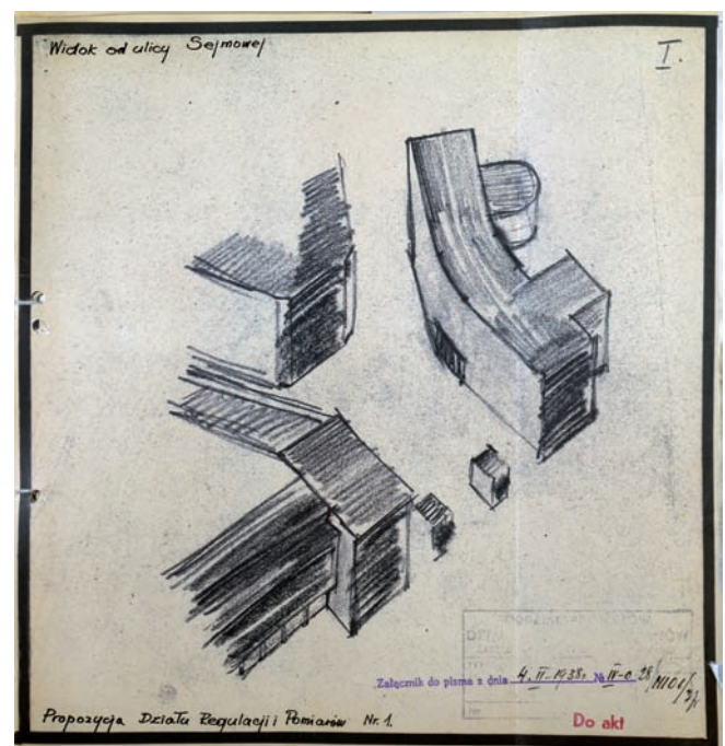
7. Szkic aksonometryczny jednej z wersji rozwiązania zabudowy placu wjazdowego na tereny Frascati od ul. Wiejskiej, propozycja Działu Regulacji i Pomiarów, 1938