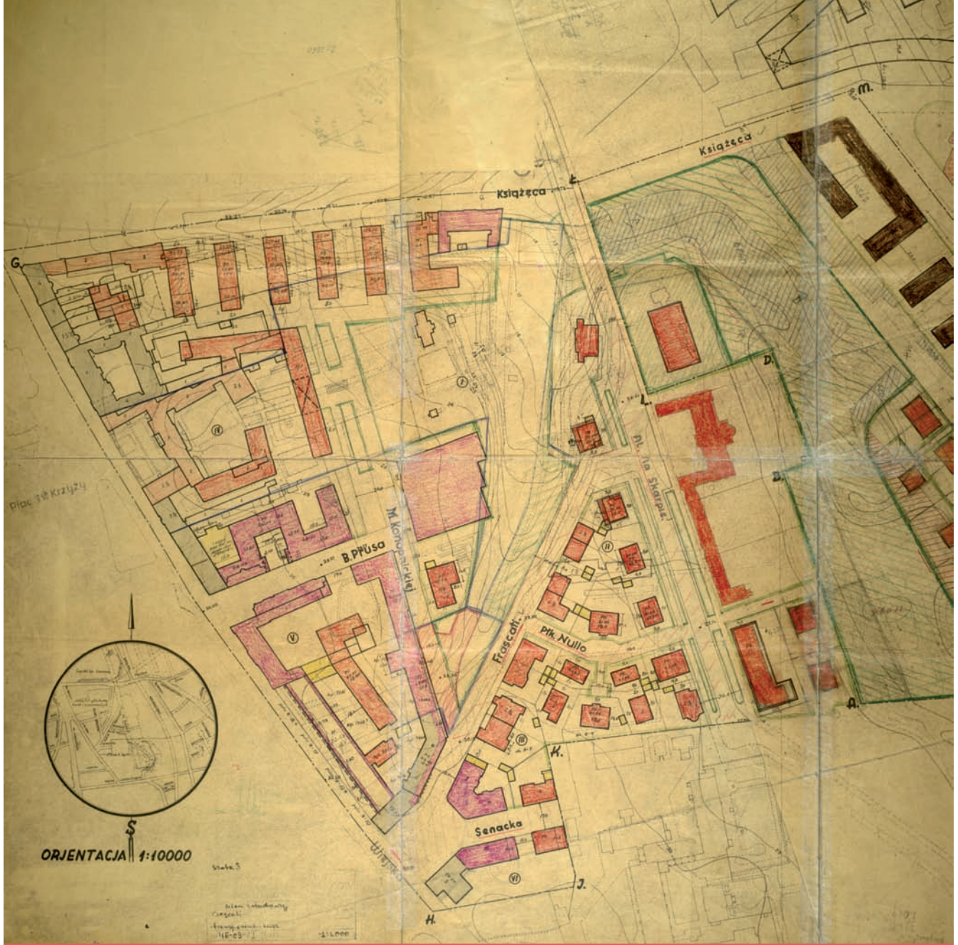
3. Rysunek ogólnego i szczegółowego planu zabudowania terenów Frascati, uchwalonego w sierpniu 1936, Archiwum Miasta Stołecznego Warszawy, Akta Nieruchomości

w formach architektura cechowała się wysmakowanymi proporcjami poszczególnych elementów kompozycyjnych i starannie opracowanym detalem architektonicznym. Licowanie elewacji z obramieniem otworów okiennych i kartuszem herbowym nad wejściem wykonano z jasnego piaskowca. Zwartą, prostą bryłę budynku wieńczyła wycofana ostatnia kondygnacja, motyw spotykany wówczas w architekturze Warszawy. W ten sposób projektant odniósł się do zapisu nakazującego zachowanie wysokości 2,5 kondygnacji, obowiązującego w tej lokalizacji 7 .