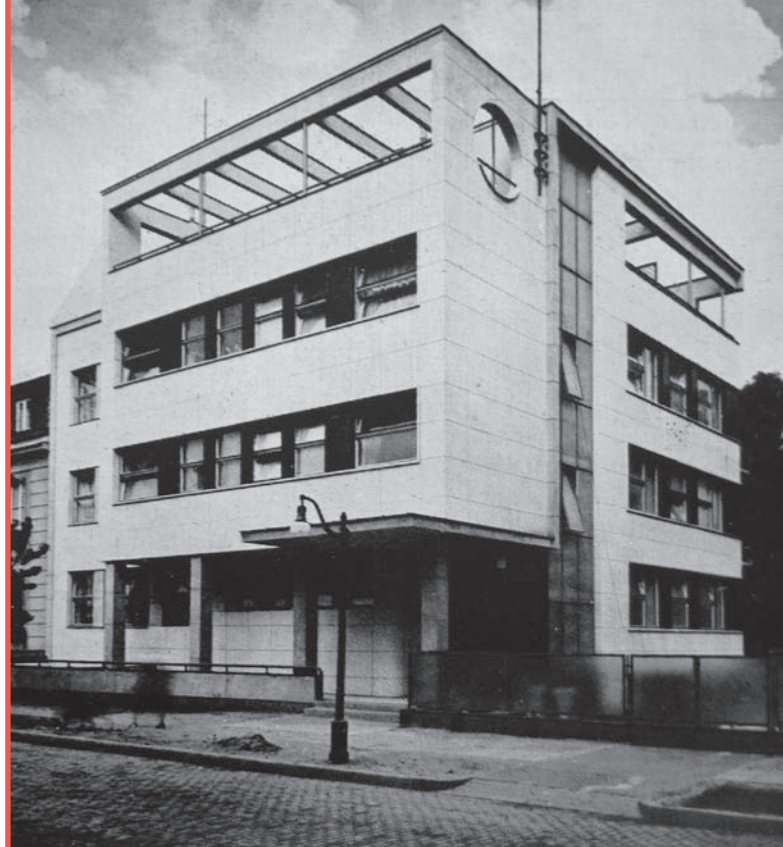
2. Dom Chmielewskich przy ul. Frascati 4, proj. K. Schayer, 1937-38

Niezależnie od przeciągających się procedur planistycznych, na nabywanych parcelach wytyczonych w planie z 1926 r. przy Alei na Skarpie oraz ulicach Frascati i Nullo podejmowano roboty budowlane. Należy się domyślać, że działki proponowano w pierwszym rzędzie krewnym, przyjacielom i znajomym, ogólnie mówiąc - osobom z towarzystwa, za czym przemawia fakt, że w maju 1936 r. na 11 sprzedanych działek 7 należało do Lubomirskich, Tarnowskich i Tyszkiewiczów. Pałac Branickich wynajmowany wcześniej poselstwu rumuńskiemu, stał się siedzibą ambasady Francji. Podjęto wówczas prace modernizacyjne według projektu Alfonsa Graviera. Sąsiadujący od północy z pałacem Branickich Pałac na Górze wynajęty został ambasadzie Chin. W 1928 r. poselstwo Austrii podjęło