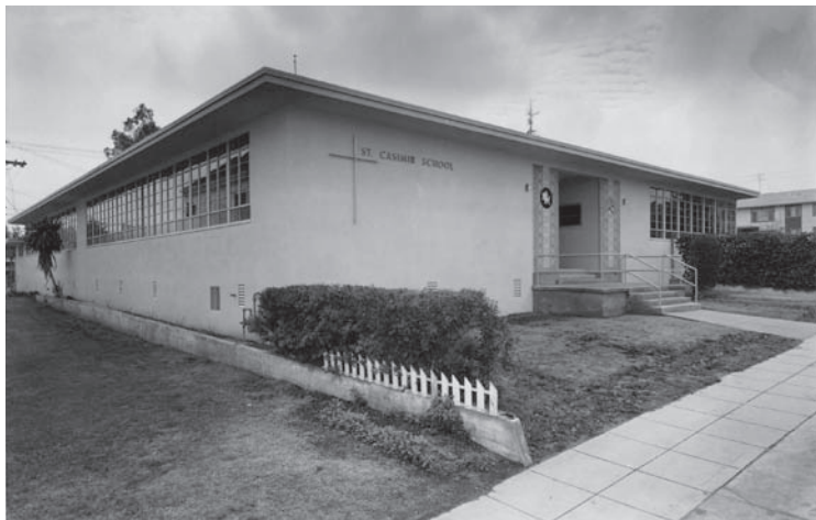
7. Los Angeles (Kalifornia), litewska szkoła parafialna Św. Kazimierza, 2718 St George St, zbudowana w 1959 r. Pięcioklasowa konstrukcja zaprojektowana przez Williama Browna, została w 1963 r. rozbudowana o trzy dodatkowe sale

7. Los Angeles, CA, St. Casimir's Lithuanian parochial school, 2718 St George St, built in 1959. The five-classroom structure designed by William Brown was expanded in 1963 to include three additional classrooms