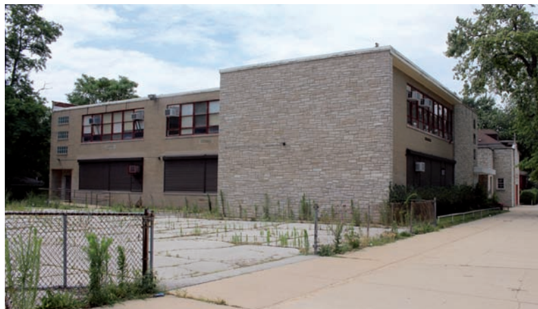
6. Chicago (Illinois), dwupiętrowa szkoła parafialna w zabudowie bliźniaczej i budynki kościelne parafii Św. Józefa, 2647 E 88th St, zbudowane w 1953 r.

1. Warunki do zakładania litewskich szkół parafialnych w Stanach Zjednoczonych zostały stworzone, gdy dopuszczono powstanie parafii narodowych. Ponieważ musiały być w pełni utrzymywane przez członków, mogły służyć tylko im. Proces zakładania szkół litewskich był podobny jak w przypadku innych grup narodowych w USA. Jakość nauczania w tych szkołach nadzorowały inspekcje zewnętrzne. Parafie zakładały szkoły we współpracy z archidiecezją, a prowadziły je głównie siostry z zakonu Św. Kazimierza, który został specjalnie utworzony dla litewskiego szkolnictwa