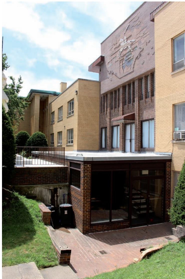
4. Chicago (Illinois), Litewskie Centrum Młodzieży, 2345 W 56th St, założone przez jezuitów w 1957: po lewej budynki zrealizowane w 1958 r. (architekt Jonas Kova-Kovalskis), w centrum obiekt zbudowany w 1974 r. (architekt Jonas Mulokas). Budynek wyposażony jest w kaplicę, galerię, archiwum, pomieszczenia Instytutu Pedagogicznego, litewską szkołę weekendową oraz imprezy