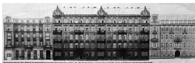
5. Błędnie przedstawiony widok obecnej pierzei oraz równie zafałszowana wizualizacja projektu odtworzenia dekoracji fasady („Gazeta Wyborcza”, 23.XI.2007 r.)

do pierwotnego”. Ilustracja ta została przedstawiona przypadkowo lub z zamysłem zafałszowania widoku pierzei ulicy, przez zdublowanie elewacji budynku nr 13. Uzyskany w ten sposób obraz fragmentu ulicy nie odzwierciedla spodziewanego stanu po ewentualnym przeprowadzeniu inwestycji, sugerując dwukrotnie większą skalę, a więc i pośrednio również odpowiednio większy efekt przedsięwzięcia (il. 5).