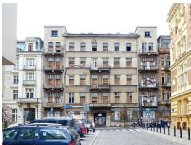
3. Obecny widok fasady