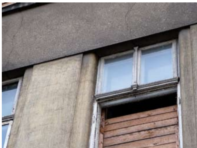
4. Detal zachowanych rozwiązań nowej fasady