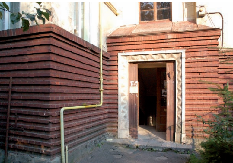
4. Lwów, zespół zabudowy Spółdzielni Własna Strzecha, ul. Nad Jarem 7, (ob. ul. Energetyczna), 1925-1931. Ceglana dekoracja wejścia do budynku