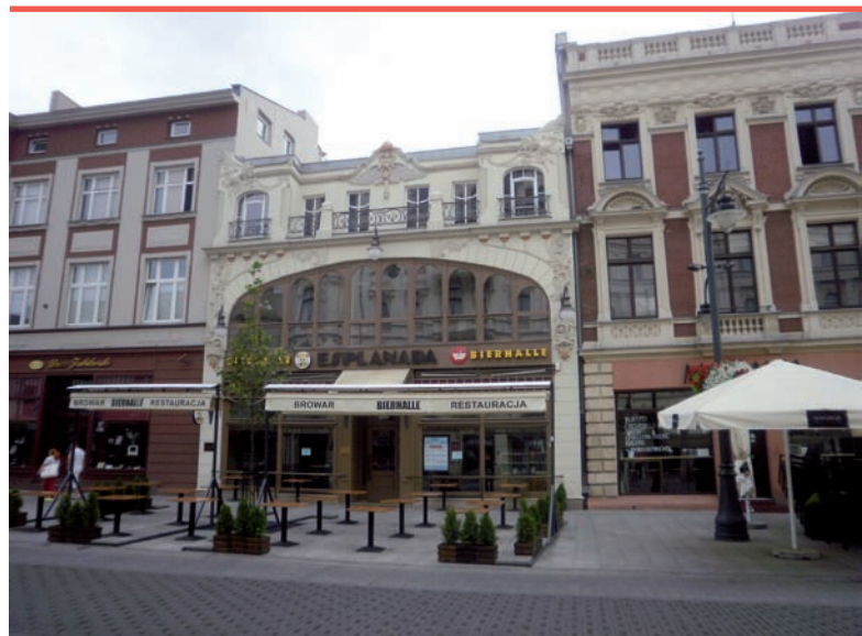
5. „Esplanada” ul. Piotrkowska 100a, architekt miejski August Furuhejm, 1909r. (fot. autorka, 2016 r.)