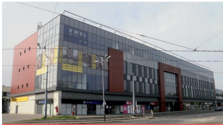
6. „Uniwersal – Centrum Handlowe Unicity” Plac Niepodległości 4, architektki Jerzy Wilk i Antoni Beill, 1967 r.

Po II wojnie światowej w centrum Łodzi powstać zaczęły nowe domy handlowe. Ich koleje losu i nazwy związane były bardzo mocno ze zmianami politycznymi, które miały miejsce wówczas w Polsce. Najpierw więc, po 1945 roku z tym, że nowa, komunistyczna władza polityczna przystąpiła do przekształcenia gospodarki państwa w całkowicie scentralizowaną. Działania te rozpoczęto od przejmowania majątków, fabryk, a później zajęto się handlem. 2 czerwca 1947 roku uchwalono trzy ustawy stanowiące podstawę prawną do „walki z kapitalizmem” w handlu: (1) ustawy w sprawie zwalczania drożyzny i nadmiernych zysków w obrocie handlowym; (2) ustawy o obywatelskich komisjach podatkowych i lustratorach społecznych oraz (3) ustawy o zezwoleniach na prowadzenie przedsiębiorstw handlowych i budowlanych. Powołano Biuro Cen ustalające marże i ceny maksymalne na produkty przemysłowe, a także Komisję Specjalną do Walki z Nadużyciami i Szkodnictwem Gospodarczym. Ostatecznie handel detaliczny miały prowadzić Powszechne Domy Towarowe (PDT). 13 sierpnia 1947 roku otwarto w Warszawie pierwszy Powszechny Dom Towarowy, zlokalizowany na Żoliborzu. 29 listopada 1947 roku ukazało się Zarządzenie Ministra Przemysłu i Handlu o utworzeniu przedsiębiorstwa „Powszechne Domy Towarowe – przedsiębiorstwo państwowe wyodrębnione”