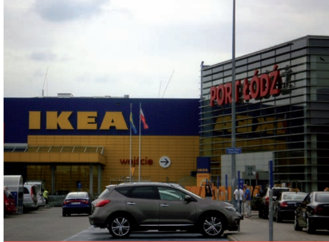
3. „Port Łódź”, ul. Pabianicka 245/ ul. Chocianowicka, Studio Quadra z siedzibą w Warszawie, 2010 r.