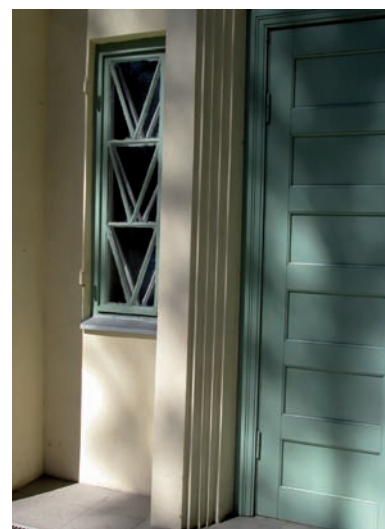
22. Ogre, detal z nurtu architektury „zig-zag” elewacji frontowej willi przy ul. Kalna prospekts 3, Ogre, proj. Teodors Hermanovskis, 1927

Ekspresjonizm architektury niemieckiej w latach dwudziestych wygasł z wolna. Tymczasem pragnienie dynamizmu w architekturze zaproponował amerykański Streamline i funkcjonalny dynamizm Ericha Mendelsohna. Moda na formy opływowe, powszechnie realizowana w Europie, dotarła i na Łotwę, jednak w architekturze willowej nie uzyskała większej popularności. Większość przykładów powstała w Rydze, część projektów jednak i tak nie została zrealizowana. W architekturze willowej forma opływowa znajduje najczęściej wyraz w planie - w ryzalitach, które są klatkami schodowymi.