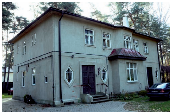
5. Ryga. Willa przy ul. Siguldas prospekts 34, proj. Augusts Raisters, 1927