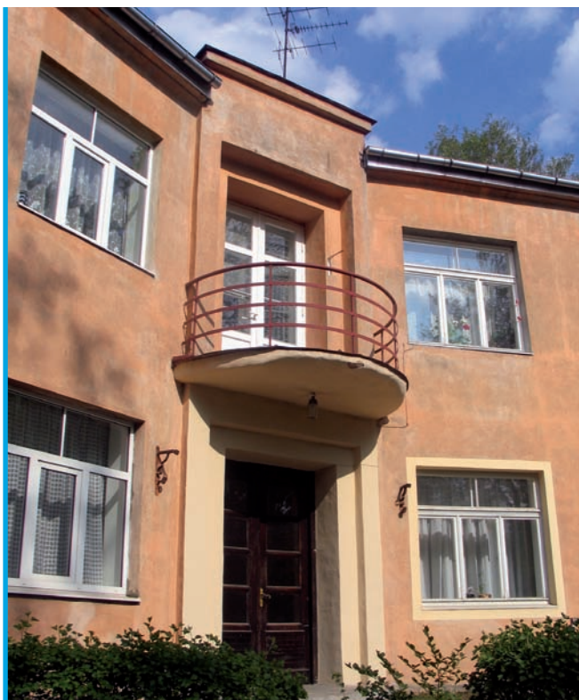
8. Część wejściowa willi przy ul. Stokholmas iela 28

jektu architekta Johna Trencharda w hrabstwie Dorset w Anglii.