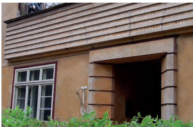
4. Portal i detale willi przy ul. Viļa Olava iela 4

gdzie trójosiowość fasady podkreślona została płaszczyzną zwieńczoną szczytem, jako odniesienie zarówno do klasycznych form jak i do tradycyjnego budownictwa. Pozostałe elewacje ozdobione zostały układem poziomym, akcentującym pasmowe - leżące okna, tworząc wyrazistą, ekspresjonistyczną z założeniami grę światłocieni. Rozwiązania te są silnie osadzone w estetyce Art Déco i kojarzą się z realizacjami Szkoły Hamburskiej 4 i ekspresjonizmu ceglanego, a także dziełami Bruno Tauta. Przewodząc znaczenie niemieckiego ekspresjonizmu w genezie Art Déco podkreślał na przykład Kenneth Frampton 5 .