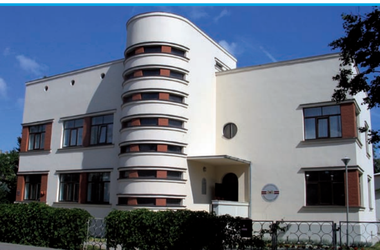
23. Ryga, willa przy ul. Poruka iela 10, proj. K. Jansons, 1936