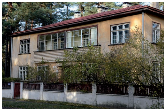
3. Ryga, willa przy ul. Viļa Olava iela 4, proj. Aleksandrs Birzenieks, 1932

środoowisku – blisko wody i w przepięknym sosnowym lesie. Ciche przedmieście tego miasta-ogrodu w Rydze do dziś pełne jest uroku i dodatkowo jest zabytkiem dziedzictwa narodowego.