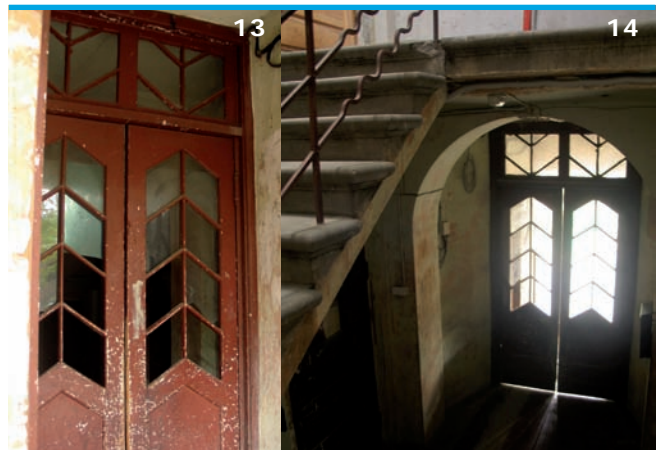
13-14. Detale willi przy ul. Gatartas iela 6 przed remontem.