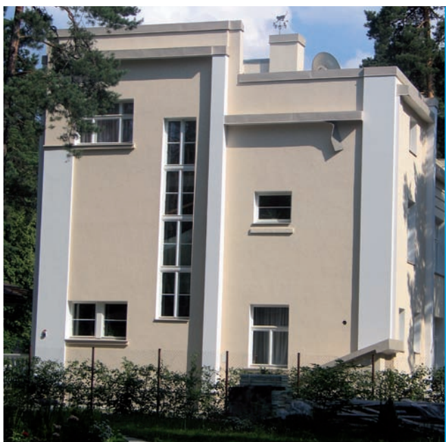
18. Ryga, willa przy ul. Bergenes iela 8, proj. Teodors Hermanovskis, 1928

co odsunięta od ulicy, ma bryłę zwróconą w stronę rzeczki Mārupīte i nawiązuje do nurtu Tropical Deco w Miami na Florydzie. Wyrazisty przykład, który demonstruje temperament i twórczą naturę Hermanovskiego z kręgu Stylu 1925 znajduje się nie w Rydze, lecz w jej pobliżu – w uzdrowisku Ogre. Jest to willa przy Kalna prospekts 3 z dynamiczną bryłą i frontową elewacją w kontrastowych kolorach. Willa została zaplanowana z oknami w czterech różnych konfiguracjach, o zróżnicowanych podziałach szprosami (od 6 do 12 części szyb), przekrytymi prosto lub trapezowo. To tutaj