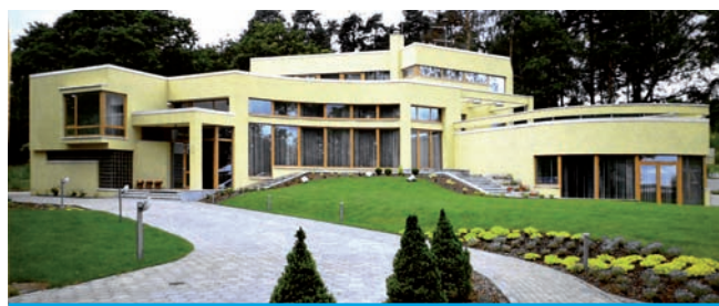
28. Ryga, willa przy ul. Ezermalas iela, proj. Modris Ģelzis, 2002-03.

Architektoniczne dziedzictwo Mežaparku zachęca współczesnych architektów w projektowanych willach do harmonijnej syntezy nurtu klasycznego, Modern Movement i Art Déco przy zastosowaniu nowoczesnych technologii. Taka realizacja pojawia się przy Ezermalas iela (2002-2003). Możliwości techniczne wieku XXI pozwoliły architektowi Modrisowi Ģelzisowi zrealizować o wiele śmielszy i większy projekt w porównaniu z dwudziestowieciem międzywojennym. Jakby spełniając marzenie architektów międzywojnia, Ģelzis ekspresywnie rozmieścił części budynku, główną bryłę na rzucie łuku, dodał linię opływową, więcej szkła i światła wewnątrz,