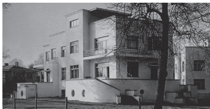
25. Ryga, willa przy ul. O. Vācieša iela 13, proj. Teodors Hermanovskis, 1931-36. Fot. Roberts Johansons, lata trzydzieste XX w., źródło: Māksla, 1990, nr 4, s. 63 (Muzeum Historii i Nawigacji w Rydze, Nr neg.120112)