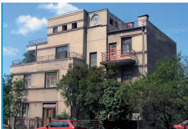
26. Ryga, willa przy ul. Laimdotas ielā 30, proj. E. Bēthers, 1937 (fot. R. Čaupale 2006)