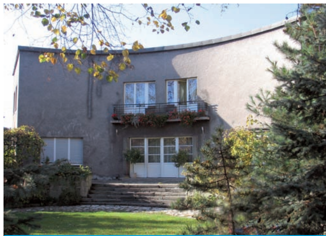
9. Katowice, willa przy ul. Mazowieckiej 1, 1937, proj. Lucjan Sikorski