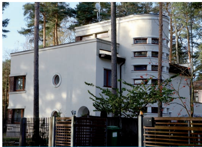
24. Ryga, willa przy ul. Zemgaļu iela 1, proj. N. Makedonskis, 1936

W roku 1936 powstały dwie wille, których forma nawiązuje do swoistej ikony stylu, domu towarowego Schocken w Stuttgarcie (1926–1928), projektu Ericha Mendelsohna. Obydwa domy, z których jeden znajduje się w Mežaparku przy Poruka iela 10, (1936, proj. K. Jansons), drugi poza miastem-ogrodem przy Zemgaļu ielā 1 (1936, proj. N. Makedonskis) są przykładem „miękkiego”, umiarkowanego funkcjonalizmu. Główną dominantą kompozycji są ryzality z wyrazistą, ekspresyjną grą form i poziomymi otworami okiennymi, akcentując ekspresyjność ryzalitu w estetyce Art Déco 12 . Podobna realizacja, tylko o bardziej umiarkowanych formach powstała przy Stendera iela 3 (1932, proj. Pauls Kalniņš) i Olava iela 12 (1933, proj. Augusts Bormanis), gdzie zmieniona została zasada funkcji półokrągłej przestrzeni. Willa Bormanisa to przykład funkcjonalizmu o charakterystycznej dla tych lat ściśle symetrycznej fasadzie z aneksem w kształcie przeszklonego pasmo-półwalca dostawionego od frontu.