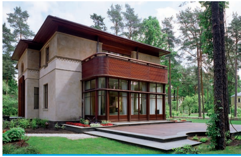
11. Widok z boku willi przy ul. Siguldas prospekts 32

Reinisa Liepiņa i Ainarsa Plankājsa (biuro „Sudraba Arhitektūra”) widoczne w projekcie willi przy Siguldas Prospekts 32 (2004-2008). W sąsiedztwie międzywojennej architektury młodzi architekci stworzyli syntezę klasycznej i współczesnej architektury, nasycając ją estetyką Art Déco. W tworzeniu formy willi i dekoracyjności zaprezentowali podejście porównywalne do tego z okresu międzywojennego. Klasyczna trójosiowość brył, symetryczne fasady, proporcje i wertykalność okien, oraz mocne ryzality nawiązują do inspiracji sztuką klasycyzmu w nowoczesnym domu w Mežaparku. Natomiast rytm, detale i materiały, jak i jego obróbka odpowiadają założeniom, które kojarzą się z nurtem Art Déco. Budynek oddziałuje zwłaszcza frontową elewacją – zróżnicowaną kolorystycznie, osiągniętą rozmytym węglem drzewnym z kory brzozy i ozdobną linią szachownicy na drugim piętrze. Willa Liepiņa jest przesycona dotykami epoki Stylu 1925, który nadal przemawia zarówno nowoczesnością jak i duchem stylu Art Déco. Wykwintna gra proporcji głównego monumentalnego portalu z wykończeniem w kolorze rdzawym, delikatnie rzeźbiony w drewnie salon w formie a la Buffet , klamki drzwi z onyksu – to estetyczna gra formy i materiału, co jest bliskie właśnie Art Déco – stylowi łączącemu luksus z zewnętrzną racjonalną strukturą.