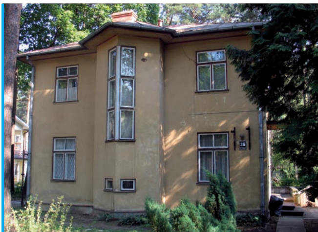
6. Willa przy ul. Meža prospekts 36, proj. Pēteris Bērzkalns, 1931 (fot. R. Čaupale 2006)