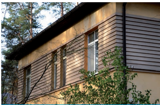
2. Dekoracje elewacji willi przy ul. Poruka iela 9, proj. Osvalds Tilmanis, 1930