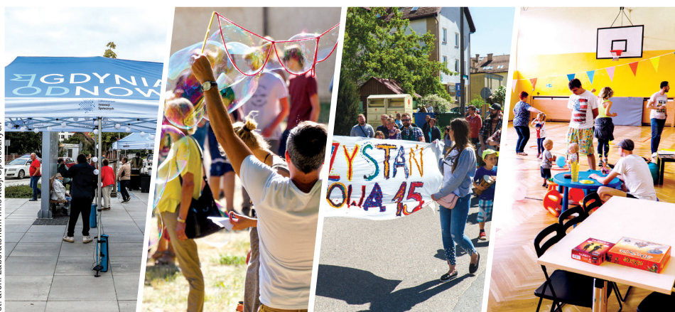
Wydarzenia w Przystaniach (od lewej): Opata Hackiego 33, Śmidowicza 49, Lipowa 15, Chyłońska 237

K oalicja miejskich instytucji i organizacji, z ofertą sztytą na miarę potrzeb każdej dzielnicy. Zajęcia hobbystyczne i sportowe, wsparcie specjalistów, aktywności dla seniorów, prowadzenie integracji międzykulturowej, w tym nauka języka polskiego dla mieszkańców i mieszkank Gdyni spoza Polski, wypożyczalnia książek czy planszówek, ogród społeczny, rowery cargo – jednym słowem Przystań! Tu można rozwijać pasję, skorzystać z konkretnych usług i oferty miejskich instytucji. Blisko domu, dla każdego i całkowicie bezpłatnie.