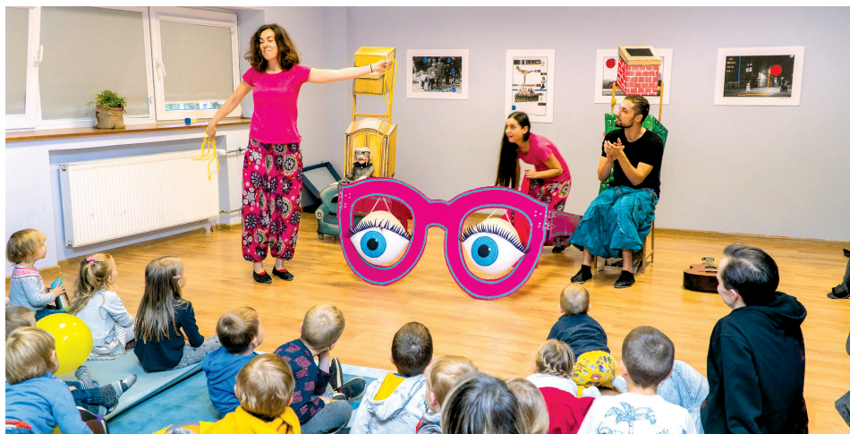
Drugie urodziny Przystani Lipowa 15. W październiku będziemy świętować po raz trzeci.

P rzystań Lipowa 15, pierwsze z centrów sąsiedzkich, otwarte jeszcze w 2018 roku, wpisało się już na dobre w korytarz nie tylko Wielkiego Kacka i osiedla Fikakowo, a także innych dzielnic południowych. Wystarczy rzut okiem na harmonogram, by zobaczyć, że znajdzie się tu coś dla każdego. Prężnie działająca grupa dla mam z dziećmi „Mamy Przystań” rozwija się wraz ze swoimi podopiecznymi i to na tyle, że obecnie działa dwie jej sekcje – dla maluszków młodszych i tych trochę starszych.