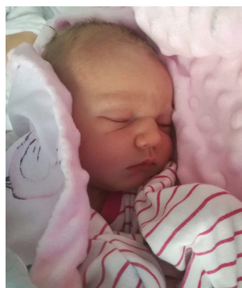
Gaja , 25.08, 54 cm, 3440 g