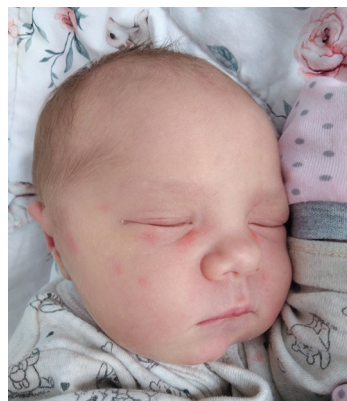
Ariana , 30.08, 54 cm, 3240 g