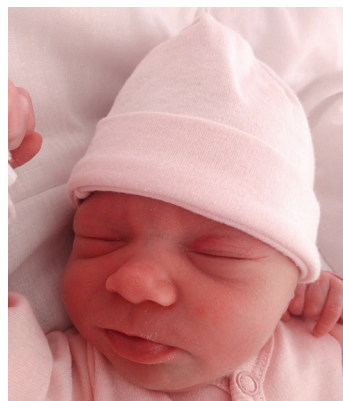
Barbara , 2.09, 53 cm, 2850 g