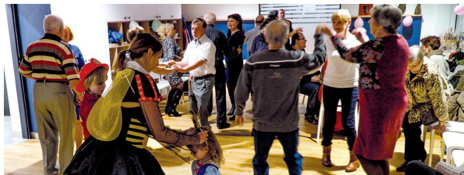
Bał karnawałowy w Przystani Opata Hackiego 33

Mieszkańcy Chyloni, Leszczynek i Grabówka bardzo szybko przyzwyczaili się do obecności w swojej okolicy Przystani Opata Hackiego 33. Otwarte w 2019 roku miejsce staje się coraz bardziej popularne.