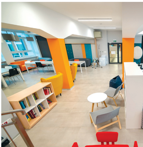
Sala sąsiedzka w Przystani Śmidowicza 49

Przystań tworzą: Laboratorium Innowacji Społecznych, Dzielnicowy Ośrodek Pomocy