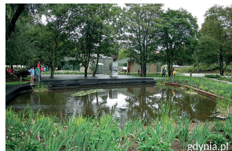
Ukryty w cieniu drzew biologiczny staw w Parku Centralnym zaprasza ptaki, owady i płazy