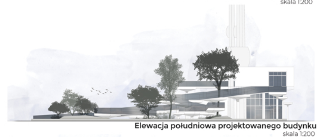
Elewacja południowa projektowanego budynku skala 1:200