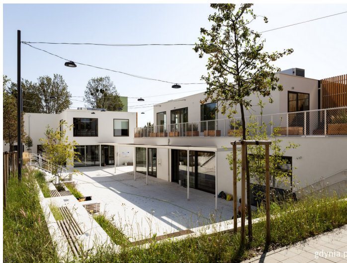
Przystań Widna 2A od strony patio

W wtorek, 26 września o godz. 12.00 odbędzie się oficjalne otwarcie Przystani Widna 2A na Witominie. Zapraszamy wszystkich mieszkańców do wzięcia udziału w przygotowanych na tę okazję atrakcjach, które potrwać do godz. 19.00. Przystań Widna 2A jest ósmą w sieci Domów Sąsiedzkich w Gdyni. Szczegóły na 10 str. „Ratusza”.