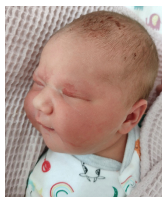
Emilia , 58 cm, 4040 g, 26.07.23