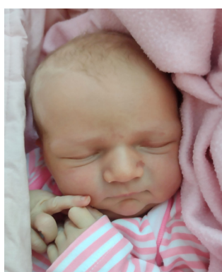
Maja , 53 cm, 3630 g, 26.08.23