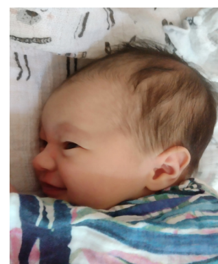
Helenka , 55 cm, 2990 g, 27.08.23