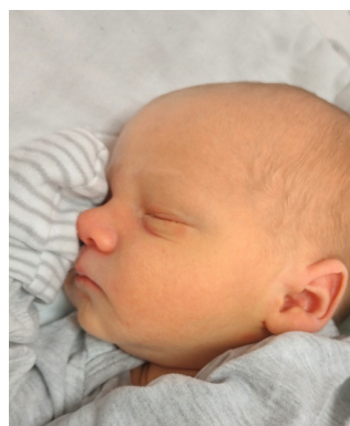
Leon , 54 cm, 3430 g, 24.07.23