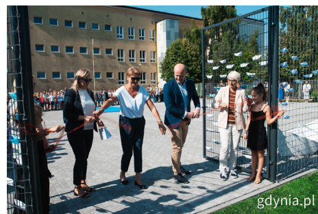
Przedstawiciele szkoły, rada rodziców podczas otwarcia wraz z Joanną Zielińską , przewodniczącą Rady Miasta Gdyni i Bartoszem Bartoszewiczem , wiceprezydentem Gdyni ds. jakości życia

Inwestycja była realizowana w ramach projektu pn. „Rozwój systemu gospodarowania wodami opadowymi na terenie Gdyni – część II”. Gmina Miasta Gdyni realizowała projekt pn. „Rozwój systemu gospodarowania wodami opadowymi na terenie Gdyni – część II, dofinansowany ze środków Funduszu Spójności w ramach Programu Operacyjnego Infrastruktura i Środowisko 2014-2020, Działanie 2.1 „Adaptacja do zmian klimatu wraz z zabezpieczeniem i zwiększeniem odporności na klęski żywiołowe, w szczególności katastrofy naturalne oraz monitoring środowiska”, Typ projektu 2.1.5 „Systemy gospodarowania wodami opadowymi na terenach miejskich”.