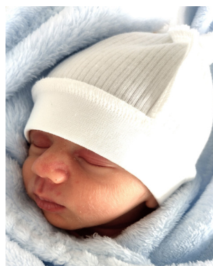
Myron , 48 cm, 2140 g, 26.08.23