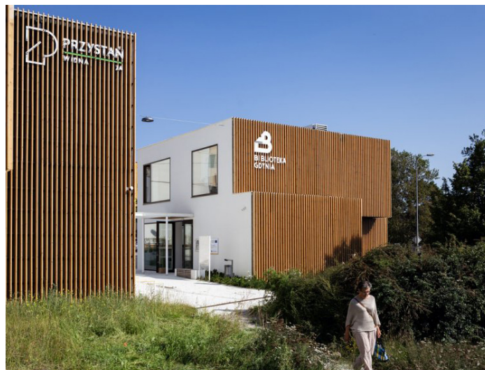
Przystań Widna 2A