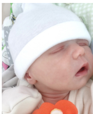
Iga , 52 cm, 2840 g, 21.07.23