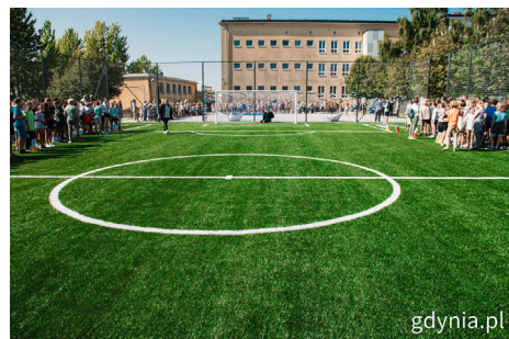
Nowe boisko przy ZSO nr 6