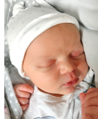
Leonard , 55 cm, 3980 g, 22.07.23