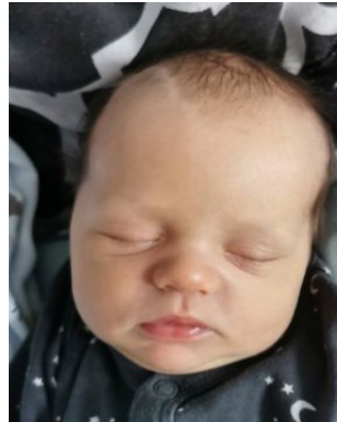
Leon , 57 cm, 3650 g, 27.08.23