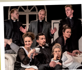
O co biega?

26.07.19, piątek, godz. 18 i 21:30 28.07.19, niedziela, godz. 16 i 19:30