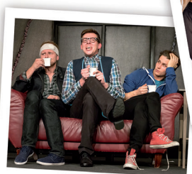
Mayday. Run For Your Wife

18.07.19, czwartek, godz. 19 19.07.19, piątek, godz. 19 20.07.19, sobota, godz. 19 21.07.19, niedziela, godz. 17