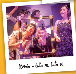
Rewia - lata 20. lata 30.

8.08.19, czwartek, godz. 19 9.08.19, piątek, godz. 19 10.08.19, sobota, godz. 19 11.08.19, niedziela, godz. 17