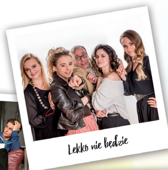
Lekko nie będzie