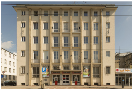
Budynek BGK ul.10 Lutego 8/Zygmunta Augusta 13, prace konserwatorskie przy elewacjach prowadzono w latach 2013-2019.