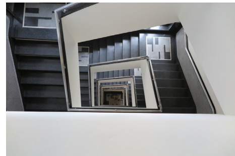
Klatka schodowa kamienicy przy ul. Abrahama 28 po pracach konserwatorskich w 2019 r.