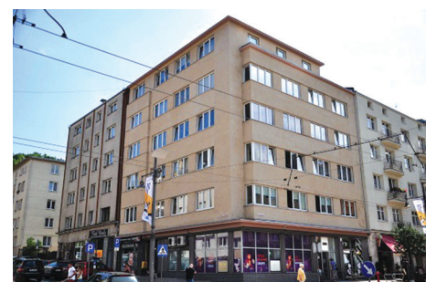
Budynek przy ul. Świętojańskiej 57. Prace konserwatorskie elewacji frontowych przeprowadzono w 2017 r.

Szczegółowe informacje dotyczące warunków ubiegania się o dotacje oraz obowiązkowy formularz wniosku dostępne są na stronie internetowej: www.gdynia.pl/zabytki/dotacje w zakładce „Dotacje z budżetu gminy na prace przy zabytkach”. Informacji na temat dotacji udziela także Biuro Miejskiego Konserwatora Zabytków tel. 58 66 88 342, 58 66 88 343, mail: zabytki@gdynia.pl .