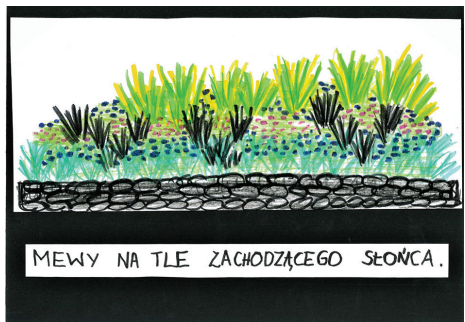
Pawłowi Portee z kl. VII C Szkoły Podstawowej nr 16 za pracę pt. „Mewy na tle zachodzącego słońca”;