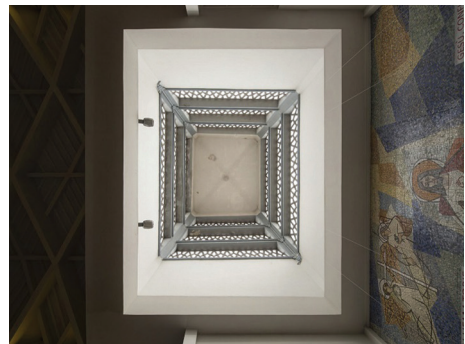
Latarnia kościoła pw. Najświętszego Serca Pana Jezusa, poddana pracom konserwatorskim w 2016 r.