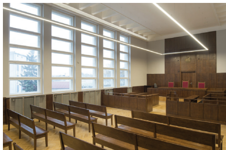
Sala rozpraw w Sądzie Rejonowym po pracach konserwatorskich w 2016 r.

W przypadku występowania na elewacjach budynku z Grupy 2 lub 3 historycznych, szlachetnych wypraw tynkarskich (czyli mających indywidualny kolor, strukturę i fakturę), okładzin kamiennych, ceglanych lub ceramicznych, albo metalowych lub drewnianych detali architektonicznych, powstałych przed II wojną światową i zachowanych w oryginalnym stanie, które mają być poddane konserwacji, można ubiegać się o dofinansowanie tych prac w wysokości 75%.