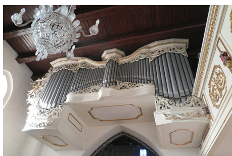
Organy w kościele pw. św. Michała Archanioła na Oksywiu po pracach konserwatorskich przeprowadzonych w 2019 r.