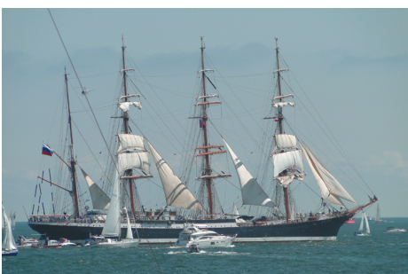
Fot. Sylwia Szumielewicz-Tobiasz