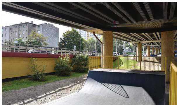
Nowy skatepark, projekt Budżetu Obywatelskiego, znajduje się bezpośrednio pod Estakadą Kwiatkowskiego