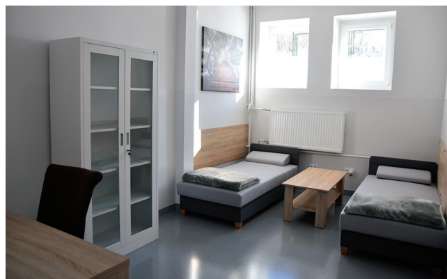
Ratownicy z Miejskiej Stacji Pogotowia Ratunkowego przy ul. Białowieskiej 1 mają do dyspozycji nowe pomieszczenia socjalne, w których skład wchodzi: dwa pokoje socjalne, pomieszczenia gospodarcze, sanitarne, miejsce do mycia sprzętu medycznego, wspólna sala, magazyn na sprzęt ratownictwa medycznego, szatnia, kuchnia z jadalnią, składnica dokumentacji medycznej.