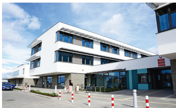
Zespół Szkół Ogólnokształcących nr 8 na Chwarznie-Wiczlinie

Falochron dla edukacji to Akademia Dzielnicowa, Szkoła Mistrzów oraz Rozwój Gdyńskiego Systemu Złobkowego - 6 mln zł.