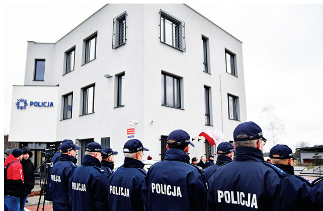
Policjanci mają do dyspozycji ponad 1 tys. m kw. powierzchni użytkowej. Nowy komisariat na Chwarzynie-Wiclinie składa się z: budynku biurowego, budynku dla przewodników psów, garaży i powierzchni gospodarczej. Budowa kosztowała ponad 10 mln zł. 1,2 mln zł oraz działkę pod inwestycję przekazała w transzach Gdynia.

Każdego dnia Gdynia zmienia się dla Was. Bezpieczna Gdynia to sprawnie funkcjonujące służby mundurowe, ochrona zdrowia czy liczący 138 kamer miejski system monitoringu. To również dbałość o infrastrukturę dla pieszych, dzieci zmierzających do szkół czy osób z niepełnosprawnościami – wyniesione przejścia dla pieszych, progi zwalniające i strefy ograniczenia prędkości samochodów do 30 km/h, a także 6000 nowych, energooszczędnych latarni. To wreszcie działania traktujące bezpieczeństwo w szerszym kontekście – przyjęcie Miejskiego Planu Adaptacji do zmian klimatu do roku 2030 czy wartość ponad 14 milionów złotych (dane z 2020 roku) wsparcie dla mieszkańców podczas pandemii w ramach Gdyńskiego Falochronu.