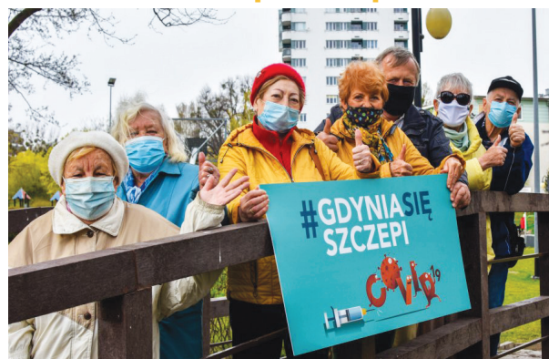
#Gdyniasięszczepi - do przyjęcia szczepionki zachęcają gdyńscy seniorzy, zrzeszeni w Centrum Aktywności Seniora