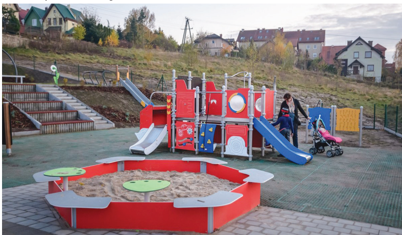
Nowy plac zabaw na Wielkim Kacku, który powstał dzięki inicjatywie Rady Dzielnic

Prężnie w Gdyni działają organizacje pożytku publicznego, które w pandemii wymagały szczególnego wsparcia. Pomoc związana była z realizacją i rozliczeniem już zawartych umów, zwolnieniem z czynszu w lokalach komunalnych, dodatkowymi środkami na realizację zadań, pożyczkami oraz udzieleniem wsparcia doradczego i eksperckiego. Aneksowano 252 umowy. Kwota to ponad 225 tys. zł. Gdyński sektor pozarządowy to ponad 800 organizacji i grup nieformalnych, ponad 800 zrealizowanych projektów, 118 mln zł kwota udzielonych dotacji, 755 organizacji realizujących i 800 tys. beneficjentów.