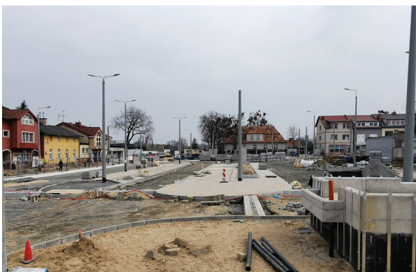
Prace na Węźle Chylonia (marzec 2021 r.)

„Rozwój zrównoważonego transportu publicznego w Gdyni poprzez inwestycje infrastrukturalne, m.in. utworzenie węzła integracyjnego Gdynia Chylonia” - projekt współfinansowany z Funduszu Spójności w ramach Programu Operacyjnego Infrastruktura i Środowisko na lata 2014-2020.