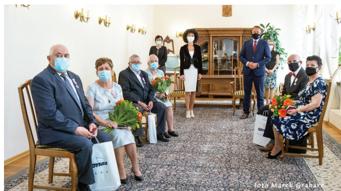
9 czerwca, godz. 14.30