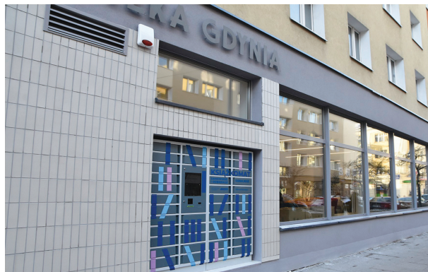
W ścianie budynku Biblioteki Śródmieście znajduje się księżkomat