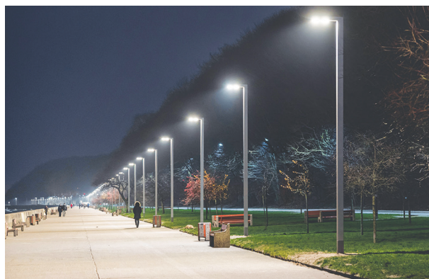
Nowe lampy na bulwarze Nadmorskim