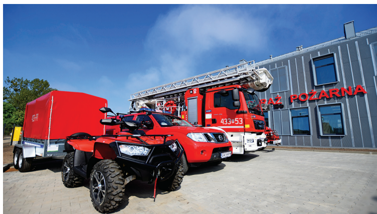
Budynek strażaków w gdyńskiej Jednostki Ratowniczo-Gaśniczej nr 3 przy ul. Marynarskiej 14A. i nowy sprzęt, który pomaga im przy interwencjach, w tym m.in. quad z lawetą, średni samochód ratowniczo-gaśniczy, podnośnik 23-metrowy czy samochód operacyjny.