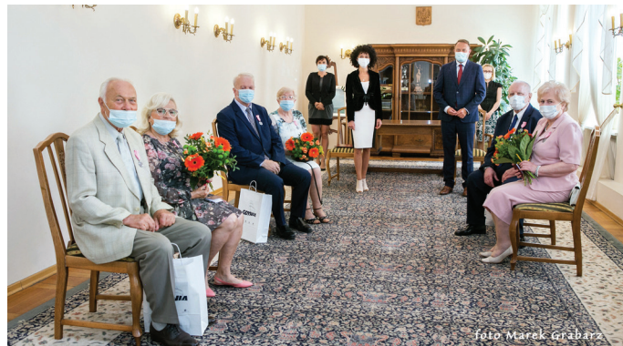
9 czerwca, godz. 13.30

Uroczystości odbyły się 9 czerwca w Urzędzie Stanu Cywilnego z zachowaniem zasad reżimu sanitarnego. Gratulacje!