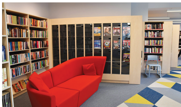
W filii Śródmieście dostępnych jest ponad 16 tysięcy woluminów, czyli wszelkiego rodzaju zbiorów

Nie przestajemy pomagać – hasło Kultura łączy siły jest wciąż aktualne!