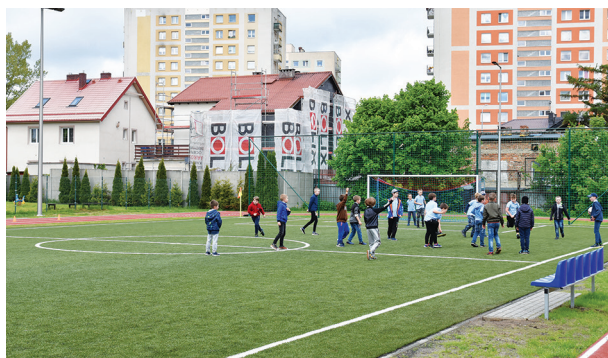
Wielofunkcyjne boisko do piłki nożnej z bieżnią i skocznią przy Szkole Podstawowej nr 40 zrealizowane w ramach projektu Budżetu Obywatelskiego