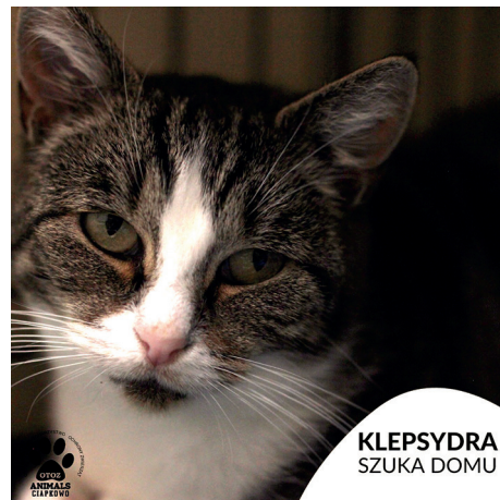
KLEPSYDRA SZUKA DOMU

Kontynuujemy rubrykę, dzięki której, mamy nadzieję, kolejne porzucone psy i koty ze schroniska w „Ciapkowie” znajdą ciepły dom. Miejskie schronisko „Ciapkowo” prowadzone jest przez Ogólnopolskie Towarzystwo Ochrony Zwierząt Animals.