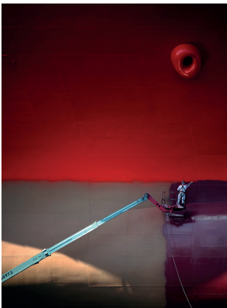
I nagroda w konkursie Legenda Morska w Obiektywie 2023.

Nagroda specjalna jury trafiła do Dariusza Wojtały za kadr wyróżniony w kat. „Wakacje morskie nad Bałtykiem” – ponadczasowy portret spalonego na raka turysty w hotelu