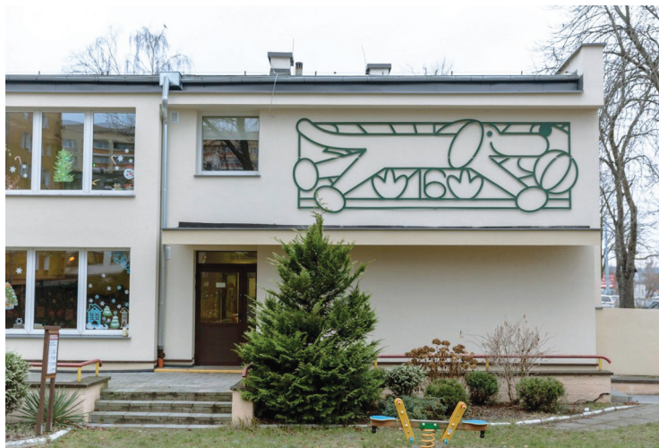
Przedszkolaków ze Śródmieścia wita charakterystyczny pies na elewacji budynku

W 2017 roku pasjonaci dobrego designu w miejskiej przestrzeni zajęli się „ozdobieniem” gdyńskiego żłobka „Niezapominajka”. Jedną ze ścian budynku mieszczącego się przy ulicy Wójta Radtkego w Śródmieściu zapleniła wówczas ilustracja metaloplastyczna wykonana według projektu Patryka Mogilnickiego – z motywem tytułowej niezapominajki.