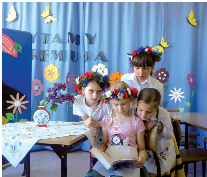
Nauka kaszubskiego w SP 43 jest obowiązkowa dla dzieci z klas I - III

Nauka kaszubskiego w SP 43 jest obowiązkowa dla dzieci z klas 1-3, których rodzice zgłosili taką wolę. Na świadectwach znajduje się ocena z tego przedmiotu. Starsi uczniowie naukę mogą kontynuować w kole kaszubskim: zgłębiają tam literaturę, muzykę, mogą uczestniczyć w wycieczkach krajoznawczych. W szkole są też klasy sportowe i dwujęzyczne. – Moją dewizą jest, aby kierowana przez mnie placówka była bezpiecz-