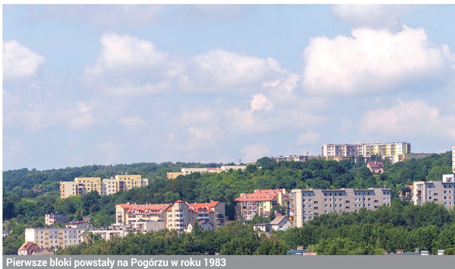
Pierwsze bloki powstały na Pogórzu w roku 1983

Pogórze ma swoją górską serpentynę. Mało kto wie, że ten właśnie szlak wytyczony został już w XIII wieku. Do dziś przejazd ulicą Czernickiego, łączącą Dolne i Górne Pogórze, może dostarczyć emocjonujących wrażeń – zwłaszcza po zmroku. Z tego miejsca roztaczają się też jedne z ciekawszych widoków na całą dolinę, w której położona jest Gdynia. Swoją kartę historii zapisał tu krwią Obrońcy Gdyni we wrześniu 1939 roku. Pogórze bowiem, zali-