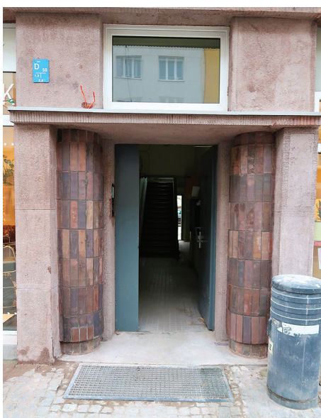
Budynek mieszkalny, ul. Świętojańska 82 – remont elewacji frontowej.