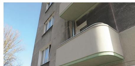
Budynek mieszkalny, ul. Partyzantów 44 – prace konserwatorskie przy tynkach szlachetnych.