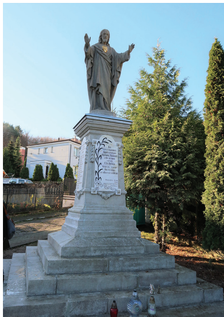
Pomnik Ofiar I Wojny Światowej, ul. Działowska 12 – prace konserwatorskie przy figurze oraz postumencie.