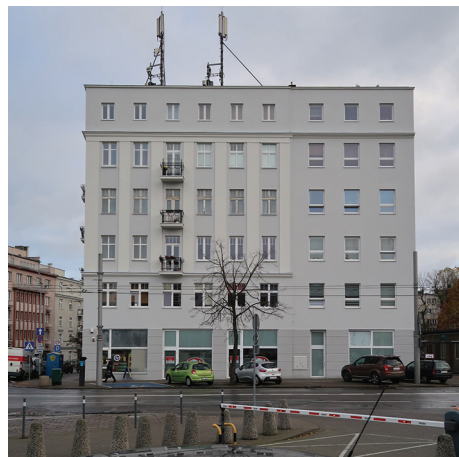
Budynek mieszkalny, ul. Starowiejska 47 – remont elewacji frontowych.