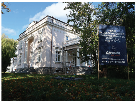
Willa „Sokół”, ul. Sieroszewskiego 7 – zabezpieczenie balustrad i słupów na tarasach oraz orestaurowanie cokolu kamiennego i kolumn.

31 marca Rada Miasta Gdyni po raz kolejny przyznała dotacje na prace przy zabytkach Gdyni do realizacji w 2021 r. Będzie to znowu okazja do poprawy stanu dziedzictwa architektonicznego miasta.