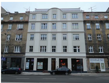
Budynek mieszkalny, ul. Portowa 9 – remont elewacji frontowej i tylnej.