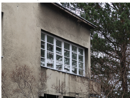
Budynek mieszkalny „Willa Ala”, ul. Sienkiewicza 27 – etap I renowacji stolarki okiennej.