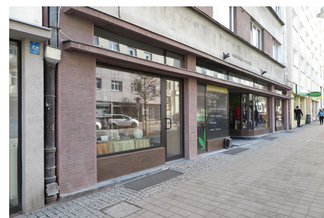
Budynek mieszkalny, ul. Świętojańska 77 – remont elewacji frontowej w parterze oraz lastryka w strefie wejścia.