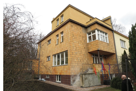
Budynek mieszkalny, ul. Korzeniowskiego 25A – remont elewacji budynku; remont dachu, wykonanie izolacji pionowej, remont balkonu, podestów i schodów zewnętrznych.