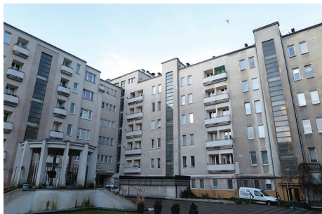
Budynek mieszkalny, ul. 3 Maja 27-31 – remont części elewacji od podwórza.