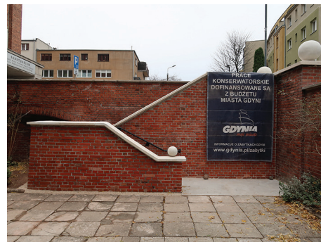
Zespół kościoła parafialnego pw. św. Antoniego Padewskiego i klasztoru franciszkanów, ul. Ujejskiego 40 – remont schodów zewnętrznych, u dołu detal.