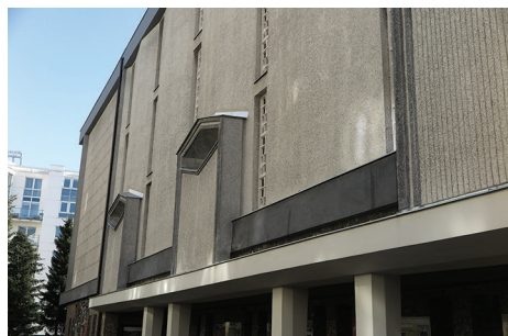
Kościół pw. Najświętszego Serca Pana Jezusa, ul. Armii Krajowej 46 – wymiana zniszczonych opierzeń blacharskich elewacji.