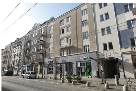
Budynek mieszkalny, ul. Świętojańska 96 – remont elewacji frontowej.