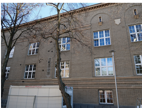
Uniwersytet Morski, ul. Morska 81-87 – remont elewacji budynku A.