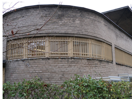
Budynek „Polska YMCA”, ul. Żeromskiego 26 – renowacja okien.