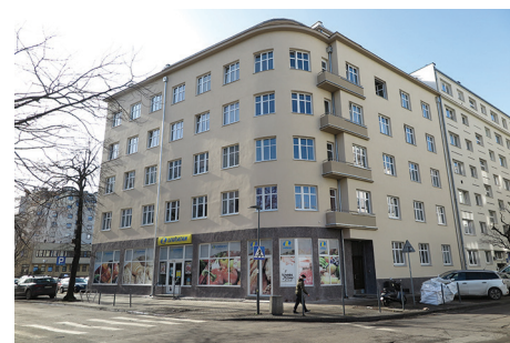
Budynek mieszkalny, ul. św. Wojciecha 7 – remont elewacji frontowych.