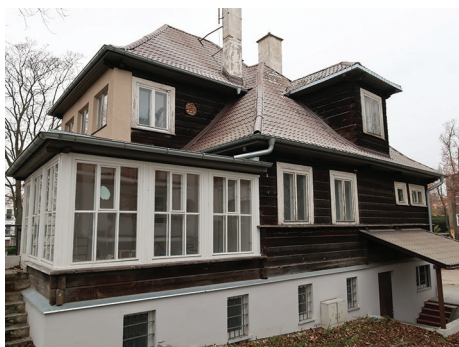
Budynek Automobilkлубu Morskiego, ul. Żołnierzy I Armii Wojska Polskiego 28 – remont elementów dachu.