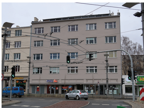
Budynek mieszkalny, ul. 10 Lutego 30 – remont elewacji frontowej.