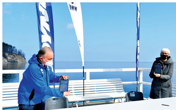
W duchu technologii i ekologii (oszczędzając papier) przedstawiciele miasta podpisy złożyli na tabletach, a petycję wysłali elektronicznie.

Apel do premiera Morawieckiego podpisało już ponad 40 tys. Polek i Polaków.