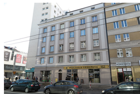
Budynek mieszkalny, ul. 10 Lutego 19 – remont elewacji północnej, południowej i wschodniej.