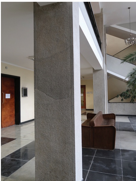
Sąd Rejonowy, plac Konstytucji 5 – renowacja posadzki holu i klatki schodowej oraz filarów.