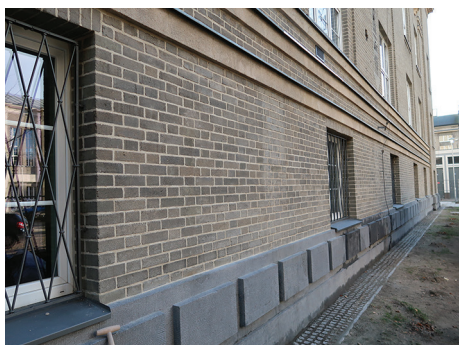
Uniwersytet Morski, ul. Morska 81-87 – detal remontowanej elewacji budynku A.