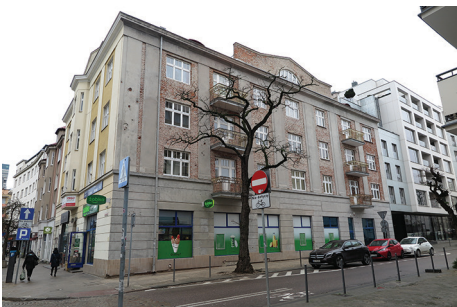
Budynek mieszkalny, ul. Starowiejska 11 – remont elewacji zachodniej.