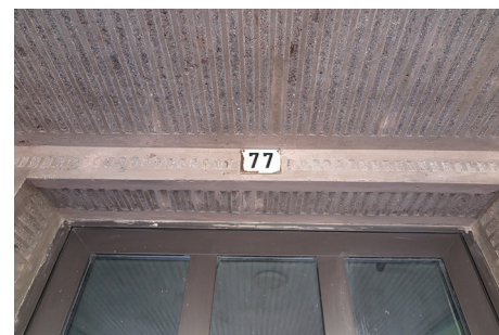
Budynek mieszkalny, ul. Świętojańska 77 – detal remontowanej elewacji frontowej.