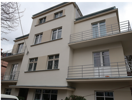
Budynek mieszkalny, ul. Wolności 19 – remont elewacji frontowej, balkonów wraz z balustradami, remont wraz z odtworzeniem fragmentów zadaszania nad parterem oraz konserwacja drewnianych okien na klatce schodowej.