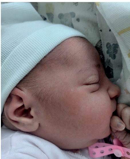
Dalia , 56 cm, 4120 g, 18.01