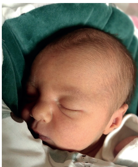
Maja , 53 cm, 3260 g, 14.01