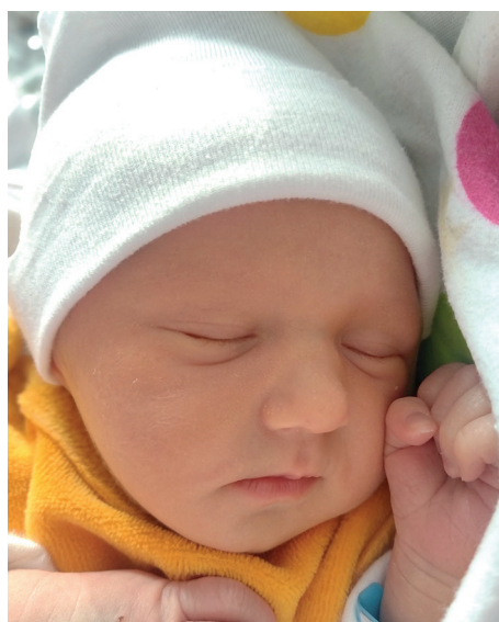
Kuba , 51 cm, 2930 g, 10.01