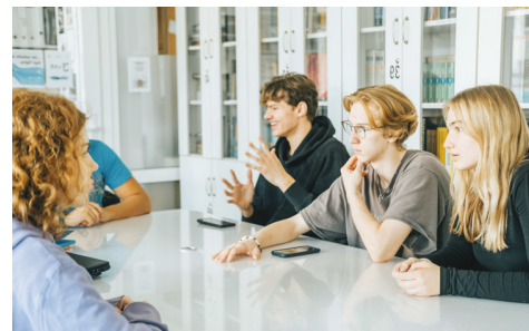
Licealiści Trójki

Równocześnie podsumowujemy rok 2023, w którym z oferowanych przez nas zajęć dodatkowych, kursów przygotowawczych, wsparcia psychologicznego, skorzystało w Gdyni 106 511 dzieci, rodziców i nauczycieli!