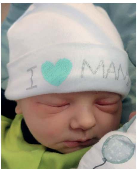
Kacper , 57 cm, 3600 g, 18.01