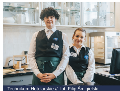
Technikum Hotelarskie