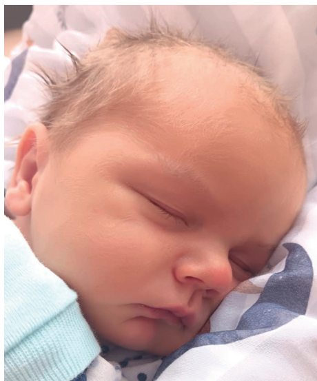
Adam , 57 cm, 3830 g, 12.01

Podmiot Leczniczy Samorządu Województwa Pomorskiego