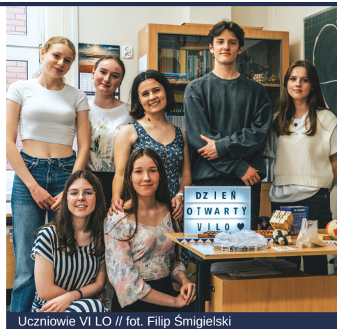
Uczniowie VI LO

A przed nami ambitne plany. Już niebawem ponad 1100 gdyńskich ósmoklasistów kończy edukację w szkołach podstawowych i stanie przed wyborem dalszej drogi kształcenia. Gdynia Edukacyjna od początku im w tym towarzyszy i z całych sił wspiera. Dlatego, po trudnym czasie pandemii, wracamy z Gdyńską Giełdą Szkół . A w wyborze wymarzonej szkoły pomoże również przeznaczony dla uczniów informator online – kompendium wiedzy o każdej szkole ponadpodstawowej „w pigułce” z opisami