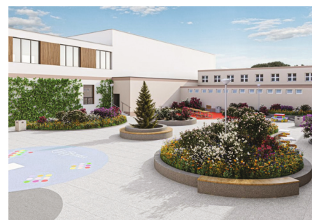
W wiosennej odsłonie