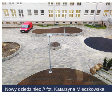
Nowy dziedziniec // fot. Katarzyna Mieczkowska

Tradycją szkoły jest coroczne organizowanie Biegu Orła Białego, Święta Szkoły, pasowania na ucznia, festynu sportowego „I Ty możesz zostać Olimpijczykiem”, szkolnych jasełek, koncertu świątecznego dla mieszkańców dzielnicy czy Dnia Rodziny. Szkoła jest także organizatorem międzyszkolnych konkursów: fotograficznego „Odkrywam Gdynię” oraz ekologiczno-plastycznego „Zielony Zakątek”.