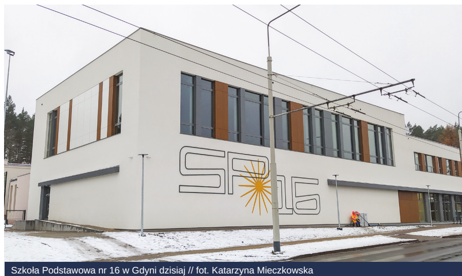
Szkoła Podstawowa nr 16 w Gdyni dzisiaj

Na dziedzińcu będzie można pograć w gry podwórkowe, odpocząć w ogrodzie deszczowym, wieszać karmniki dla ptaków i budować hotele dla pszczoł. Będą tu żywe lekcje przyrody i odpoczynek wśród zieleni.