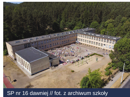
SP nr 16 dawniej // fot. z archiwum szkoły

roku. Dokładnie przemyśleli to, jakie musi mieć cechy, aby łączyć całą społeczność szkoły, a jednocześnie dać możliwość integracji w grupach czy odpoczynku. Swoje pomysły przedstawili na rysunkach, które stały się podstawą do wykonania projektu. Dzieci dokładnie narysowały swoje marzenia, łącznie z zabawkami i miejscami do siedzenia. Wszystkie te pomysły udało się zrealizować, i tak powstało zielone serce tej szkoły.