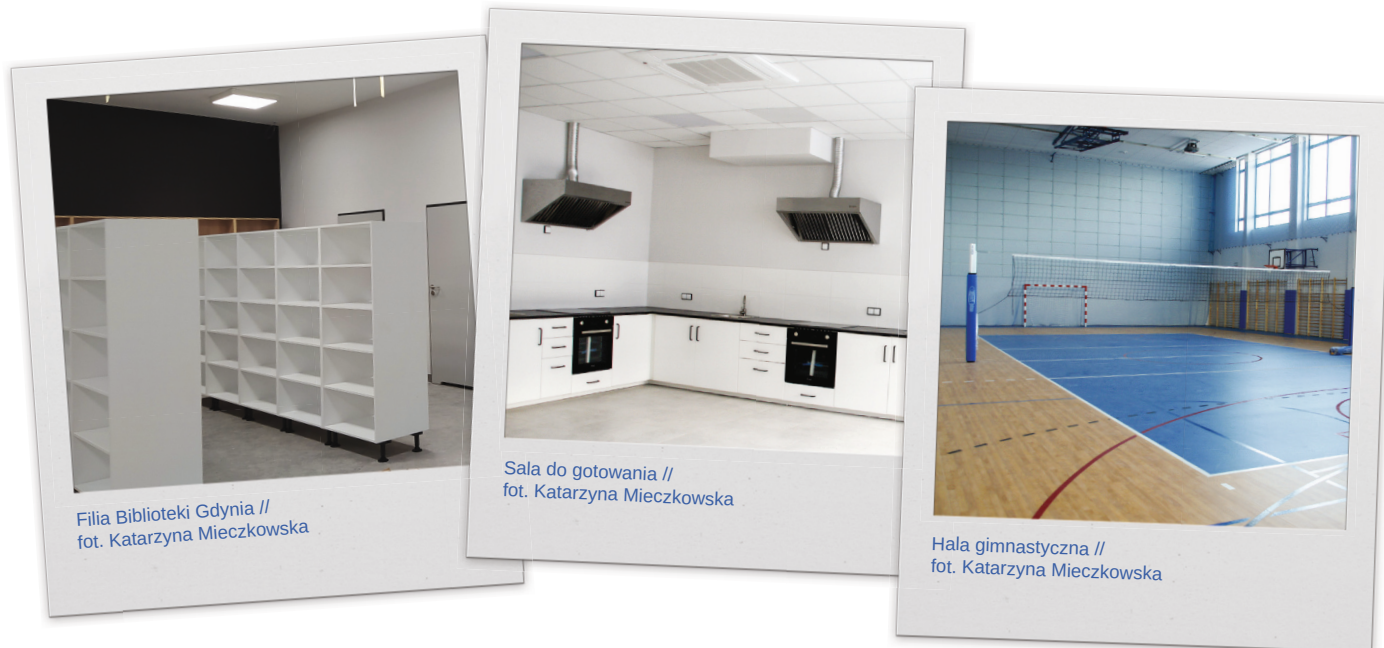
Filia Biblioteki Gdynia