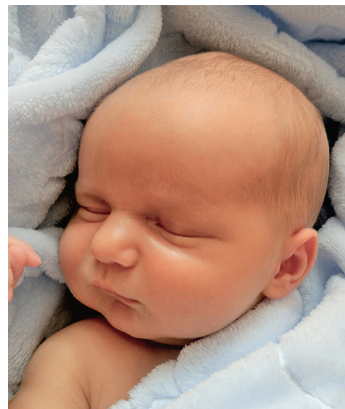
Jan , 17.08, 56 cm, 3690 g