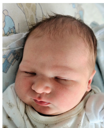
Nazar , 7.08, 56 cm, 3830 g