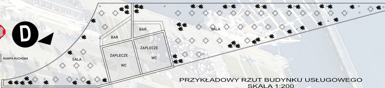
PRZYKŁADOWY RZUT BUDYNKU USŁUGOWEGO SKALA 1:200