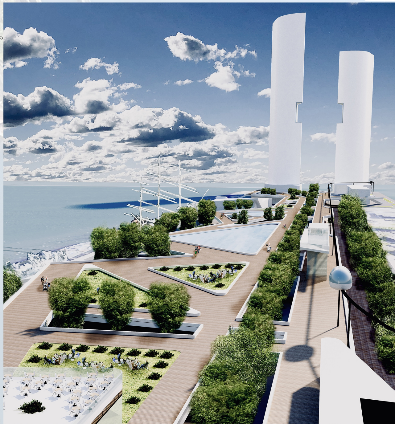
WIDOK NA OTWARTĄ OŚ KOMPOZYCYJNĄ, PARK, TERENY REKREACYJNE, KOLEJKĘ (WAŁORY WIDOKOWE), 'WIEŻE' I 'OKNO NA ŚWIAT' ZAPEWNIĄJĄCE WIDOK NA MORZE