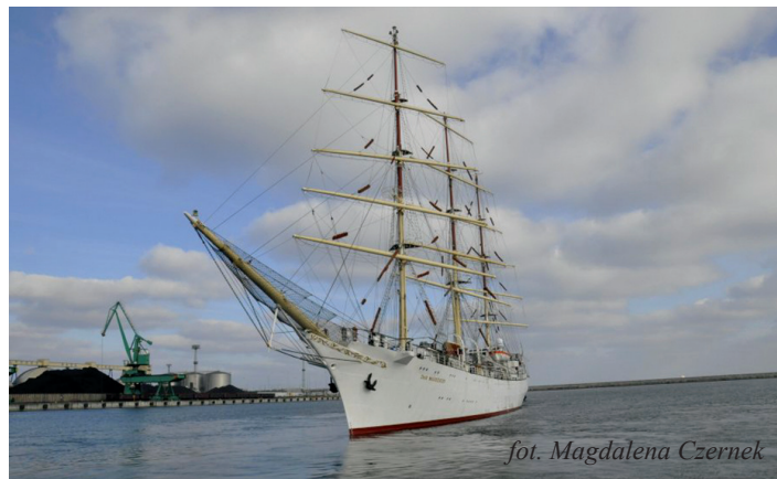
fot. Magdalena Czernek