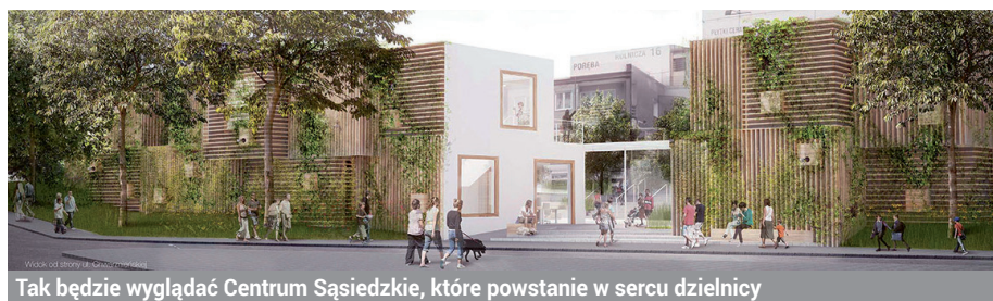
Tak będzie wyglądać Centrum Sąsiedzkie, które powstanie w sercu dzielnicy

GPR Rada Miasta uchwaliła pod koniec marca 2017 roku, a około półtora roku później mieszkańcy Witomina - Radiostacji poznali projekt budowy centrum sąsiedzkiego u zbiegu ulic Rolniczej i Chwarznieńskiej. Do rozstrzygniętego w listopadzie 2017 roku otwartego konkursu koncepcyjnego zgłosiły się 23 pracownie, a zwyciężył projekt przygotowany przez zespół Dynamo Produce, Hago Architekci oraz PB Studio. Obecnie trwają prace związane z przygotowaniem dokumentacji architektoniczno-budowlanych. Całość dokumentacji ma być gotowa do połowy listopada tego roku, prace ziemne będą mogły rozpocząć się wiosną 2019. Centrum są-