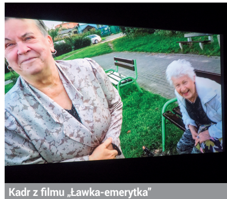
Kadr z filmu „Ławka-emerytka”

Trudno mówić o ogóle. Każdy może powiedzieć, że w różnych częściach dzielnicy jest różnie. Ale sąsiadami z mojego bloku bardzo się bardzo żyłam. Zwłaszcza z jedną precu-