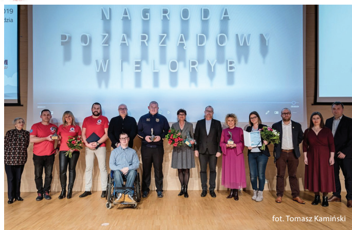
119 dzia fot. Tomasz Kamiński

„Pozarządowego Wieloryba” otrzymała Fundacja Gospodarcza .