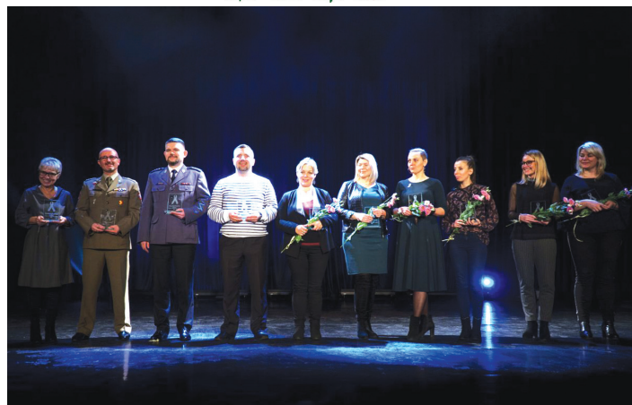
Na zdjęciu Ambasadorzy i Ambasadorki kampanii „Biała Wstążka” 2019

Statuetki Ambasadorów i Ambasaderek kampanii „Biała Wstążka” 2019 otrzymali przedstawiciele i przedstawicielki instytucji pomocowych w dziedzinie przeciwdziałania przemocy w naszym mieście, m.in. z MOPS-u, policji, ratownictwa medycznego, zan-