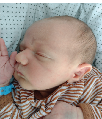
Olaf, 11.09, 53 cm, 3360 g