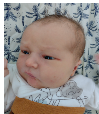
Robert, 15.09, 56 cm, 4030 g