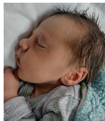
Miłosz, 21.09, 53 cm, 3140 g