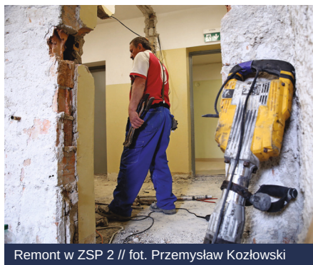
Remont w ZSP 2