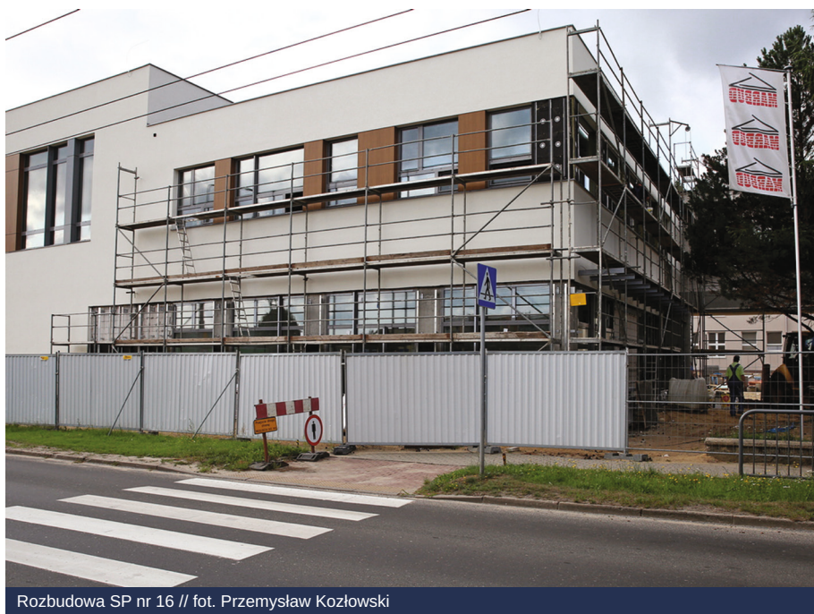
Rozbudowa SP nr 16

W wakacje w gdyńskich przedszkolach i szkołach było głośno i dużo się działo, choć uczniów zastąpiły ekipy budowlane i remontowe. Lato to tradycyjnie idealny moment na remonty placówek edukacyjnych i ich dostosowywanie do najwyższych standardów. Stąd w naszym mieście prace trwały w kilkudziesięciu przedszkolach, szkołach podstawowych i średnich w różnych dzielnicach. To zarówno doraźne remonty, jak i poważniejsze inwestycje w rozbudowę.