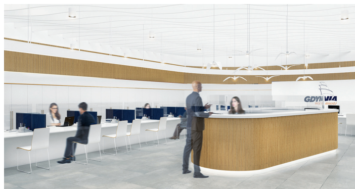
Wizualizacja: Arch. Wnętrz. Mirosława Bułak, Arch. Wnętrz: Anna Brzozowska, Pracownia Wnętrza

– od 31 sierpnia do 30 września w każdy wtorek, środę i czwartek w „Bibliotece z Pasją” przy PPNT (al. Zwycięstwa 96/98) w godz. 12.00-14.00;