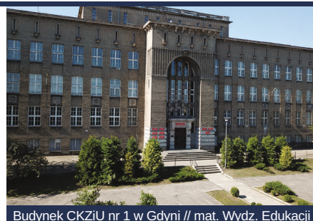
Budynek CKZIU nr 1 w Gdyni

Wszystkie szkoły są gotowe na przyjęcie swoich uczniów. W trosce o ich bezpieczeństwo, jak też nauczycieli oraz pracowników obsługi i administracji w gdyńskich placówkach wdrożone zostały wytyczne opracowane przez Ministerstwo Edukacji i Nauki oraz Głównego Inspektora Sanitarnego. W Gdyni naukę w roku szkolnym 2021/2022 podejmie ok. 26 tys. dziewcząt i chłopców. Do szkół podstawowych (klasy 0-VIII) uczęszczać będzie blisko 17 tys. uczniów i prawie 9 tys. do szkół ponadpodstawowych. Do szkolnych ławek po raz pierwszy w życiu zasiądzie 2009 pierwszoklasistów. Dla przedszkolaków przygotowano 237 oddziałów, w których rok szkolny rozpocznie 5830 dzieci.