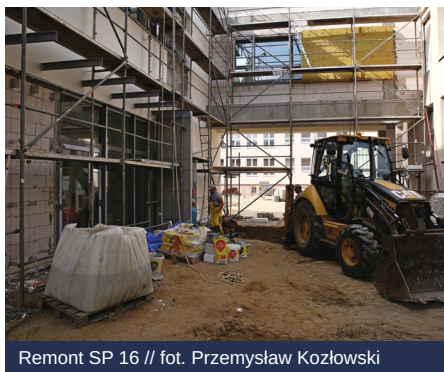
Remont SP 16