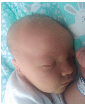
Jan , 26.07., 58 cm, 3900 g