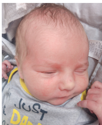
Olaf , 26.07., 50 cm, 2900 g