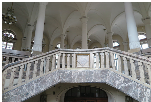
Kamienne balustrady w dawnym Banku Polskim przy ul. 10 Lutego 22