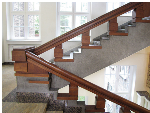
Reprezentacyjne balustrady we wnętrzu budynku Uniwersytetu Morskiego przy ul. Morskiej 81-87