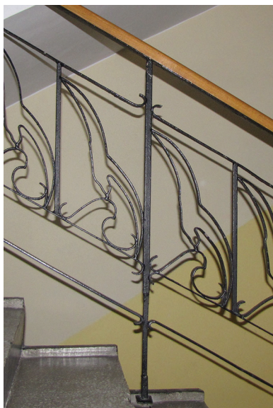
Metalowa balustrada o indywidualnym motywie mew i morskich fal we wnętrzu powojennego budynku Akademii Marynarki Wojennej przy ul. Śmidowicza 69