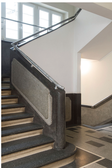
Balustrada murewana zwieńczona metalową poręczą. Klatka schodowa w kamienicy przy ul. Abrahama 28