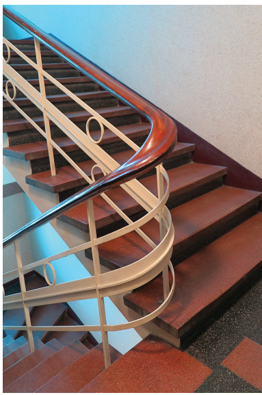
Metalowa balustrada zwieńczona drewnianą poręczą. Klatka schodowa w kamienicy przy ul. Świętojańskiej 18

→ Drewniane schody z dekoracyjnym początkowym słupkiem w willi Luiza przy ul. 10 Lutego 18