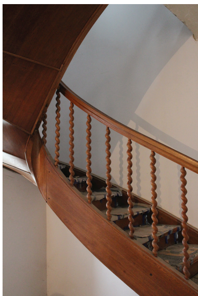
Profilowane słupki balustrady schodów w willi przy ul. Chylońskiej 112

Dbałość o historyczny wystrój klatek schodowych oraz oryginalne elementy ich wyposażenia to krok do zachowania wyjątkowego charakteru miejsca oraz jego klimatu. Wbrew pozorom renowacja i utrzymanie, nawet już mocno zniszczonych, balustrad nie jest bardzo trudna. Wiele właścicieli i użytkowników budynków zabytkowych w Gdyni, świadomych tych walorów, dokłada wielu starań w celu zachowania autentycznych detali architektonicznych.