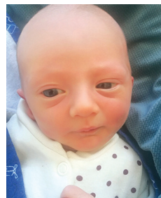
Marcel, 17.04, 2890 g, 50 cm