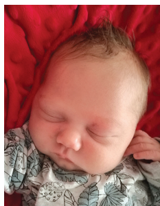
Blanka, 12.04, 3390 g, 51 cm