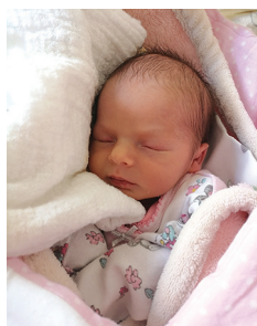
Pola, 13.04, 2000 g, 47 cm