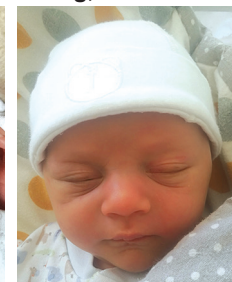
Piotruś, 17.04, 3330 g, 56 cm