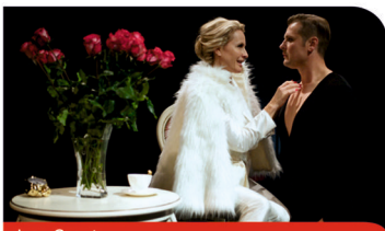
Jean Genet POKOJÓWKI

Z życia niższych sfer. Klasyka francuskiego dramatu, ale i scenariusz na hollywoodzki hit!