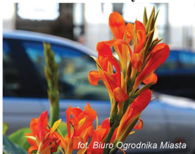
fol. Biuro Ogrodnika Miasta

Kłaczka (odmiana żółta, pomarańczowa i czerwona) będą wydawane od 30 października do wyczerpania zapasów w godz. 9.00-15.00 na terenie siedziby Biura Ogrodnika Miasta na Kolibkach (ul. Zwycięstwa 291).