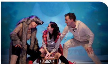
Hans Christian Andersen KRÓLOWA ŚNIEGU

Familijna baśń o wielkiej przyjaźni, która zwycięża wszelkie zło!