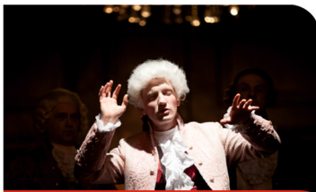
Peter Shaffer AMADEUSZ

Wirtuoz i prowokator. Genialne dziecko, historyczny artysta, nieokietznany duch.