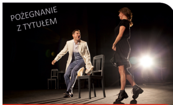
Fiodor Dostojewski BIESY

Metafizyka, polityka i destrukcyjna namiętność. Arcydzieło światowej literatury.