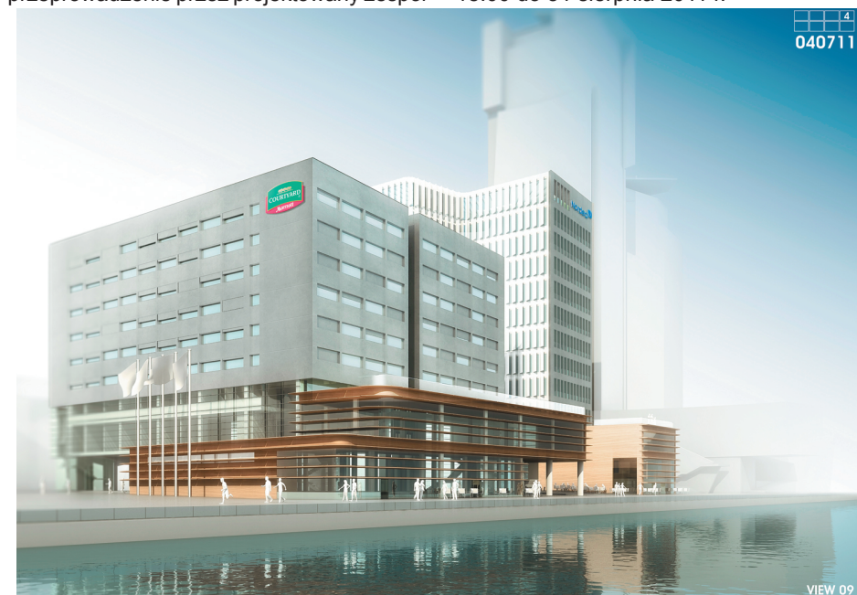
Zwycięski projekt Przedsiębiorstwa Projektowo - Wdrożeniowego FORT Sp. z o.o z Gdańska