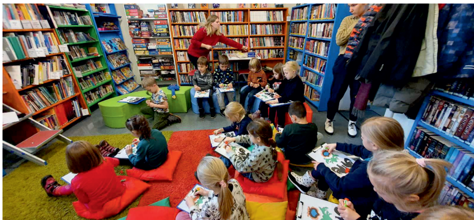
Заняття для дітей в Бібліотеці Гдиня

Команда фахівців (Zespół Pracówek Specjalistycznych) здійснює допомогу, шляхом роботи з сім'ями, соціотерапевтичних заходів, підтримки процесу інтеграції і забезпечення дітей та молоді місцями в центрах денного перебування (SPOT), а у навчанні та підготовці домашніх завдань. Також доступна україномовна підтримка у Центрі кризового втручання працює консультант COUCB («Як ти?»), психолог-консультант та перекладач-консультант з української мови.