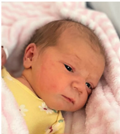
Alisa , 50 cm, 2590 g, 26.04