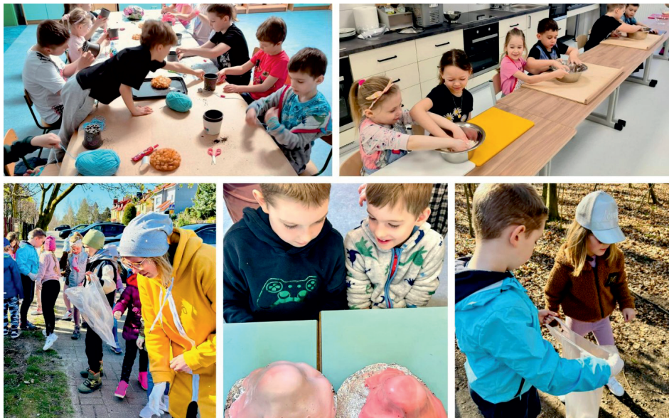
–Школи в Гдині навчають і об'єднують

Додаткові уроки, додатковий педагогічний склад, додаткова увага до кожного учня - це все завдяки фінансовій підтримці ЮНІСЕФ у школах Гдині реалізується низка заходів, спрямованих на інтеграцію дітей. Освіта є дуже важливим елементом співпраці з ЮНІСЕФ і включає в себе 20 заходів загальною вартістю понад 13 мільйонів злотих.