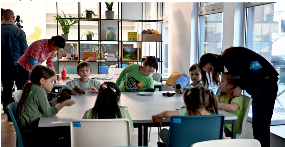
Перший майстер-клас у Спільно

У самому центрі Гдині на вулиці Старовейській 25 (Starowiejska 25) знаходиться Спільно Гдиня. Це місце, де діти та дорослі, які втікають від війни, можуть відчути себе в безпеці, отримати необхідну підтримку та зустріти нових друзів. Пункт, яким можуть користуватися всі мешканці нашого міста, відкрився в березні, завдяки співпраці міста з ЮНІСЕФ.