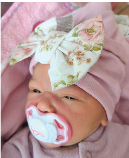
Sandra , 55 cm, 3950 g, 26.04.