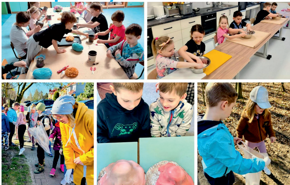
Gdyńskie szkoły uczą i integrują // fot. Szkoła Otwarta przy SP 48

Dodatkowe lekcje, dodatkowa kadra, dodatkowa uwaga poświęcona wszystkim uczniom – dzięki finansowaniu przekazanemu przez UNICEF w gdyńskich szkołach prowadzonych jest szereg działań integrujących dzieci. Edukacja, bardzo ważny element współpracy z UNICEF, to 20 aktywności za ponad 13 mln zł.