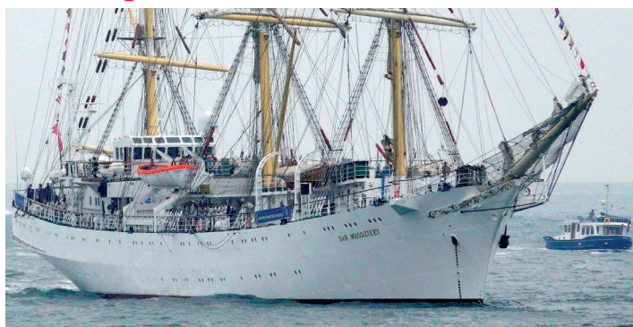
„Dar Młodzieży” w akcji podczas pierwszego etapu The Tall Ships Races 2023, po wypłynięciu z holenderskiego Den Helder// fot. mat. prasowe Sail Training International, sailtraininginternational.org

Zmagania załóg będzie można (tak samo, jak w przypadku zakończonych zmagania) śledzić online dzięki trackingowi z nadajników GPS, na stronie organizatora, Sail Training International: sailtraininginternational.org .