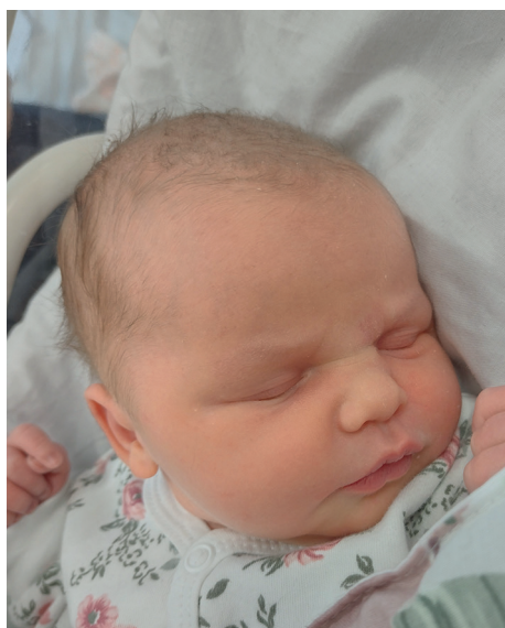
Gabriela , 55 cm, 3600 g, 19.07

Podmiot Lecznicy Samorządu Województwa Pomorskiego