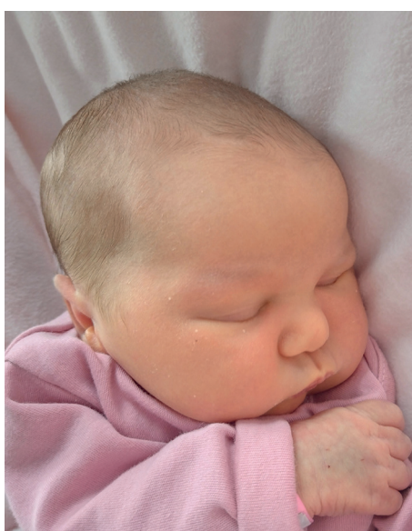
Wiktoria , 55 cm, 3290 g, 29.07