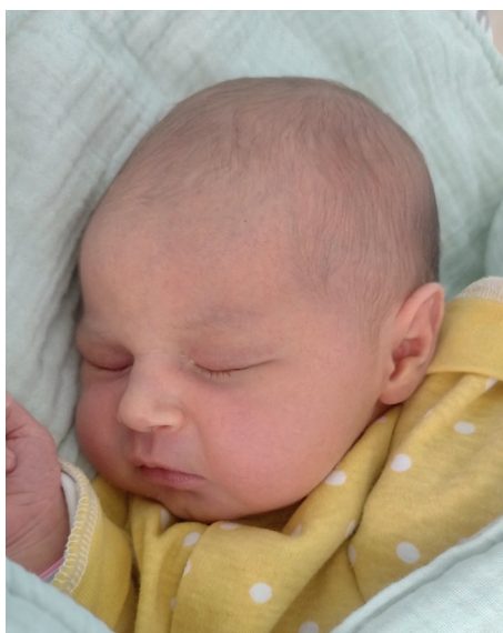
Gaja , 56 cm, 3380 g, 2.08