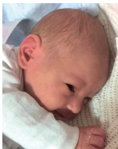
Leon , 53 cm, 3150 g, 20.07