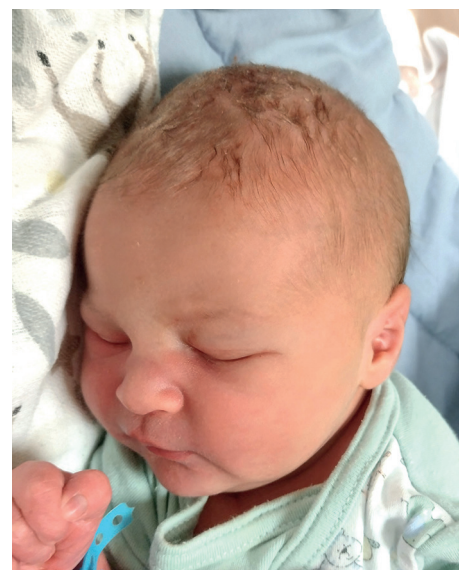
Jaś , 54 cm, 3560 g, 31.07