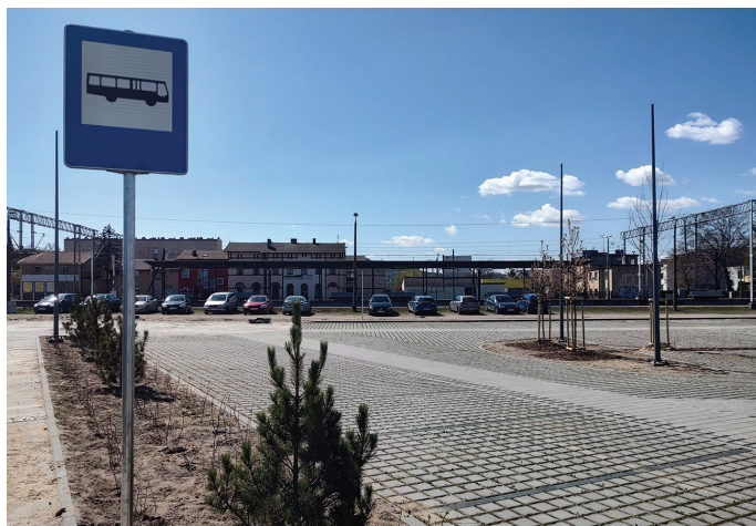
Zrewitalizowana część osiedla Meksyk - to tutaj powstała nowa ulica Meksykańska i m.in. duży parking