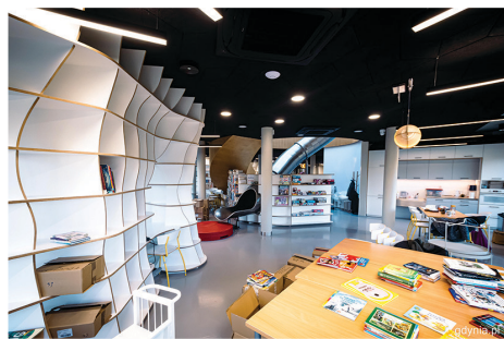
Przestrzeń łącząca funkcje biblioteki i przystani sąsiedzkich w Przystani Łowicka 51, fot. Kamil Zloch

- W 2022 roku Biblioteka Gdynia przygotowała dla swoich czytelników ponad 700 różnych wydarzeń – warsztatów oraz spotkań z literaturą. Na początku każdego miesiąca czytelnicy mogli również korzystać z dostępu do bazy e-booków w portalu Legimi. Poza tym miniony rok to trzy nowe otwarte, nowoczesne filie: Biblioteka Pustki Cisowskie, Biblioteka Cisowa oraz długo wyczekiwana przez mieszkańców Biblioteka Mały Kack.