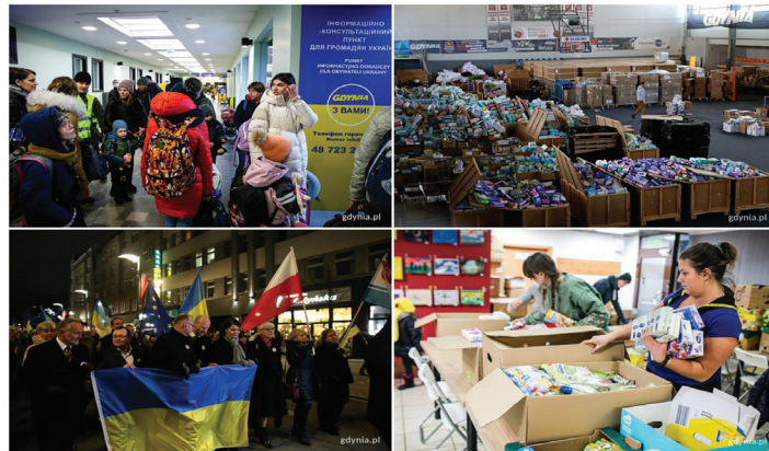
Kolaż zdjęć, od lewego górnego zgodnie z zegarem: punkt informacyjny na dworcu PKP, fot. Przemysław Kozłowski; sala gier GCS, fot. Przemysław Kozłowski; sortowanie darów w GCOP, fot. Karol Stańczak; marsz pokoju i solidarności, fot. Przemysław Kozłowski

tem solidarności – oba miasta podpisały poprzez most internetowy dokument o współpracy. I tak każde z nich zyskało nowe siostrzane miasto. Decyzję o partnerstwie podjęli miejscy radni przyjmując uchwałę podczas XLI sesji 27 kwietnia. Dzień później na placu kończącym ulicę Armii Krajowej odbyła się uroczystość nadania nazwy plac Wolnej Ukrainy.