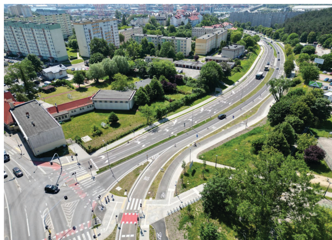
Widok na nową ulicę Kwiatkowskiego