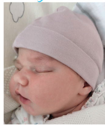
Helena, 15.01 56 cm, 4010 g