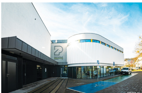
Nowoczesna bryła Przystani Łowicka 51, we wnętrzu znajdują się pomieszczenia Biblioteki Gdynia, siedziba Rady Dzielnicy i centrum sąsiedzkie