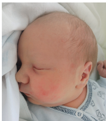
Leon, 18.01 53 cm, 3550 g