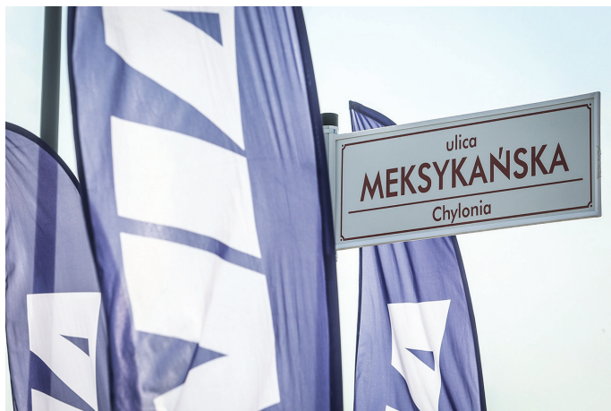
Nowa ulica Meksykańska