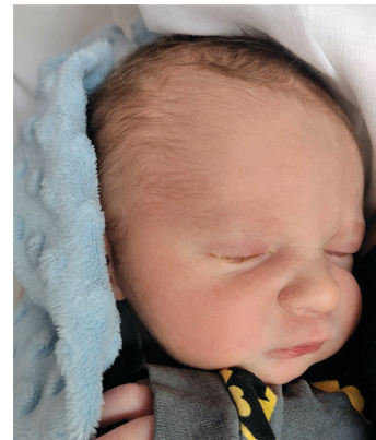
Leon, 19.01 56 cm, 3580 g