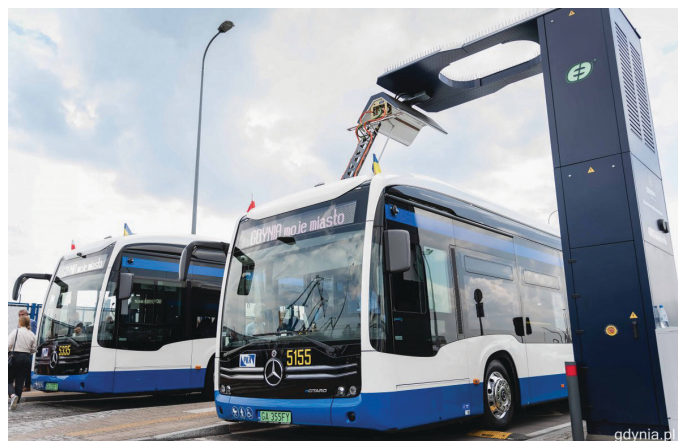
Premiera nowych gdyńskich elektryków eCitaro przy Muzeum Emigracji

Wcześniej w różnych dzielnicach miasta, w tym na Oksywiu, Witominie-Leśniczówce, w Śródmieściu oraz na Wzgórzu św. Maksymiliana powstało łącznie 7 stacji pantografowych szybkiego ładowania. Rozmieszczono je na już istniejących pętlach autobusowych i przystankach końcowych – tak, aby ułatwić ładowanie baterii podczas postoju, umożliwiając całodzienną eksploatację elektryków.