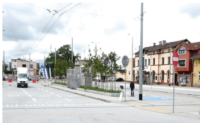
Węzeł Chylonia - zrównoważony transport na szóstkę

Projekt pod nazwą „Rozwój zrównoważonego transportu publicznego w Gdyni poprzez inwestycje infrastrukturalne, m.in. utworzenie węzła integracyjnego Gdynia Chylonia” był współfinansowany z unijnych środków pochodzących z Funduszu Spójności, w ramach Programu Operacyjnego Infrastruktura i Środowisko na lata 2014-2020. Ogólna wartość projektu to 88 414 081 PLN. Wydatki kwalifikowane w projekcie wyniosły 53 651 240 PLN, natomiast dofinansowanie ze środków UE – 40 238 430 PLN.