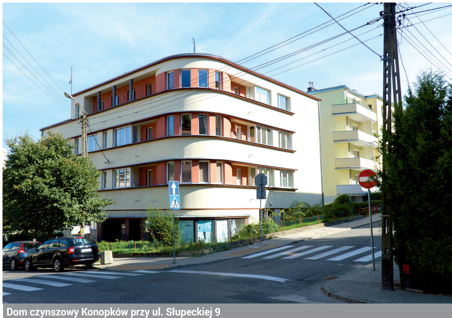
Dom czynszowy Konopków przy ul. Słupeckiej 9

Różnorodna architektura modernistyczna Działek Leśnych zachęca do jej poznawania podczas spa-