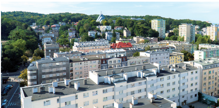
Bliskość Śródmieścia, malownicze położenie i sąsiedztwo natury - oto zalety Działek Leśnych

Nowa dzielnica, rozparcelowana na zalesionych wzgórzach pomiędzy ul. Leśną od północy (obecnie ul. Wolności), ul. Pomorską od wschodu i ul. Witomińską od zachodu, szybko stała się dzielnicą willową konkurującą z Kamienną Górą. Bliskość Śródmieścia, malownicze położenie i sąsiedztwo natury spowodowały, że jej mieszkańcami byli głównie ludzie majątni, których stać było na wzniesienie domu według indywidualnych projektów. Do dziś można tu podziwiać perły architektury moderni-