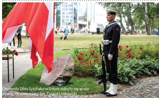
Obchody Dnia Sybiraka w Gdyni odbyły się w niedzielę, 16 września