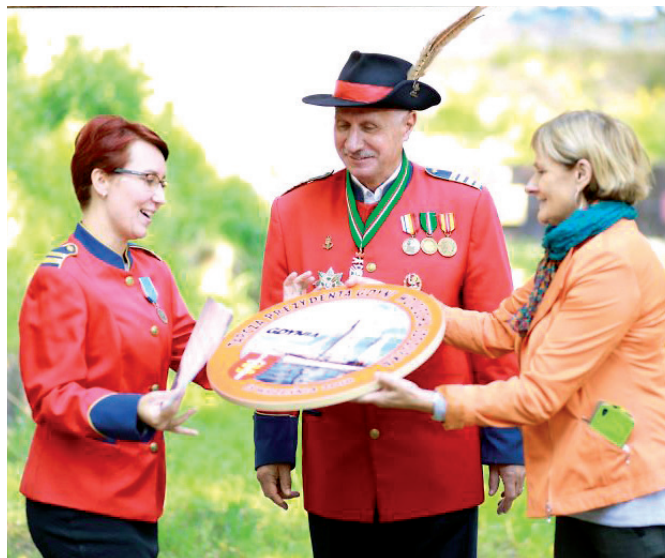
Charytatywny turniej o tarczę Prezydenta Gdyni

Kurkowe Bractwo Strzeleckie w Gdyni jest stowarzyszeniem, członkiem Polskiego Związku Strzelectwa Sportowego i posiada licencję klubową. Opiekuje się Parkurem Strzeleckim im. Józefa Hallera von Hallenburg znajdującym się przy II Liceum Ogólnokształcącym na ul. Wolności 22B. To miejsce użyteczności publicznej dostępne dla wszystkich mieszkańców. Odbywają się tu spotkania sekcji wiatrówkowej, łuczniczej oraz ASG. Kurkowe Bractwo Strzeleckie