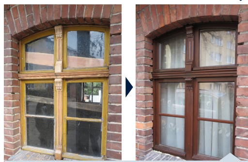
Dom Bieszków, rok budowy 1914, ul. św. Mikołaja 9

Okno przed i po renowacji przeprowadzonej w 2016 roku. W niektórych budynkach historycznych w Gdyni okna mają już ponad 100 lat, a wbrew pozorom ich stan techniczny wciąż jest dobry.