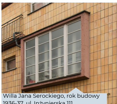
Willa Jana Serockiego, rok budowy 1936-37, ul. Inżynierska 111

Renowacja i modernizacja (w tym uszczelnienie) okien drewnianych jest możliwa do wykonania, a przy odpowiedniej konserwacji i pielęgnacji, mogą one zachować swoje właściwości i estetyczny wygląd na bardzo długo. Wielu właścicieli dawnych willi i mieszkań w kamienicach zdecydowało się na zachowanie i renowację drewnianych okien, doceniając tym sposobem historyczny materiał, tradycyjne rzemiosło oraz rolę, jaką stolarka okienna odgrywa w odbiorze całego budynku. Poniżej znajdują się realizacje polegające na konserwacji stolarki okiennej, stanowiące przykłady prawidłowych rozwiązań odnowy i polepszenia parametrów izolacyjności na terenie miasta Gdyni.