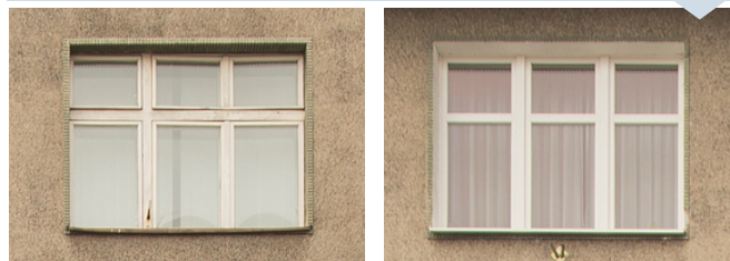
Dawna kamienica J. Radtkego, rok bud. 1934-35, ul. Świętojańska 18

Bezmyślna wymiana okien prowadzi do pogłębiania się chaosu przestrzennego. W wielu, nawet bardzo znanych budynkach, wymiana okien spowodowała degradację ich walorów estetycznych. Poniższy przykład ukazuje całkowitą utratę charakterystycznych podziałów okiennych, w jednym z ikonicznych budynków z lat 30. XX w. .