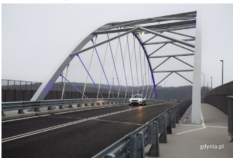
Wiadukt na Puckiej został otwarty 3 grudnia

Na wiadukcie wytyczono dwa pasy ruchu, 1,5-metrowy chodnik dla pieszych oraz ścieżkę rowerową. Obiekt został zabezpie-