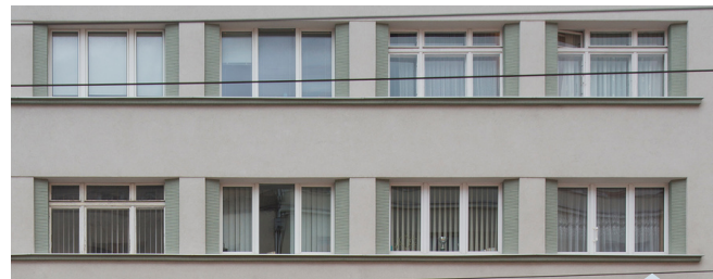
Dawna kamienica Wegnera, rok bud. 1937, ul. Świętojańska 89

Bezmyślna wymiana okien prowadzi do pogłębiania się chaosu przestrzennego. W wielu, nawet bardzo znanych budynkach, wymiana okien spowodowała degradację ich walorów estetycznych. Poniższy przykład ukazuje całkowitą utratę charakterystycznych podziałów okiennych, w jednym z ikonicznych budynków z lat 30. XX w. .