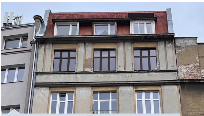
Dawna kamienica Czoski, rok budowy 1929, ul. Portowa 5

Jedna elewacja, dwa mieszkania oraz zupełnie inne okna. Pomimo próby zastosowania analogicznych podziałów okiennych, nie udało zachować się m.in. proporcji oraz typowej dla przedwojennych okien konstrukcyjnej belki poziomej, tzw. ślemienia, przez co zaburzonego układu kompozycyjny otworu okiennego. Grube, plastikowe słupki (po prawej) zmniejszyły także powierzchnię przeszklenia.