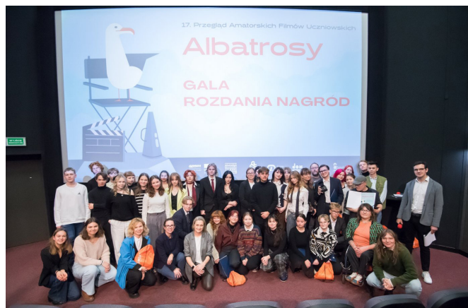
Laureaci 17. Przeglądu Filmów Uczniowskich Albatrosy