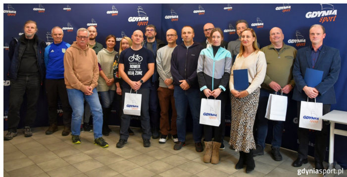
Zwycięskie firmy podczas wręczenia nagród

– Firma 6-20-osobowa: 1 WTM – Dział Remontu Sprzętu Ratow-