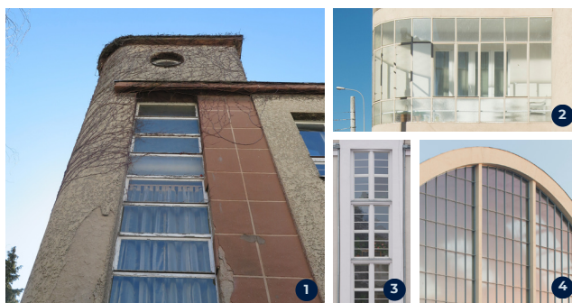
Budynki z fotografii: 1. ul. Kasztelańska 21, 2. ul. Świętojańska 122, 3. ul. Piotra Skargi 6, 4. Hala Targowa

Początkiem różnego rodzaju zmian w architekturze, takich jak na przykład duże powierzchnie przeszkleń na elewacjach z podziałami na mniejsze pola, można zauważyć w projektach budynków w Gdyni. Przykładem są nowoczesne okna o różnych kształtach, w tym charakterystyczne okna narożne, okna i witryny z zaokrąglonymi szybami, okna horyzontalne, rozmieszczone wzdłuż całej elewacji, które zapewniały doskonałe doświetlenie wnętrz oraz popularne w architekturze modernistycznej tzw. „termometry” – długie pasy pionowych przeszkleń, umieszczane najczęściej w pomieszczeniach klatek schodowych.