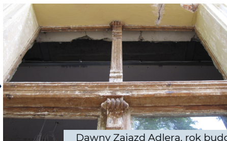
Dawny Zajazd Adlera, rok budowy ok. 1840, ul. Orłowska 8