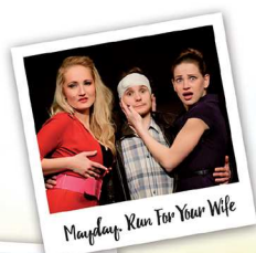
Mayday. Run For Your Wife