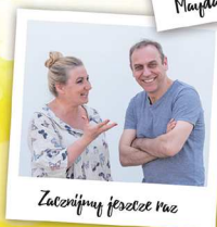
Zacznijmy jeszcze raz

3.08.17, czwartek, godz. 19:00 4.08.17, piątek, godz. 19:00 5.08.17, sobota, godz. 19:00 6.08.17, niedziela, godz. 17:00