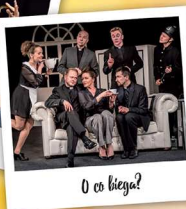
O co biega?