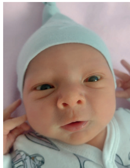
Lilia , 54 cm, 3380 g, 6.12