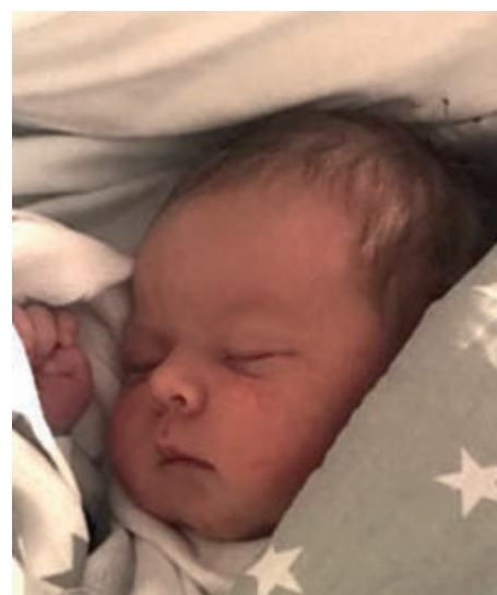
Mikołaj , 56 cm, 3290 g, 29.11