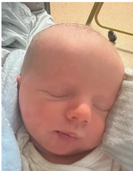
Julian , 52 cm, 3150 g, 29.11