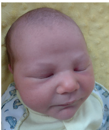
Mikołaj , 54 cm, 3590 g, 6.12