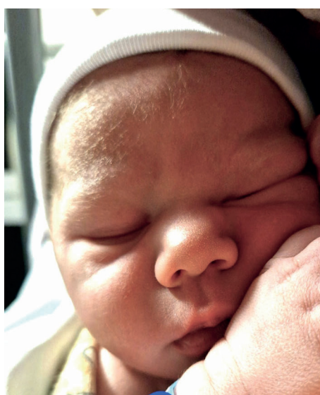
Maks , 53 cm, 3400 g, 29.11