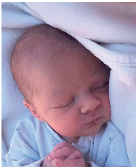
Maja , 52 cm, 2720 g, 28.11