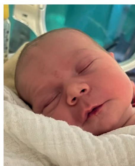
Maksymilian , 54 cm, 3750 g, 05.12