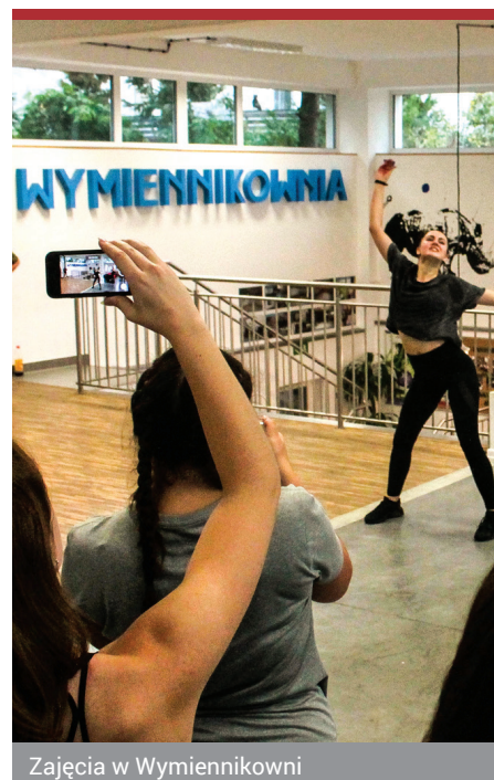
Zajęcia w Wymiennikowni

Marzy mi się przede wszystkim przywrócenie blasku dawnej kaszubskiej zabudowie, zdominowanej w latach 60. przez blokowiska. To prawdziwa historia tej dzielnicy.