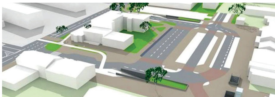
Wizualizacja węzła integracyjnego Gdynia Chylonia

Wiceprezydent Gdyni ds. edukacji i zdrowia