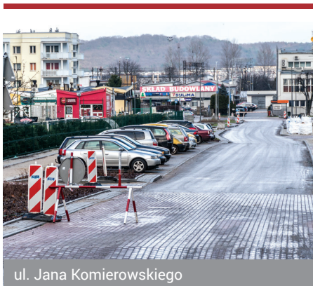
ul. Jana Komierowskiego