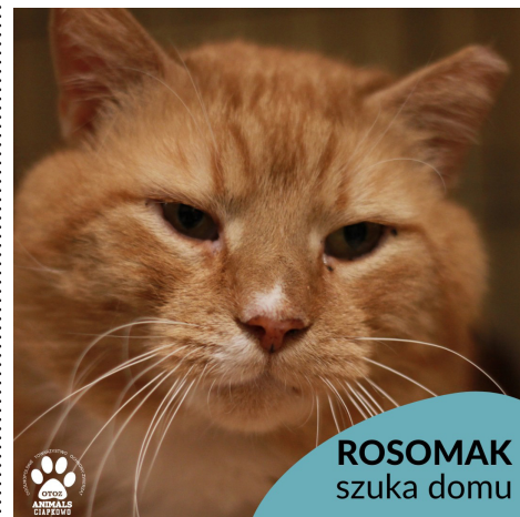
ROSOMAK szuka domu

Spokojny, kocur w sile wieku. Ten piękny, dostoyny rudzielec żył kiedyś na ulicy, bał się kontaktu z człowiekiem. Dziś już wie, że nie wszyscy ludzie są źli, a głaskanie jest nawet przyjemne. Rosomak oprócz głaskania uwielbia odpoczywać w spokojnym miejscu. Jest ogromnym łakomczuszkiem.