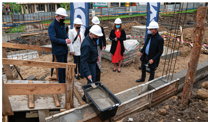
Wmurowanie kamienia węgielnego na budowie Przystani Widna 2A. W środku Wojciech Szczurek, prezydent Gdyni.

Koszt robót to prawie 270 tysięcy złotych.