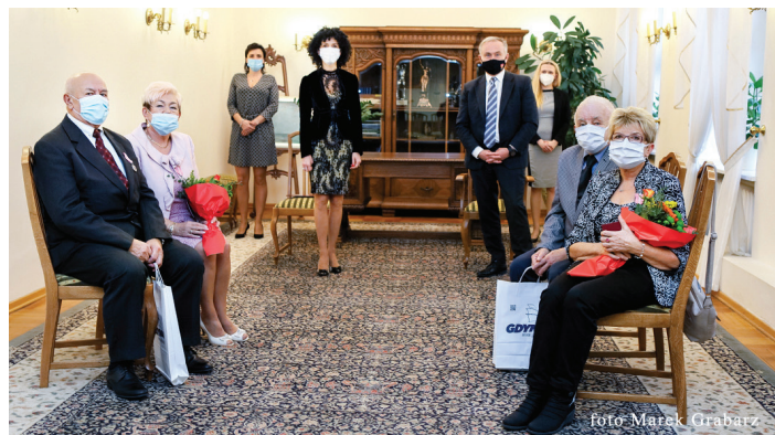
Uroczystości 29 listopada, godz. 15.00.