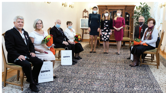
Uroczystości 22 listopada, godz. 14.00.