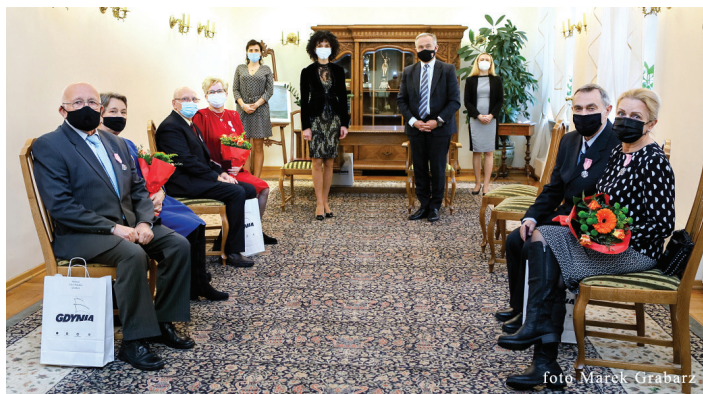
Uroczystości 29 listopada, godz. 14.00.