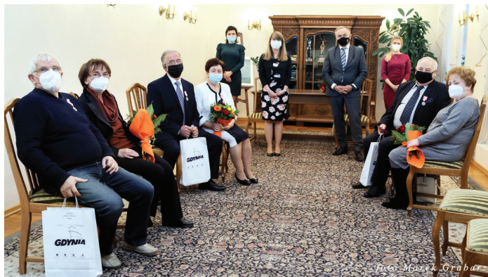
Uroczystości 22 listopada, godz. 15.00.