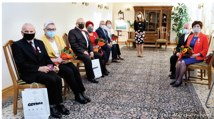
Uroczystości 22 listopada, godz. 13.00.