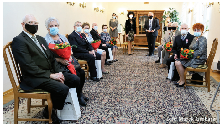
Uroczystości 29 listopada, godz. 13.00.