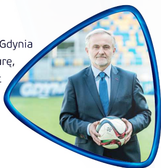
Wojciech Szczurek Prezydent Gdyni

Zrobimy wszystko, aby zagwarantować najwyższy możliwy poziom organizacyjny imprezy. Gdynia posiada nie tylko niezbędne doświadczenie, ale również doskonale przygotowaną infrastrukturę, na której niejednokrotnie rywalizowały młodzieżowe reprezentacje. Mieszkańcy Gdyni od lat zakochani są w sporcie. Już nie możemy doczekać się chwil, gdy wspólnie dopingować będziemy aktualne i przyszłe gwiazdy światowego futbolu.