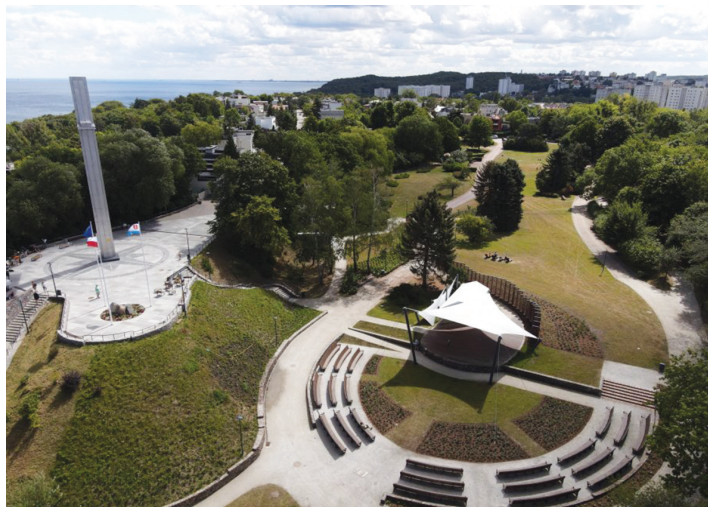
Rewitalizacja parku na Kamiennej Górze to m.in. nowa scena plenerowa, winda czy ogólnodostępne toalety

W czerwcu dokonano odbioru prac rewitalizacyjnych po pierwszym etapie w parku na Kamiennej Górze . Zmiany objęły jego górny i środkowy taras. Nowoczesna winda, ogólnodostępne toalety, zaplecze techniczne i nowa plenerowa scena letnia z widownią – to najważniejsze elementy rewitalizacji wartej prawie 10 mln zł .