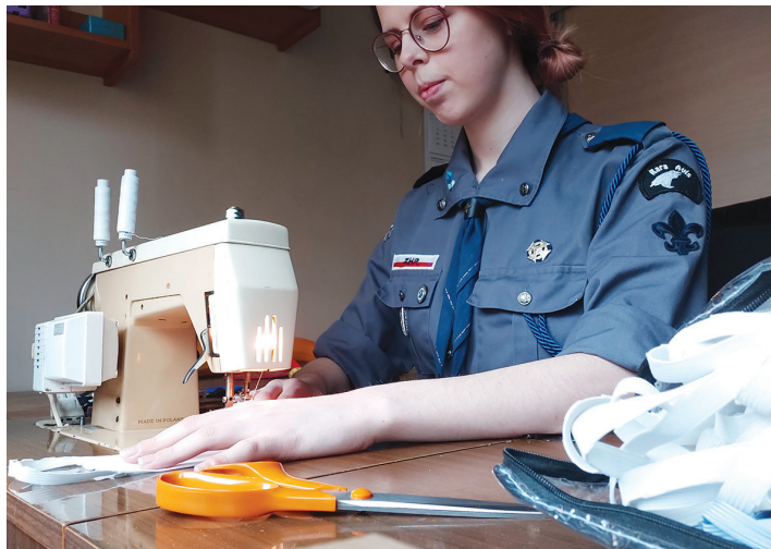
W akcję szycia maseczek włączyły się osoby prywatne, harcerze, firmy

Do szycia na maszynach i ręcznie siedli wolontariusze, harcerze i organizacje pozarządowe w ramach akcji #ngosySZYJAMASKI-3city , łączącej wymiar społeczny z edukacyjnym i ekologicznym. Firmy zaczęły laserowo wycinać przyłbice. Do najbardziej potrzebujących trafiły poprzez harcerzy maseczki zamówione przez miasto w gdyńskich Zakładach Odzieżowych „Wybrzeże” Spółdzielnia Inwalidów oraz podarowane przez firmę LPP .