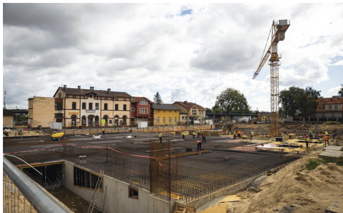
Prace przy realizacji parkingu podziemnego węzła integracyjnego Gdynia Chylonia pod koniec lipca 2020 roku.

Węzeł Chylonia jest na półmetku. Po byłym placu przed dworcem w Chyloni nie ma już śladu, gotowy jest podziemny parking, trwają jeszcze prace nad pozostałymi, nadziemnymi elementami infrastruktury, które stworzą wygodne miejsce do przesiadki między różnymi środkami transportu.