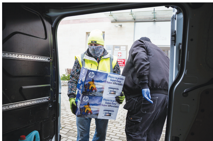
Tablety przekazane przez darczyńców za pośrednictwem Miejskiego Ośrodka Pomocy Społecznej trafiły do rodzin, które nie posiadały odpowiednich narzędzi do nauki zdalnej

Miasto nawiązało również współpracę z podmiotami prywatnymi, które przekazały lub sfinansowały zakup sprzętu na potrzeby zdalnej edukacji.